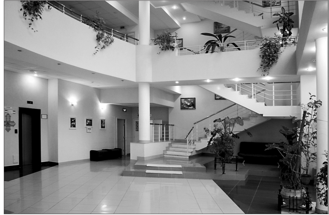
В холле уютно и красиво.