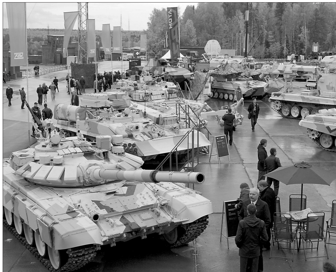
На площадке УВЗ.