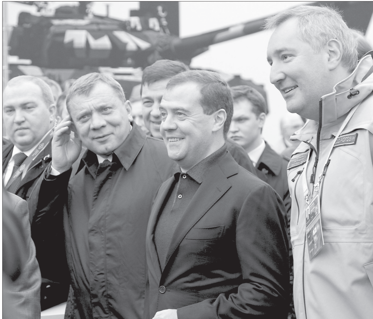
Премьер-министр доволен: «Знали, что показать!»