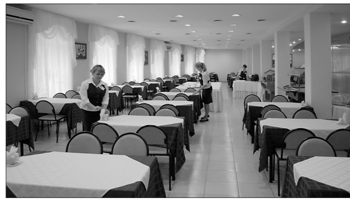
В столовой санатория.