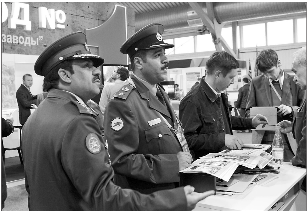
Представителей делегации Кувейта интересуют ракетные комплексы.