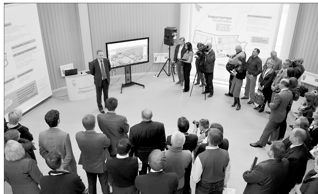
Презентация проекта ОЭЗ «Титановая долина».

ООО «Уральский оптический завод», один из первых резидентов, планирует наладить в «Титановой долине» производство оптического кабеля. На первом этапе он будет выпускаться из готового волокна. Наличие месторождений кварца на Урале даст возможность выйти на полный производственный цикл: начиная от добычи и переработки минерала, производства волокна и за-