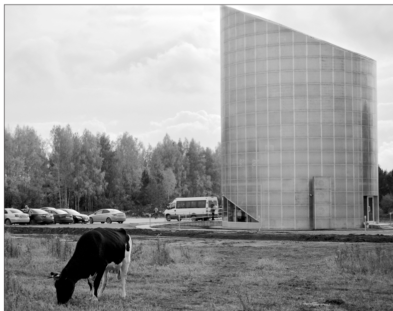
Около здания инфокуба пока пасутся коровы.

канчивая выпуск готовой продукции. Основной потребитель оптического кабеля - телеком-отрасль.