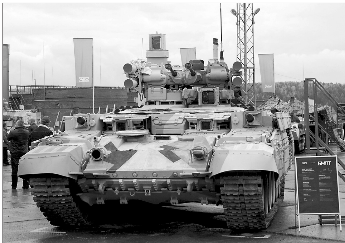
Боевая машина поддержки танков «Терминатор-2».

В пятницу, в предпоследний день выставки, специально для российских и иностранных специалистов, а также журналистов средств массовой информации впервые была продемонстрирована новая разработка Уралвагонзавода - боевая машина поддержки танков «Терминатор-2», созданная на базе танка Т-72.