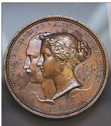
Одна из медалей экспозиции.

Район, где находится усадьба, на карте 1843 года обозначен как «Матильдино предместье». Это название дано в честь супруги Анатолия Демидова, принцессы Матильды де Монфор, племянницы императора Наполеона Бонапарта. При строительстве дачи был удачно использован рельеф местности. Со стороны дороги (ул. Красногвардейская) она выглядит одноэтажной. С трех других сторон имеет два этажа. На чертеже 1876 года, названном «План и фасад дачи Павла Павловича Демидова, князя Сан-Донато,