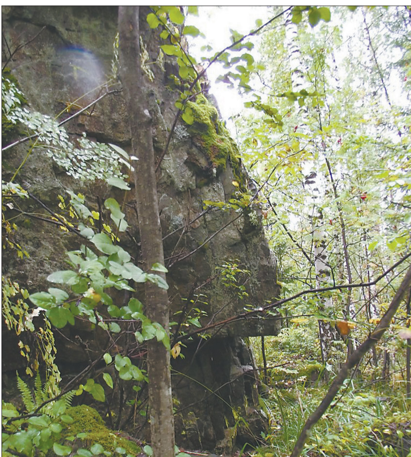
На скале словно профиль человека из камня вытесан...