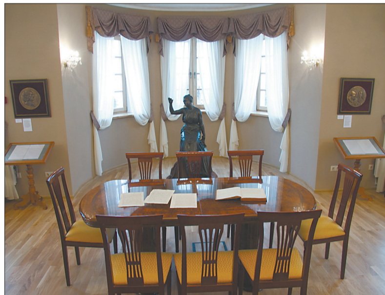
Интерьер тоже красив.

В день открытия сотрудники музея провели первую экскурсию. На первом этаже усадьбы