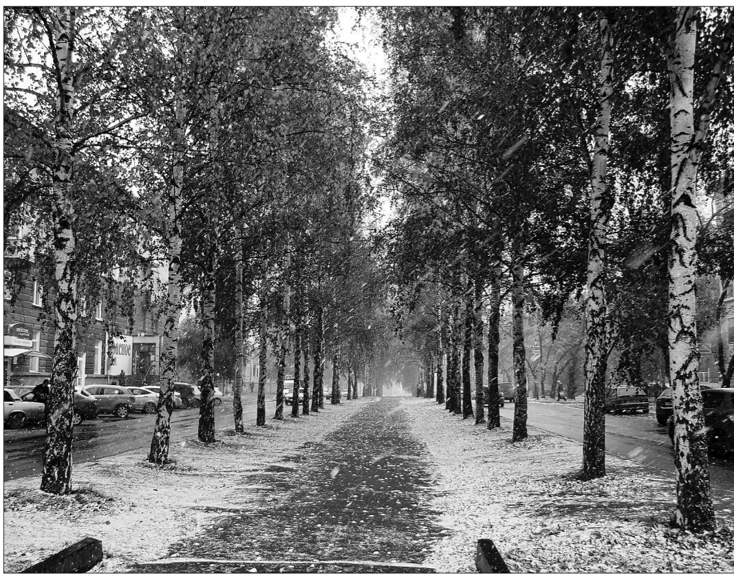
Проспект Мира на несколько минут засыпало снегом.