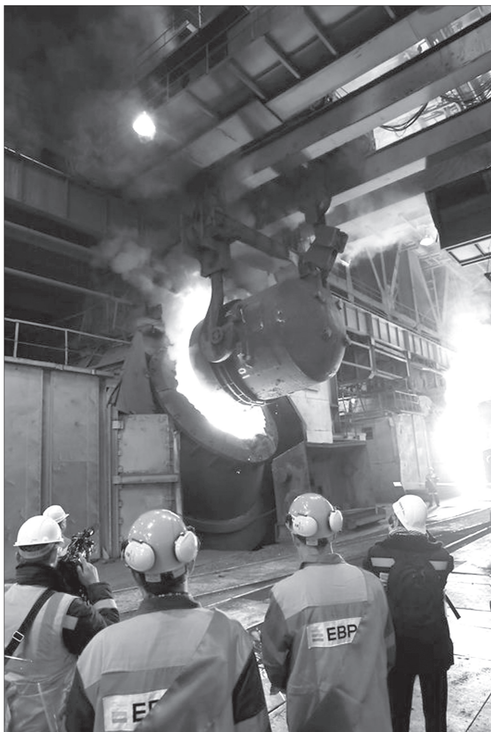
Чугун заливают в конвертер №1.