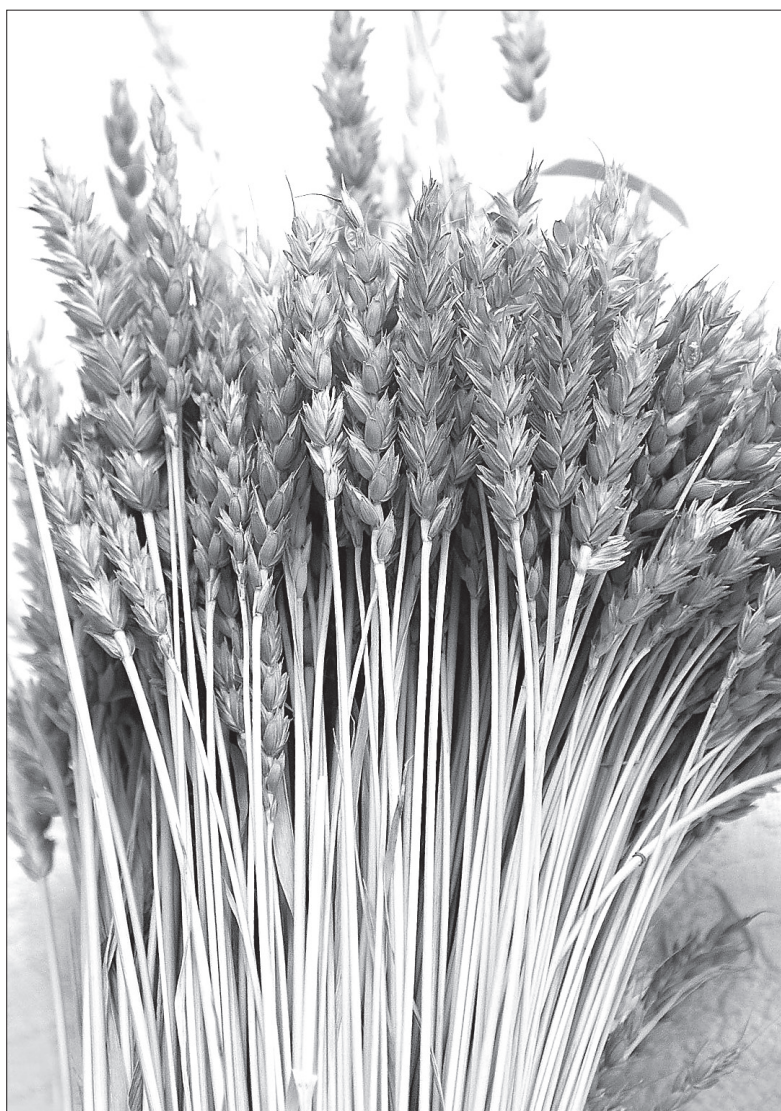
Пшеница занимает достойное место среди других образцов зерновых культур.