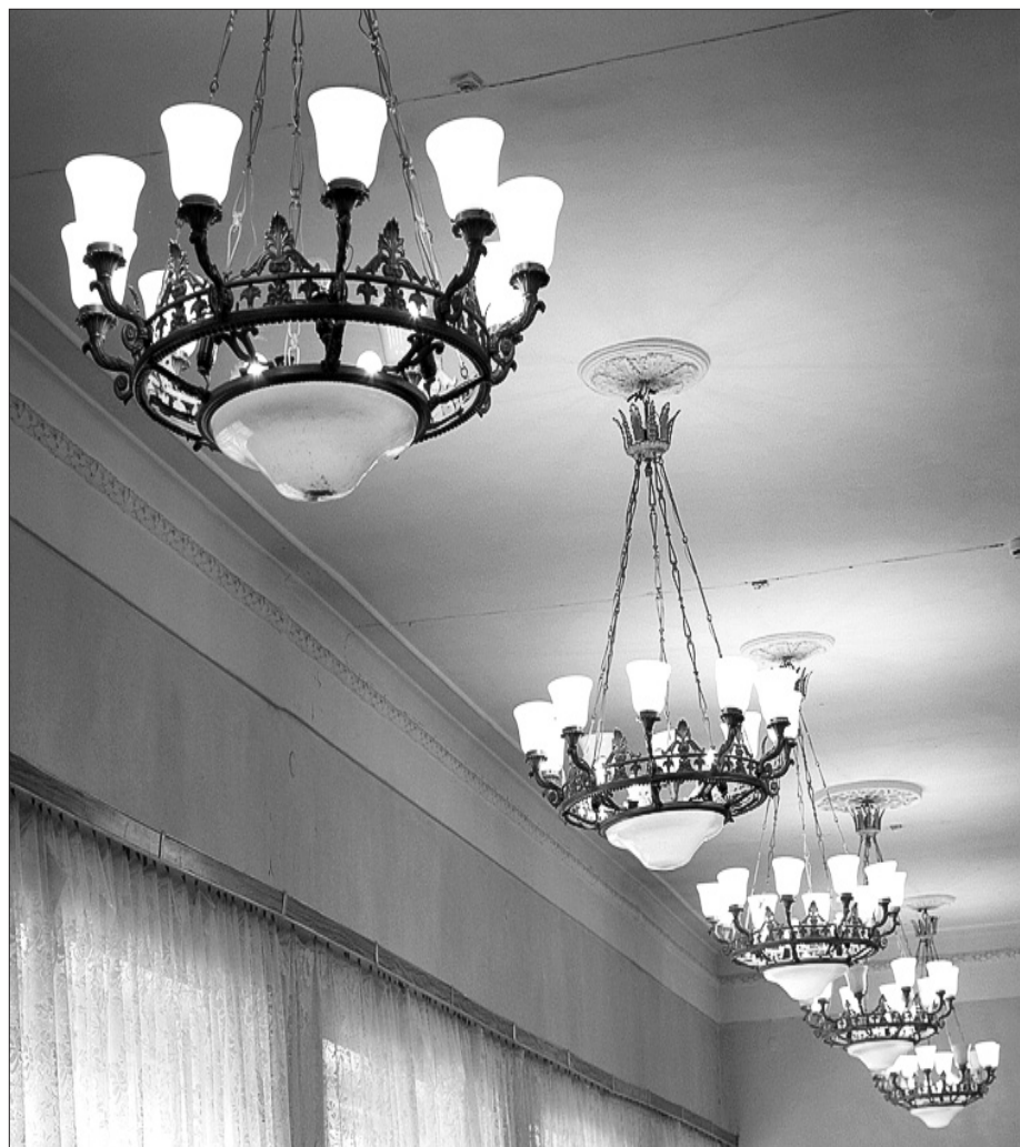
Знаменитые люстры читального зала.

Безмолвствует черный обхват переплета, Страницы тесней обнялись в корешке, И книга недвижна. Но книге охота Прильнуть к человеческой теплой руке... Михаил Светлов, «Книга»