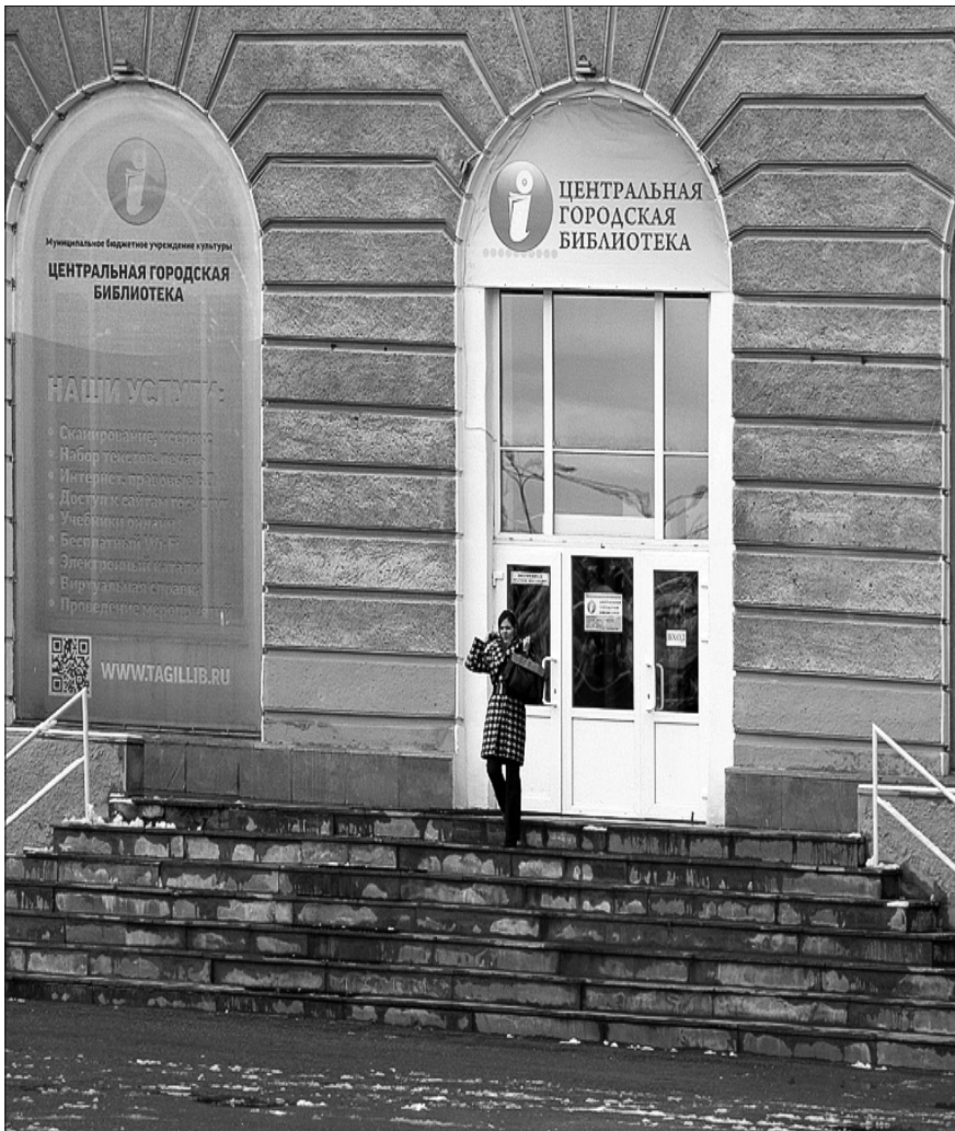
Зданию популярного у тагильчан учреждения культуры нужен ремонт.