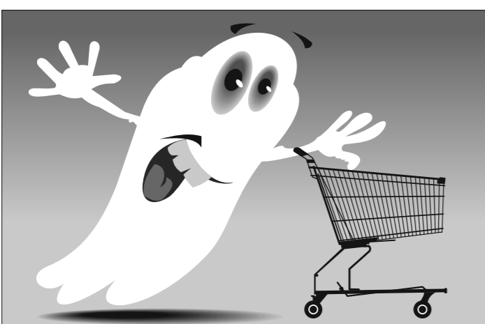
Иллюстрация Петра Упорова.

В Энистоне, штат Алабама (США), человека, попытавшегося украсть магазин в костюме призрака, что-то спугнуло и он убежал без добычи.