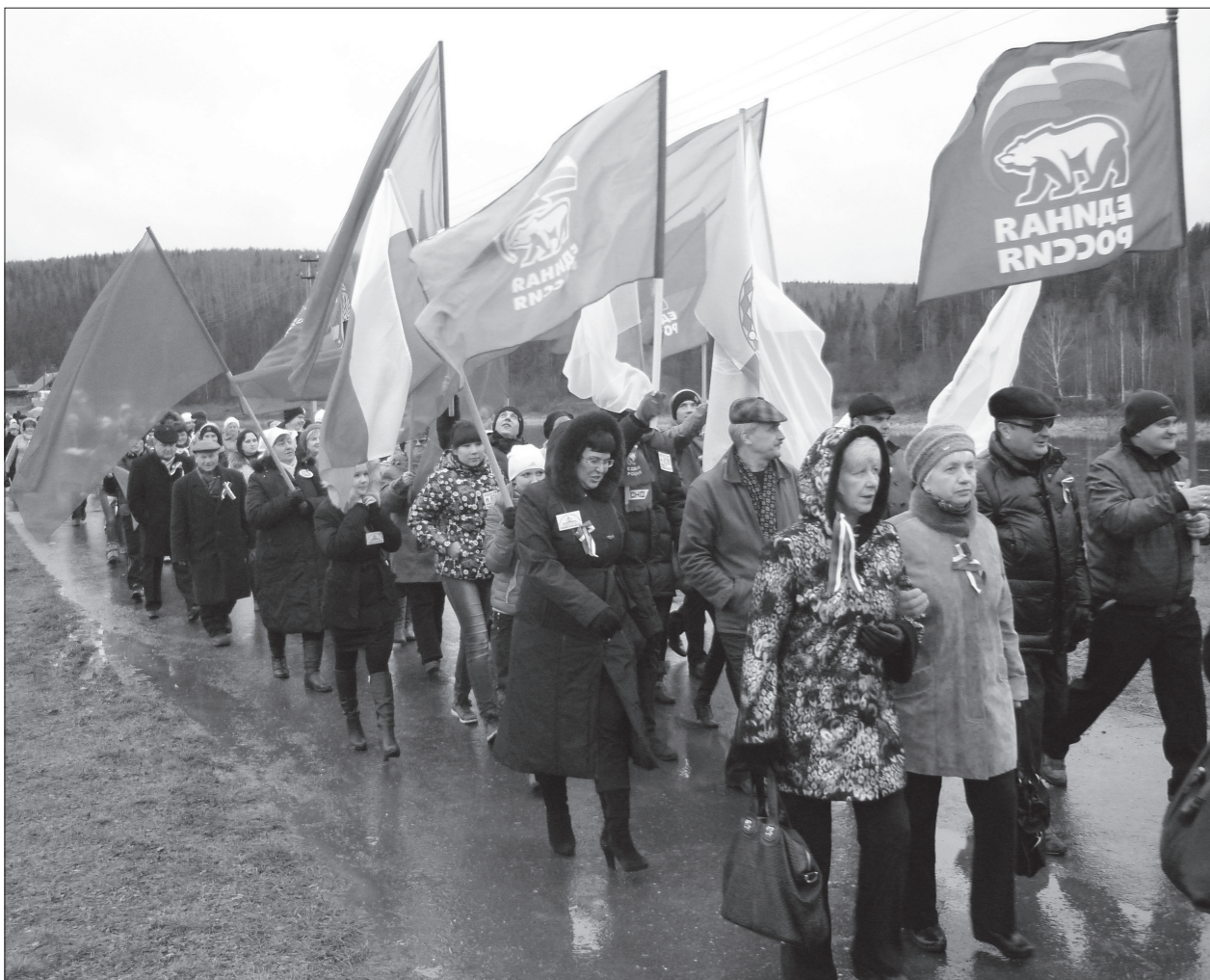
Праздничная процессия растянулась на сотню метров.