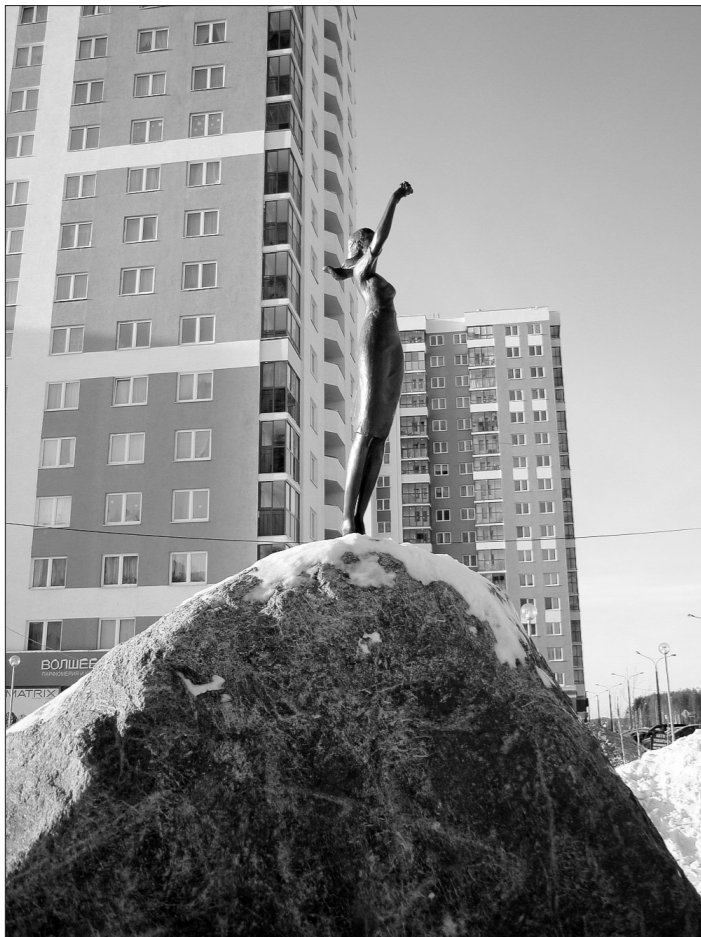
Как уверяют жильцы Академического, эта скульптура приносит удачу.