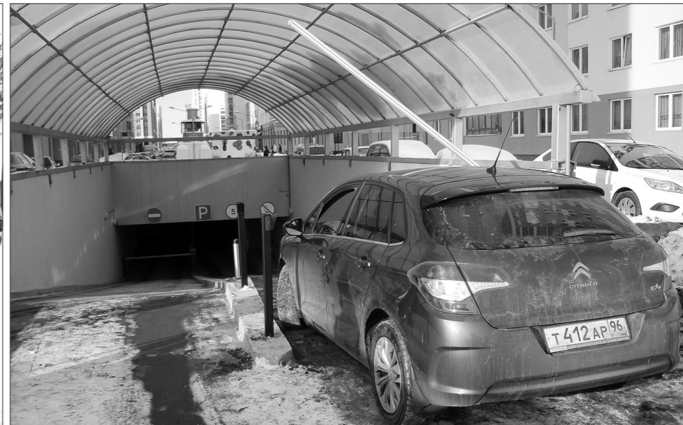
Под каждым жилым домом - подземная парковка.