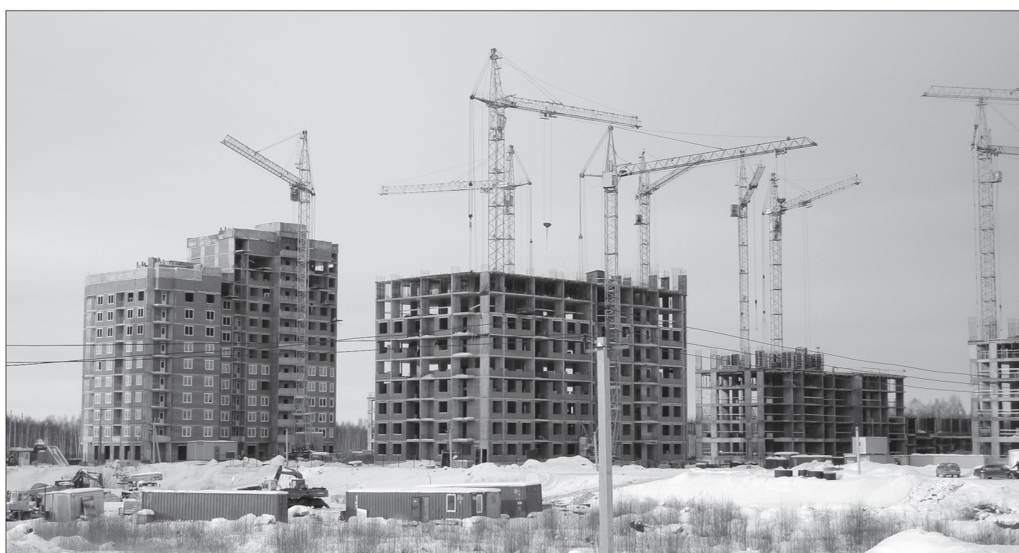
Строительство Академического идет активными темпами.

На минувшей неделе делегация из Нижнего Тагила, в состав которой вошли представители управляющих компаний, общественных организаций, архитекторы, рабочая молодежь и СМИ, посетила строящийся район Академический в Екатеринбурге.