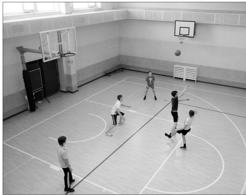
Школьный спортзал - просторный и светлый.