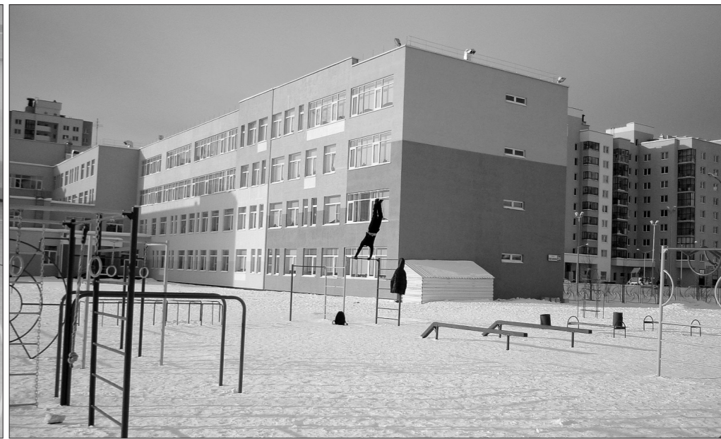
Спортивная площадка возле школы №16.