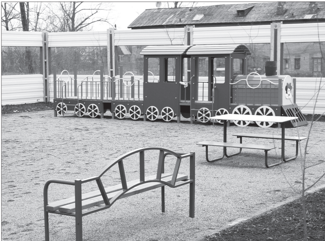
Благоустройство территории завершено с опережением графика.

Анастасия ВАСИЛЬЕВА.