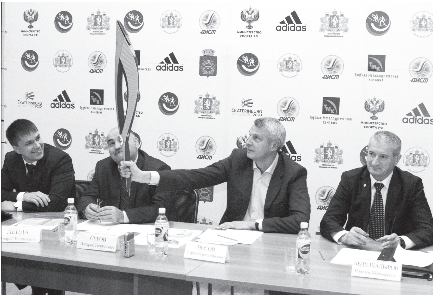
Сергей Носов с факелом Олимпиады.

Глава города Сергей Носов на совещании, посвященном подготовке к проведению эстафеты, подчеркнул, что Нижний Тагил в этот день должен выглядеть по-настоящему праздничным. Необходимо продумать, как будут украшены улицы, обеспечить работу различных торговых точек. Позаботиться о продаже горячих (но не горячительных!) напитков, поскольку, скорее всего, будет холодно. - Это честь, что эстафета пройдет в Нижнем Тагиле, - подчеркнул мэр. - Все-таки не так часто Россия проводит Олимпийские игры. У тагильчан должны остаться яркие воспоминания.