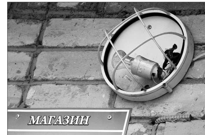
Есть места, где лампочка над магазинчиком – единственный огонек в ночи.

там небольшой скверик, – рассказывают местные. – Когда-то он освещался, но старые опоры давно демонтировали. На этом же пятке у школьников проходят уроки физкультуры.