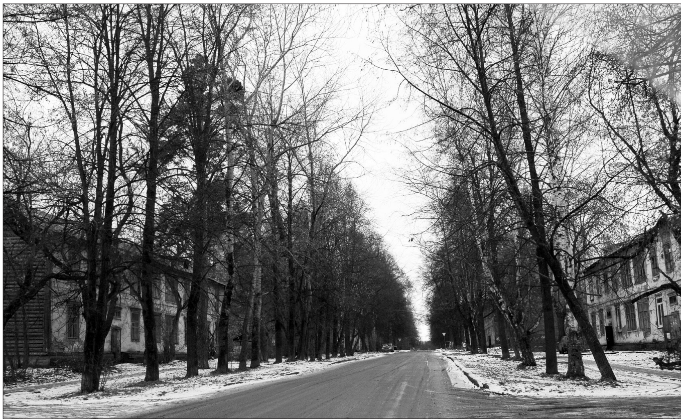
Дорога по улице Крымской – жилья вокруг осталось немного, но это популярный пешеходный путь, и освещение планируют восстановить.

В этом месте отступим от вопросов хозяйства муниципального и перейдем к вопросу из жилищно-коммунальной сферы. Темно во многих дворах независимо от наличия площадок – проблема эта общая. Где-то вырывают круглосветные фонари или прожекторы нежилых зданий – социальных и коммерческих. Плюс светильники над подъездами: продвинутые собственники устанавливают такие, что сами включаются – выключаются на закате-рассвете.