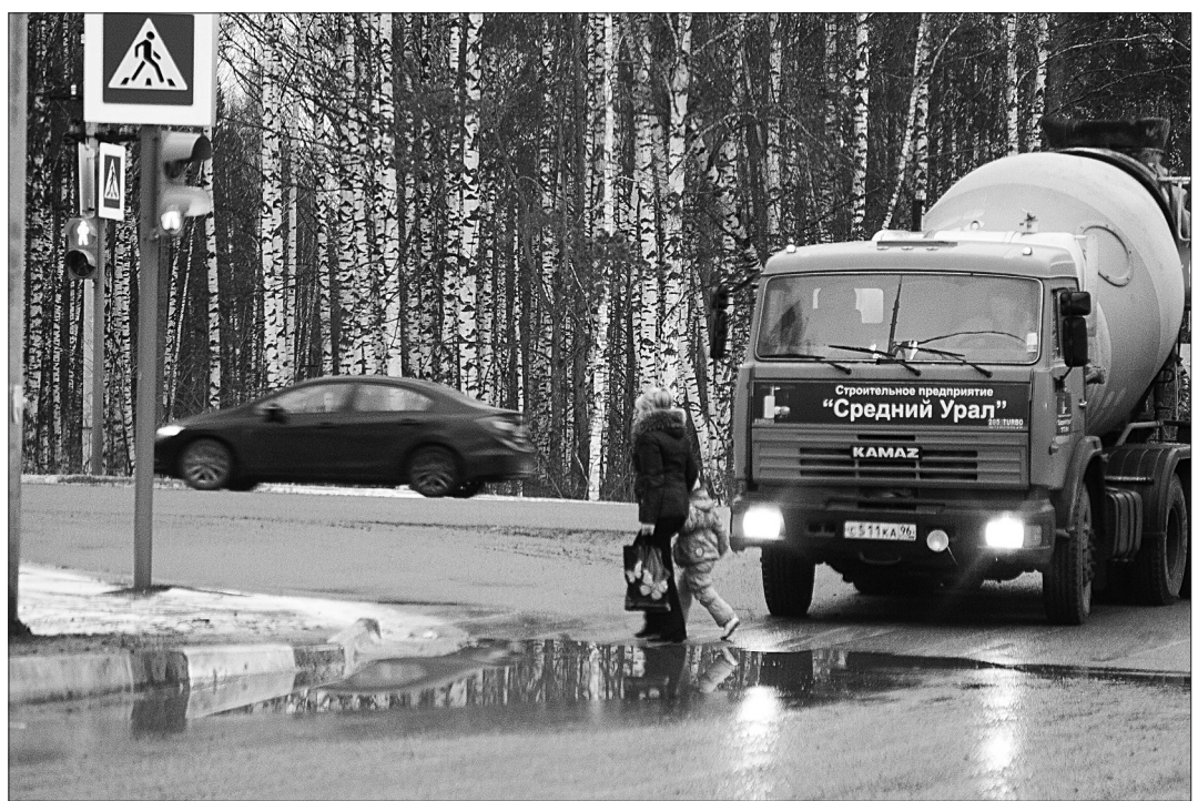
Жители Старателя огорчены состоянием единственного светофорного перехода. При ремонте дороги рельеф не выправили – перекресток в низине, отчего «зебра» вечно в лужах и грязи, и пешеходам приходится ее обходить.