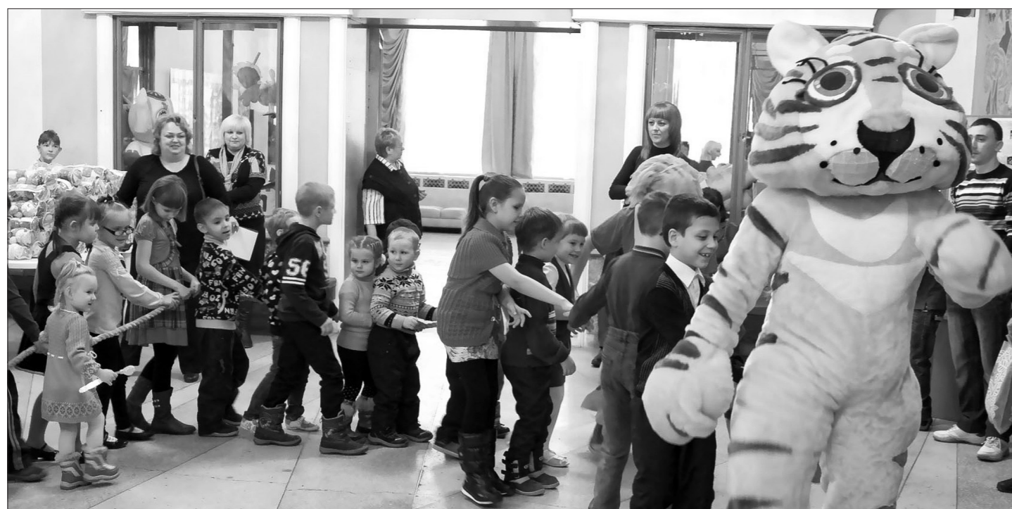
Хоровод с бархатным тигром.