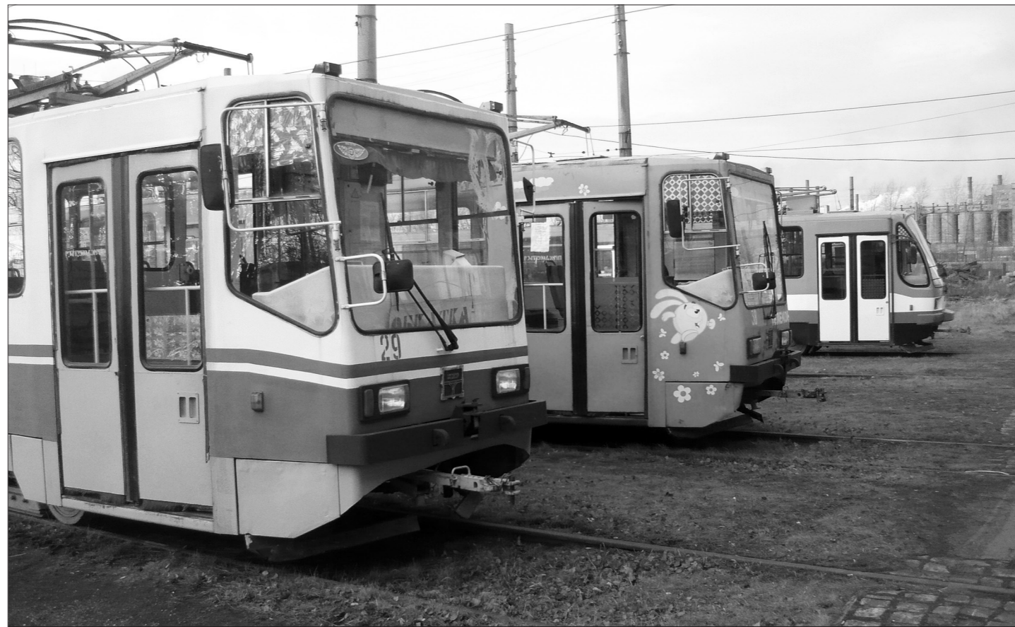
В трамвайном парке.

Проблем добавляют просто из-за ДТП, когда горожанам приходится возвращать деньги за проезд, а вот доверие к перевозчику вернуть сложно.