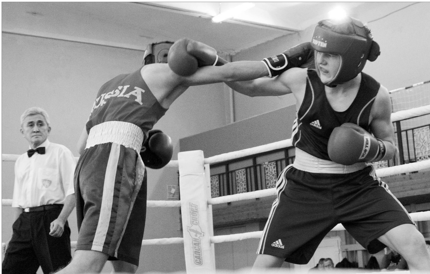
На ринге жарко.