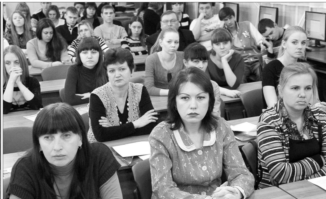
Участники научно-практической конференции.

На прошедшей неделе в читальном зале научной библиотеки НТСПА прошла научно-практическая конференция «Органы местного самоуправления Урала в исторической ретроспективе» и выставка архивных документов.