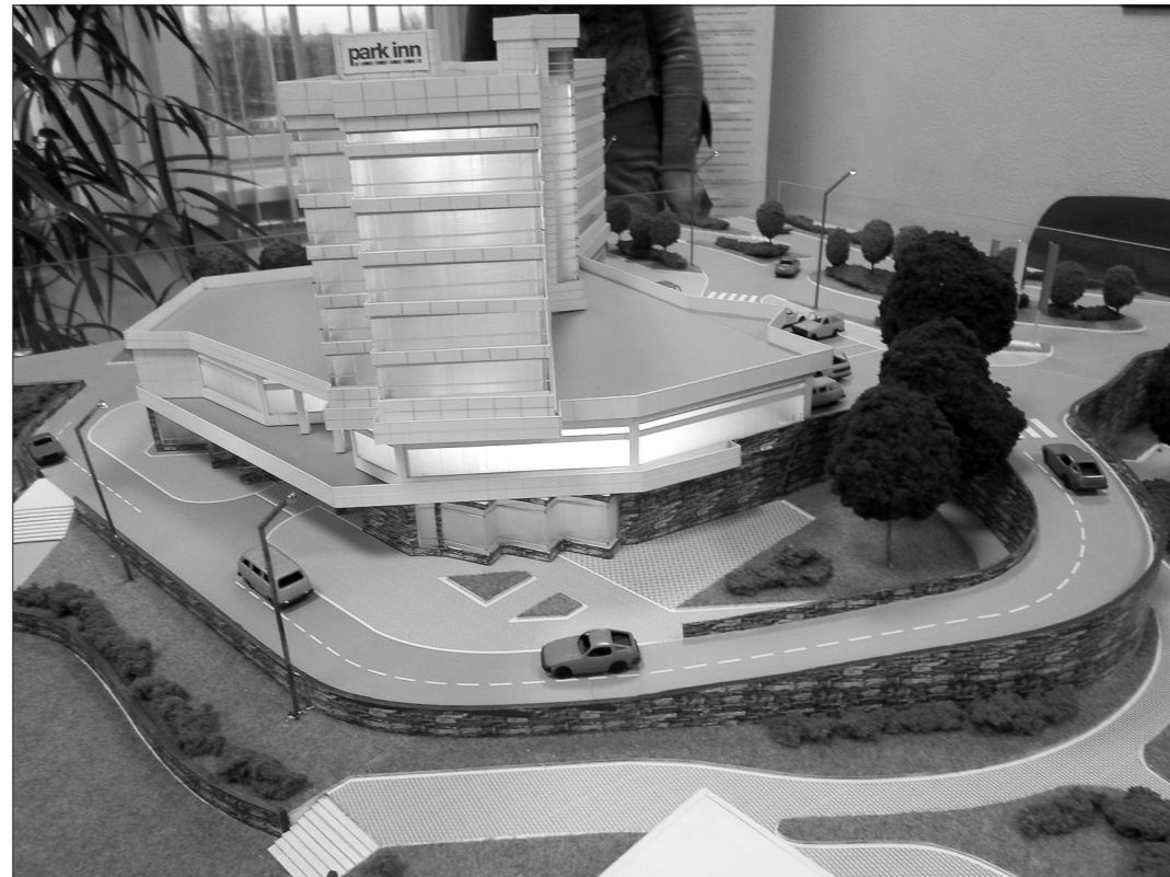
Обновленный макет отеля Park Inn.

участников градостроительного совета получил проект нового кафе недалеко от го-