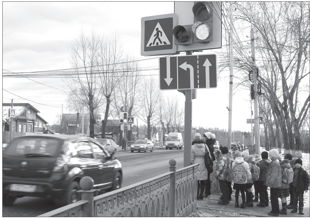
Переход через улицу Красногвардейскую.

Редакция не сомневается, что дорожники установили программу светофора с учетом огромного транспортного потока, который после ремонта трассы вырос почти вдвое. И все же пешеходам в районе Малой