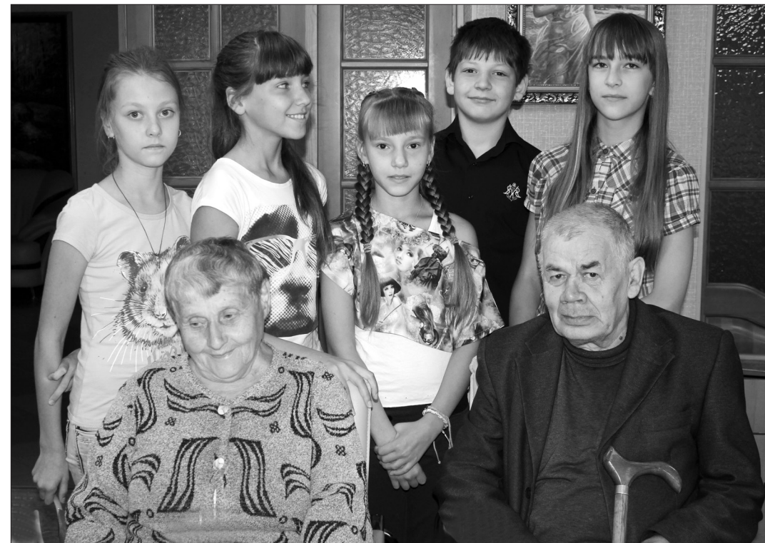
Волонтеры из гимназии №18 помогают постояльцам пансионата.

Н. дубских, заместитель директора.