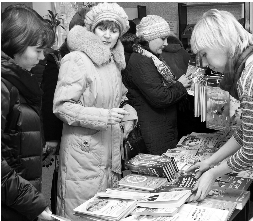
Исторические книги пользуются особым спросом у тагильчан.

Пять издательств представили книжные новинки тагильчанам. Выставка-ярмарка прошла в центральной городской библиотеке.