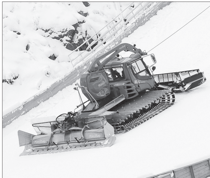
Ретрак утрамбовывает и разравнивает снег.