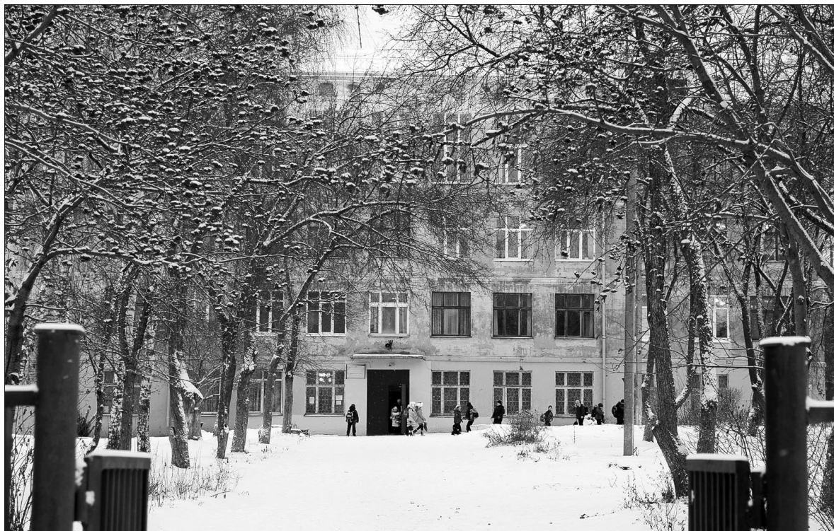
Здание школы №6.

Инфекционную вспышку в городской школе №6 вызвал золотистый стафилококк: это подтвердили лабораторные исследования, проведенные Роспотребнадзором при расследовании ситуации. Инфекция обнаружена у сотрудника пищеблока и в пробах готовой продукции, кроме того, выявлены нарушения санитарных норм. В результате пострадали малыши в возрасте 7-11 лет: всего 9 случаев пищевой токсикоинфекции (предварительный диагноз). Госпитализировано 8 человек. По неофициальным данным, заболело значительно большее число учеников. Третий за последние несколько недель случаи массового заболевания несовершеннолетних в тагильских образовательных заведениях окончательно подкосил доверие родителей к тому, что дети обеспечиваются высококачественным питанием. Потеряла вес и любимая отговорка ответственных лиц в подобных случаях «дома чем-то плохим накормили детей, а на школу (садик) жалуетесь». Ситуация с детским общепитом в нашем городе давно вызывает массу вопросов. И очевидно, что менять подход к делу надо не в отдельно взятых школах и садах, а в системе в целом. Причем менять серьезно и всесторонне.