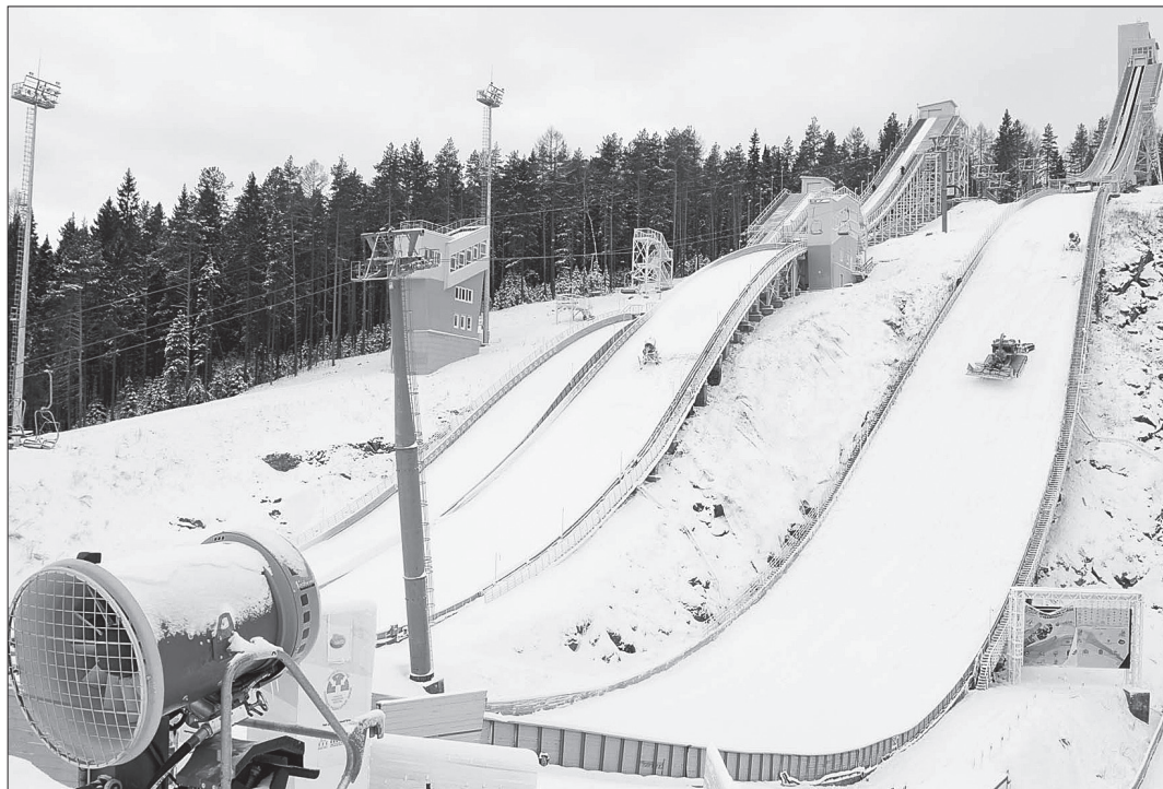
Трамплины оснеживали с помощью пушек.

Основные силы были брошены на трамплин К-90, именно он первым полностью облачится в белое одеяние и примет летающих лыжников. Пушки ра-