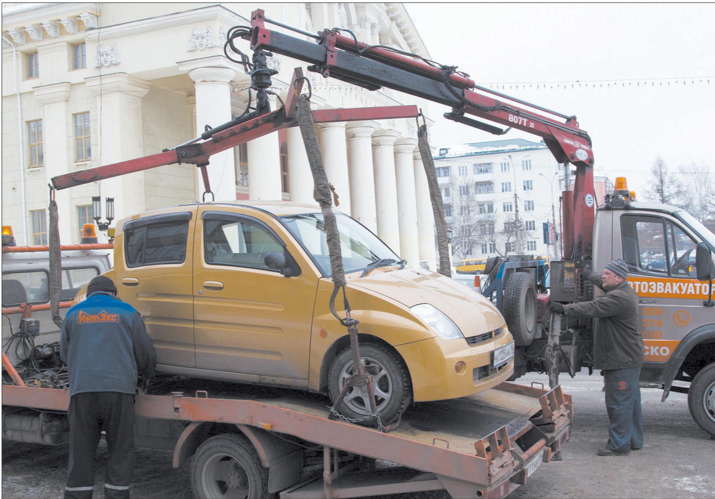
Эвакуация автомобиля у администрации города.