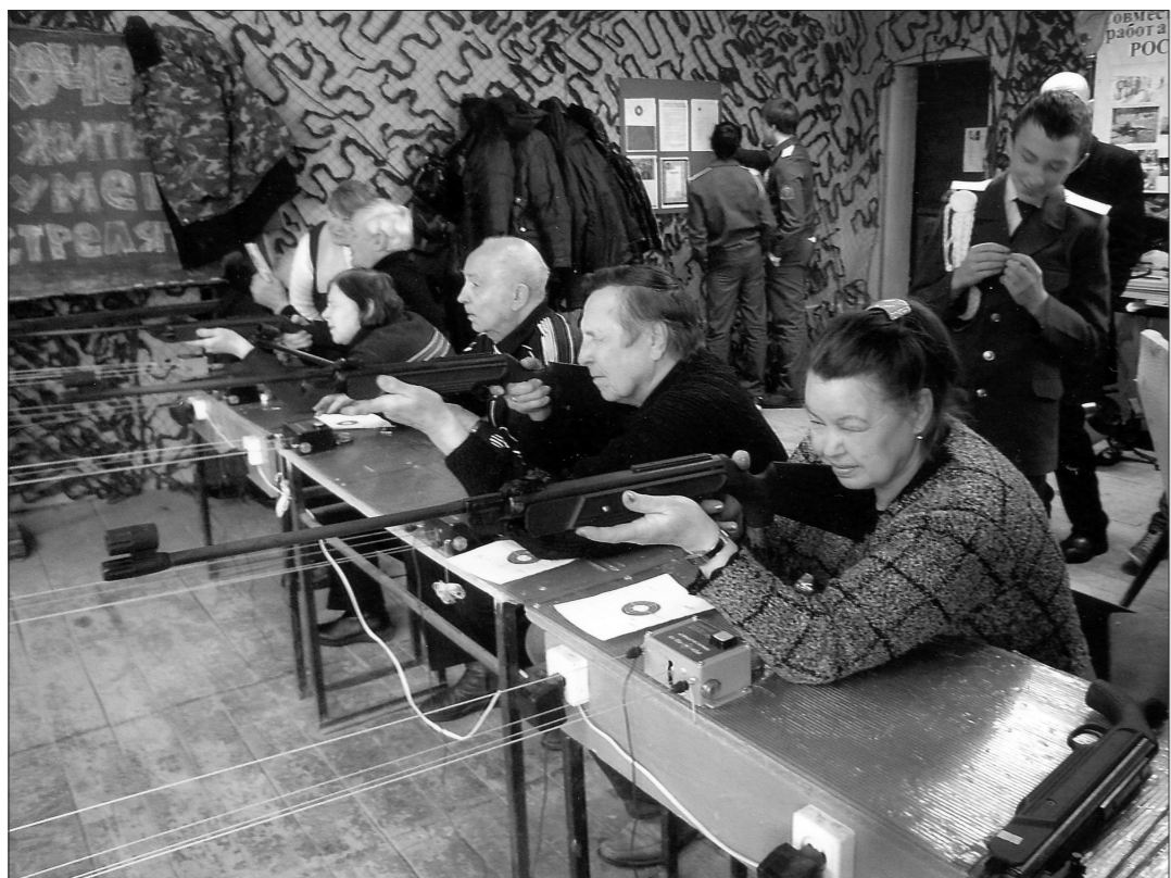
Команда ветеранов Ленинского района.

Между командами ветеранов Ленинского района и кадетов СОШ №21 состоялся соревнования по стрельбе, которые традиционно проводятся в честь Дня защитника Отечества.