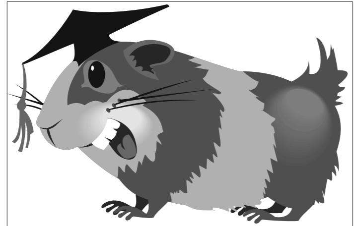
Иллюстрация Петра Упорова. В местах, в том числе в столовой и на занятиях. По мнению студентки, этот запрет нарушил федеральное жилищное законодательство, отмечает The Inquisitor.

Вельзен считает морскую свинку своим любимым животным: грызун помогает ей бороться с хронической депрессией. Она подала в суд на университет после того, как ей запретили появляться с животным в общественных