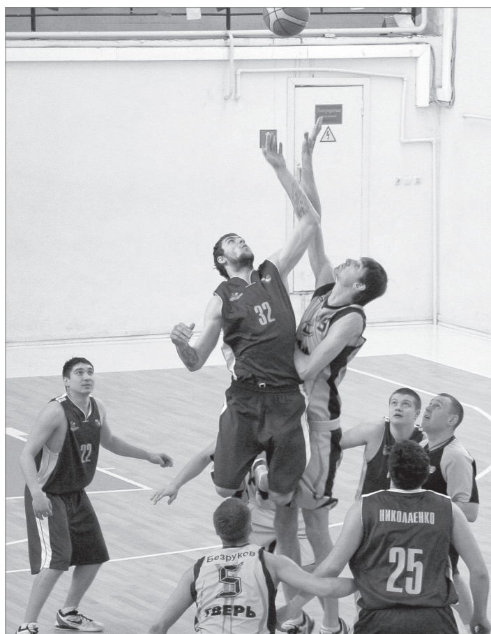
Матч между командами «КАМИТ-Университет» (Тверь) и «Старый соболь» (Нижний Тагил) начинается...

Во вторник и среду в Твери прошли заключительные матчи второго тура полуфинального этапа чемпионата России по баскетболу среди мужских команд Высшей лиги.