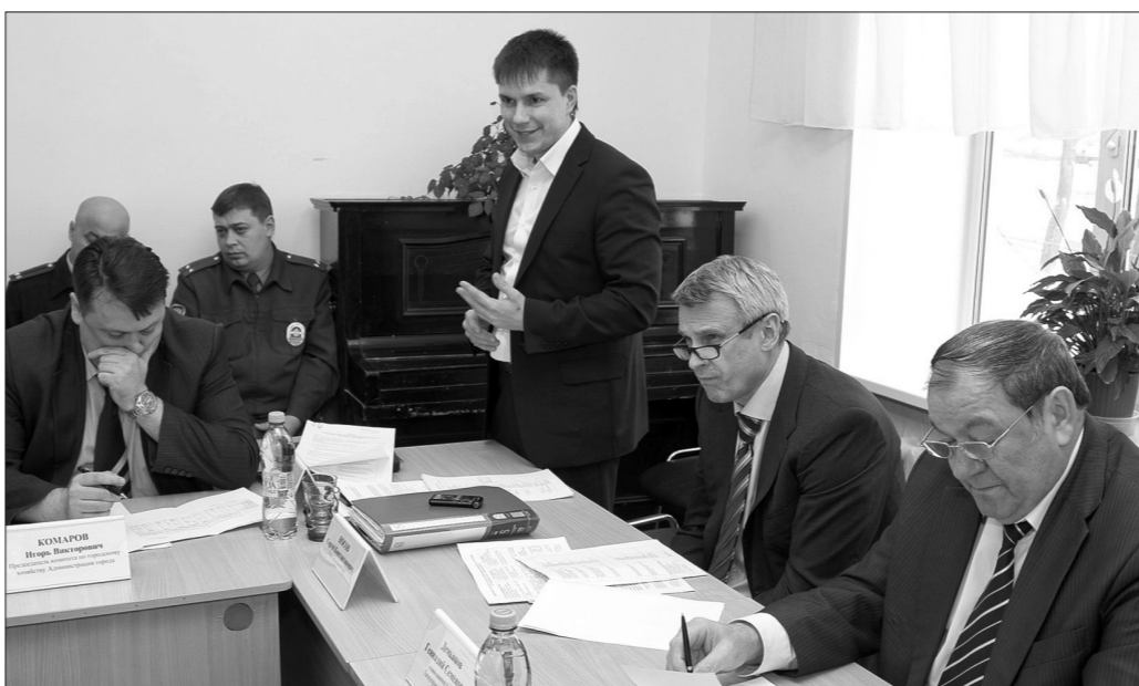
Встреча в школе №3 проходила при участии широкого круга руководителей и чиновников.