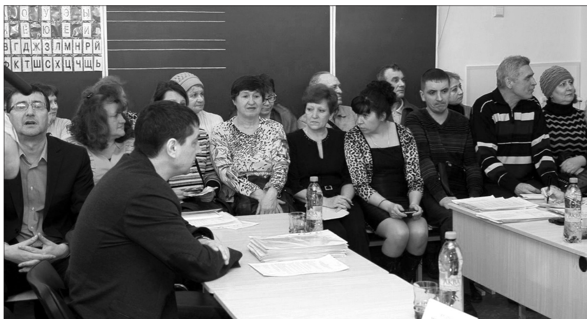
У школьной доски - члены советов ТОС.