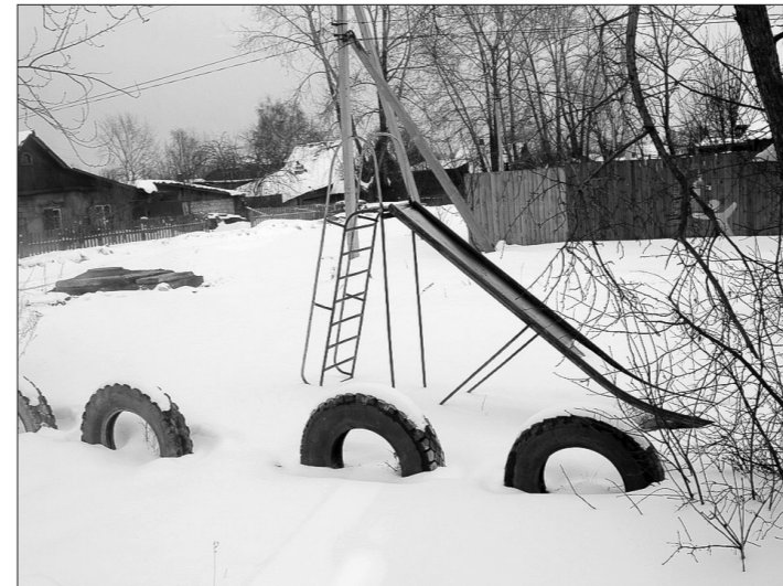
Во время объезда мэр обратил внимание на оборудование детских площадок: нередко энтузиасты «лепили» их из единственно доступных, но отнюдь не лучших материалов. Возникло желание помочь ТОСам обновить постройки.

Предел мечтаний большинства жителей частного сектора - коммунальные сети. Главная проблема здесь, как заметил глава города, заключается в отсутствии проектно-сметной документации - без нее никто не даст муниципалитету денег на строительство централизованной системы газо-, водоснабжения, канализации. Сегодня проект по газификации есть только для Смычки. В целом по территории Тагилстроя, будь то водопровод, канализация или газ, речь велась о планах на 2013-2015 годы. Они осуществимы при условии своевременной подготовки проектов и гарантий, что потребители подключатся к магистральным трубопроводам и инвестиции себя оправдают. Судя по выступлениям, хозяева готовы найти деньги на газификацию. Ведь, по словам многодетной мамы, живущей по улице Балакинской, потребность в комфорте острая: только за зиму пришлось потратить на дрова 20 тысяч рублей.