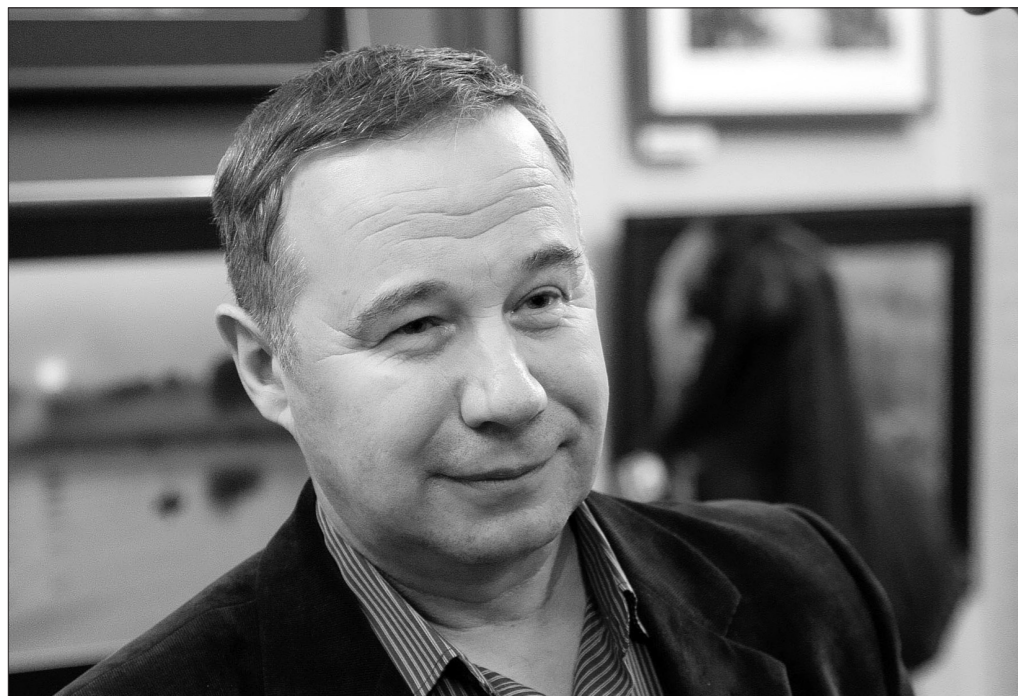
Фотограф Тимофей Дубинин.

Тучи над городом, Чусовую и Волгу, березовый лес и цветение иван-чая можно нынче увидеть в выставочных залах музея-заповедника: в середине декабря здесь открылась выставка фоторабот Тимофея Дубинина «Откровения мгновений».