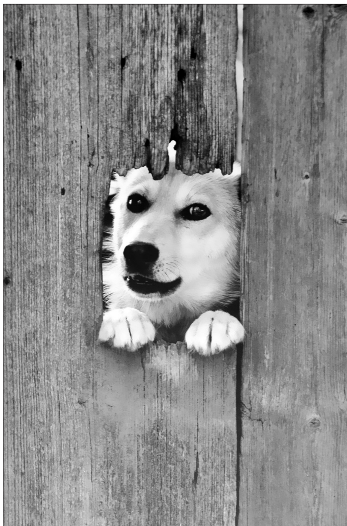
«Надежный сторож», 2009 г., Тимофей Дубинин.

Людмила ПОГОДИНА.