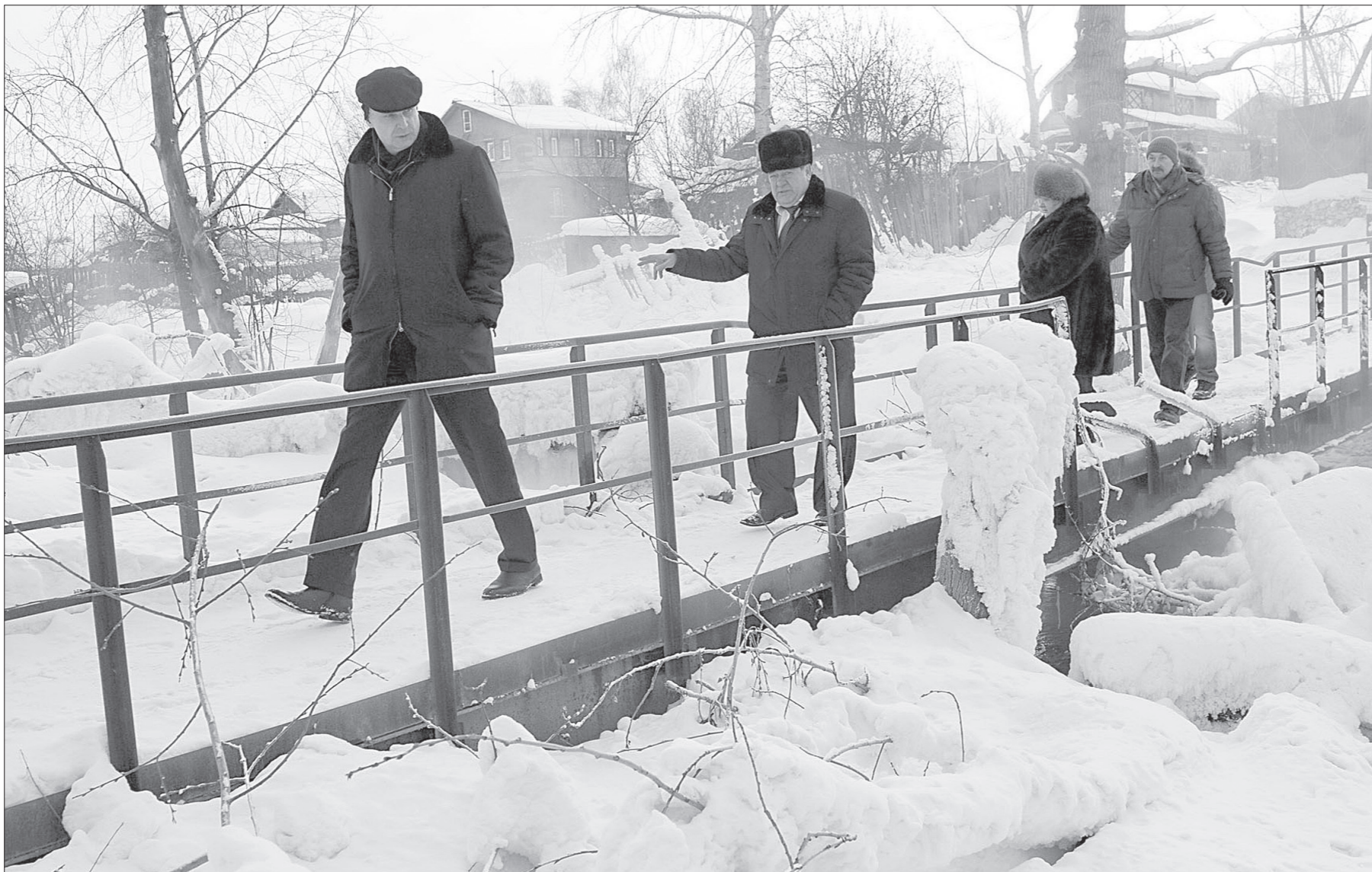
Побывали участники объезда на пешеходном мосту по улице Менделеева, который жителям хотелось бы перенести чуть в сторону, к дороге. Да и территория вокруг требует внимания: бурелом, покосившиеся столбы... Зато откуда-то из-под сугробов раздавалась громкое приветственное кваканье – даже зимой у незамерзающей речки бурилась лягушачья жизнь!

Во время непродолжительного заседания совета (оно проходило в гостеприимно открытом кабинете директора ГДДЮТ) успели обсудить множество вопросов благоустройства поселка –