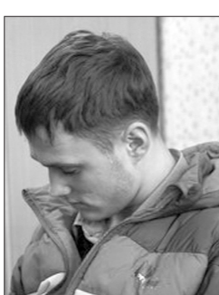
Подозреваемый в преступлении.

торого потерпевший уверенно опознал. Доставленный в отдел полиции 18-летний парень признался в совершенном преступлении. По словам начальника уголовного розыжка отдела полиции №16 майора Дмитрия Рублева, подозреваемый не отрицает, что таким образом пытался завладеть деньгами таксиста. Задержанный молодой человек уже привлекался к уголовной ответственности за совершение кражи, будучи подростком. В настоящее время по факту разбойного нападения следственным отделом №1 возбуждено уголовное дело по ч. 1 ст. 162 УК РФ, подозреваемый молодой человек задержан в порядке статьи 91 УПК РФ.