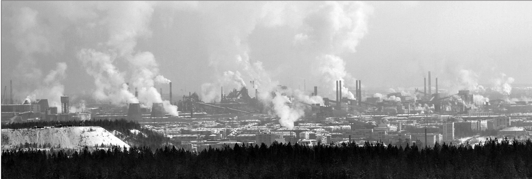
Вид на Тагил с горы Долгой. Снимок сделан 28 марта 2013 года.

15 марта, - сообщила она, - за подписью главы города направлено обращение министру природных ресурсов и экологии Российской Федерации Сергею Серафимовичу Донскому. Мы проинформировали его об экологической ситуации в Нижнем Тагиле: о качестве атмосферного воздуха, о системе мониторинга, которая существует здесь много лет и создавалась не нами. Попросили содействия в том, чтобы перевести ее работу в режим «онлайн» по единому перечню загрязняющих веществ на всех постах государственной сети наблюдений. Особо подчеркнули то, что результаты мониторинга должны стать доступными для руководителей города. Сегодня с единственного в городе поста автоматической системы «СКАТ» информация сначала передается в Екатеринбург, а затем выкладывается на официальном сайте министерства природных ресурсов Свердловской области (ежедневная сводка о состоянии атмосферного воздуха). Но сведения, которые формируются по результатам анализов на четырех наблюдательных постах государственной сети, конечно, нельзя считать опера-