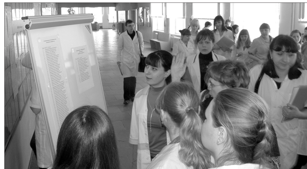
Студенты знакомятся с рейтингом.

Присутствовали представители 13 лечебных учреждений из Нижнего Тагила, Нижней Туры и Кушвы – руководители, заместители главных врачей, главные и старшие сестры. Результатом работы комиссии стало распределение 73 студентов четвертого-пятого курсов специальностей «Сестринское дело» и «Лабораторная диагностика» по базам практики с последующим трудоустройством. Члены комиссии провели собеседование, изучили портфолио, а также рейтинги студентов, высчитывающиеся на основе среднего балла за годы учебы, участия в семинарах, количества пропущенных занятий.