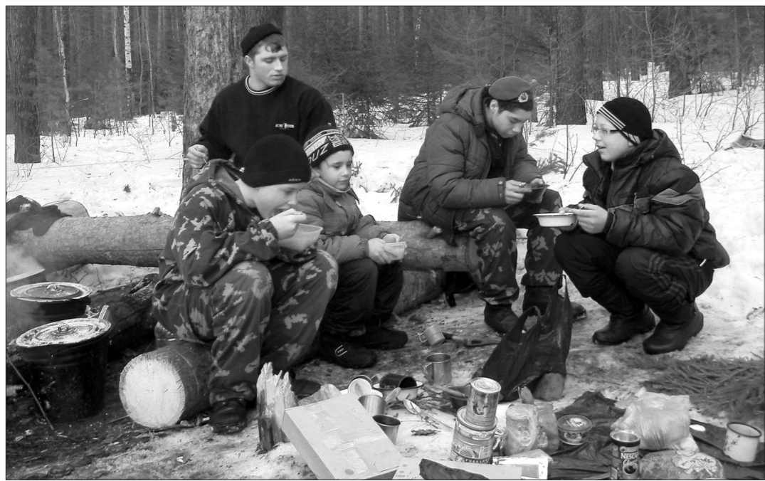
Обед в полевых условиях.