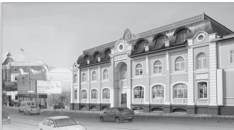
Проект кафе у цирка направлен на доработку, а проект здания на проспекте Ленина, 5, отклонен.

Прошло заседание градостроительного совета, на котором рассматривались вопросы обустройства поймы реки Тагил и возведения зданий в центральной части муниципального образования.