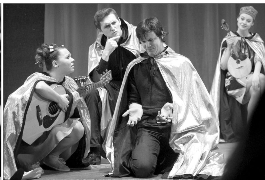
Обладатель «Золотой кочерыжки» - ТЮЗ из Екатеринбурга.