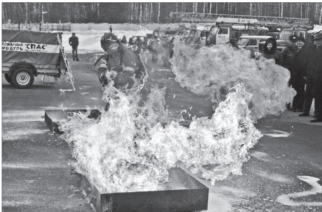
Тушение огня с помощью переносного комплекса ГИРС.

Со 2 по 3 апреля на территории демонстрационно-выставочного центра НТИИМ состоялся региональный учебно-методический сбор ГУ МЧС России по Свердловской области.