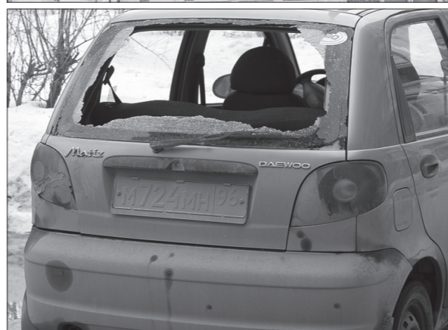
Следы ЧП – на третьем балконе сверху и автомобиле.

В диспетчерскую тревожный сигнал поступил около четырех утра, на место ЧП незамедлительно отправилась следственно-оперативная группа отдела полиции №20.