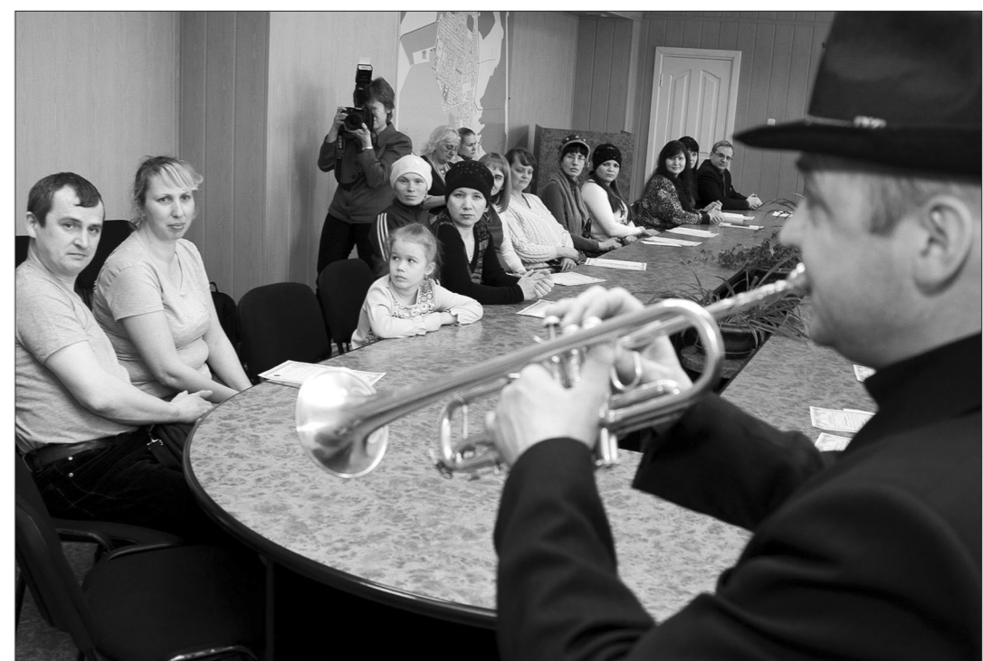
К сертификату «прилагалась» музыкальная составляющая.