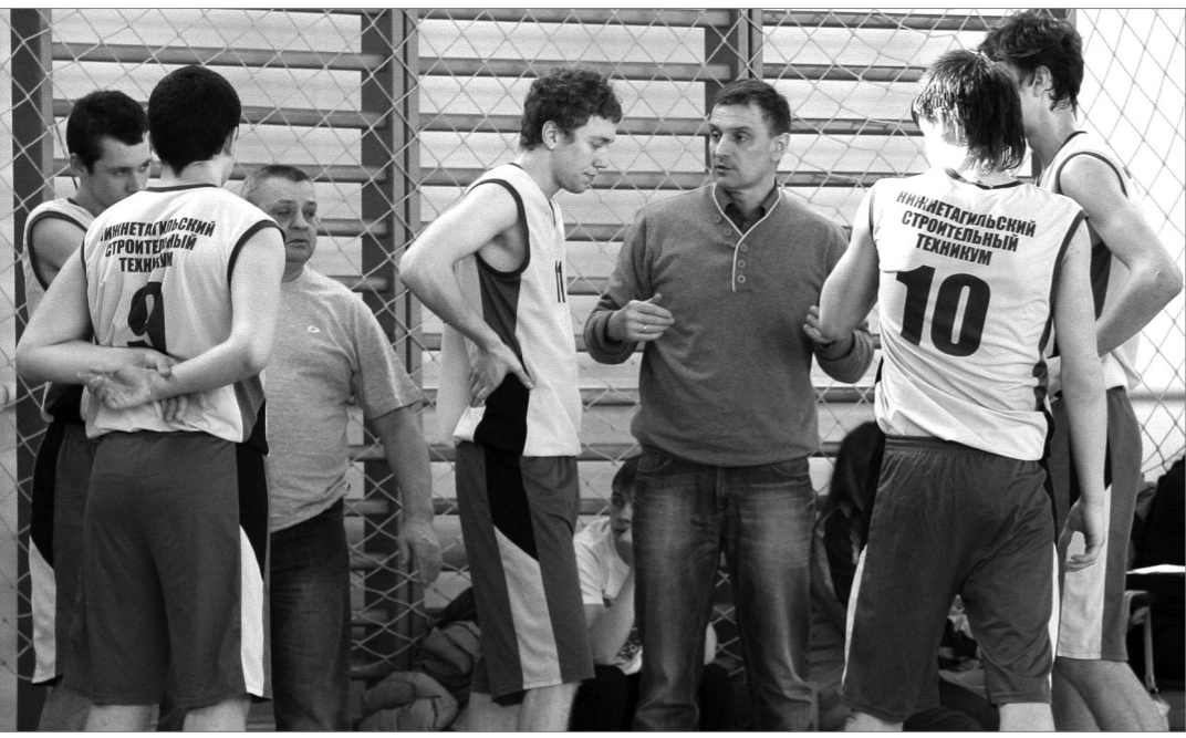
Шестую победу одержали баскетболисты Нижнетагильского строительного техникума, где знают, чем увлечь молодежь.

После полумки счита в игровом зале спорткомплекса «Алмаз» чемпионат и первенство города среди мужских команд застопорились, но теперь, вроде бы, все в порядке, и соревнования вовсю идут, приближаясь к стадии плей-офф.