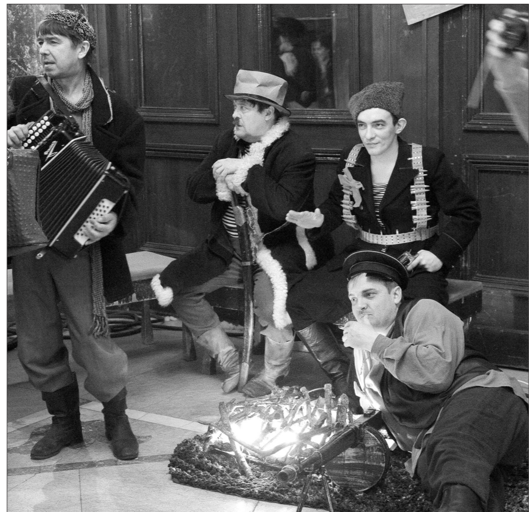
Возле гардероба в ожидании зрителей грелись у костра сочувствующие театральной революции граждане.

А победителями конкурса стали актеры Екатеринбургского ТЮЗа, назвавшие свое выступление «Артистов маленький оркестрик». От лица бюджетного, автономного, авторского, авторского и любительского театров они рассказали о проблемах каждого, о том, что в погоне за деньгами или за баллами для аттестации можно забыть любовь к театру. Вне конкурса, но по теме выступила и актерская компания «Тринтет» из Озер-