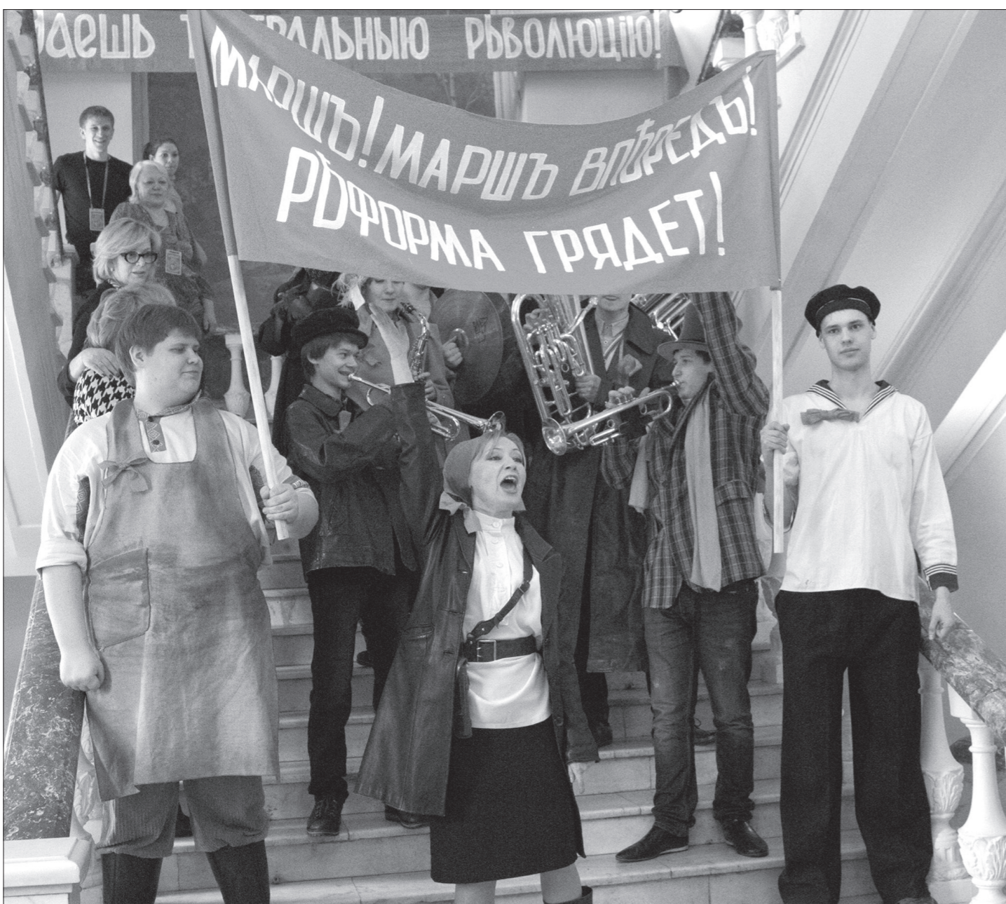
Революционно настроенные массы устроили в фойе театра митинг.