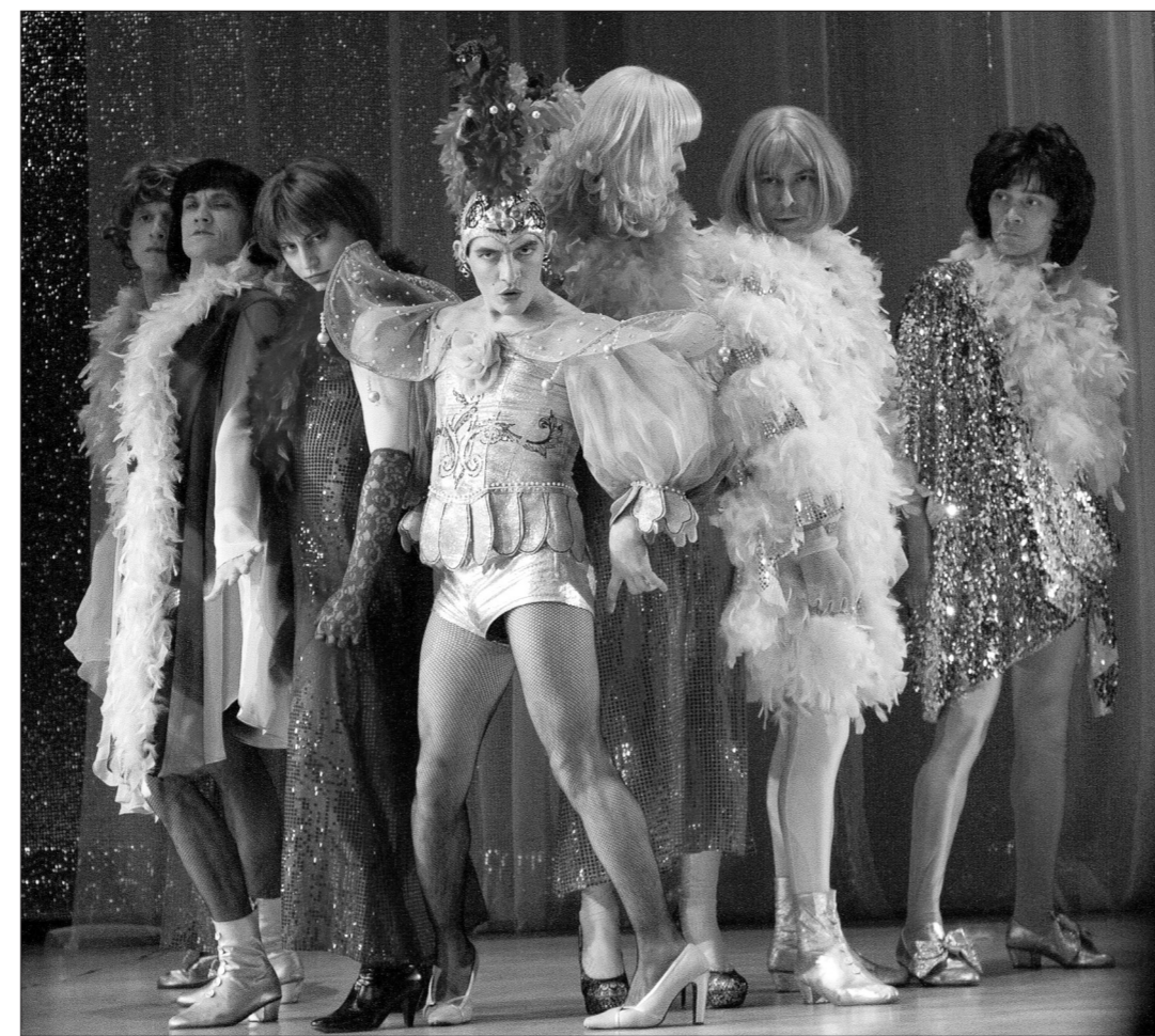
Обладатели серебряной кочерыжки, артисты Нижнетагильского драмтеатра, сначала ошарашившие публику своим видом.

ского театра драмы и комедии. Признанные короли капутников, призеры Международного фестиваля авторской песни имени Андрея Миронова и премии «Золотой Остап» порадовали публику своим представлением о театральной реформе, о том, почему сейчас «театро превращено в варьете и кабаре», и честно назвали то нелитературное место, в котором, к сожалению, находится российский театр.