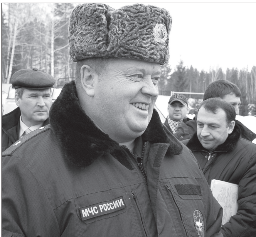
Начальник главного управления МЧС России по Свердловской области Андрей Заленский.