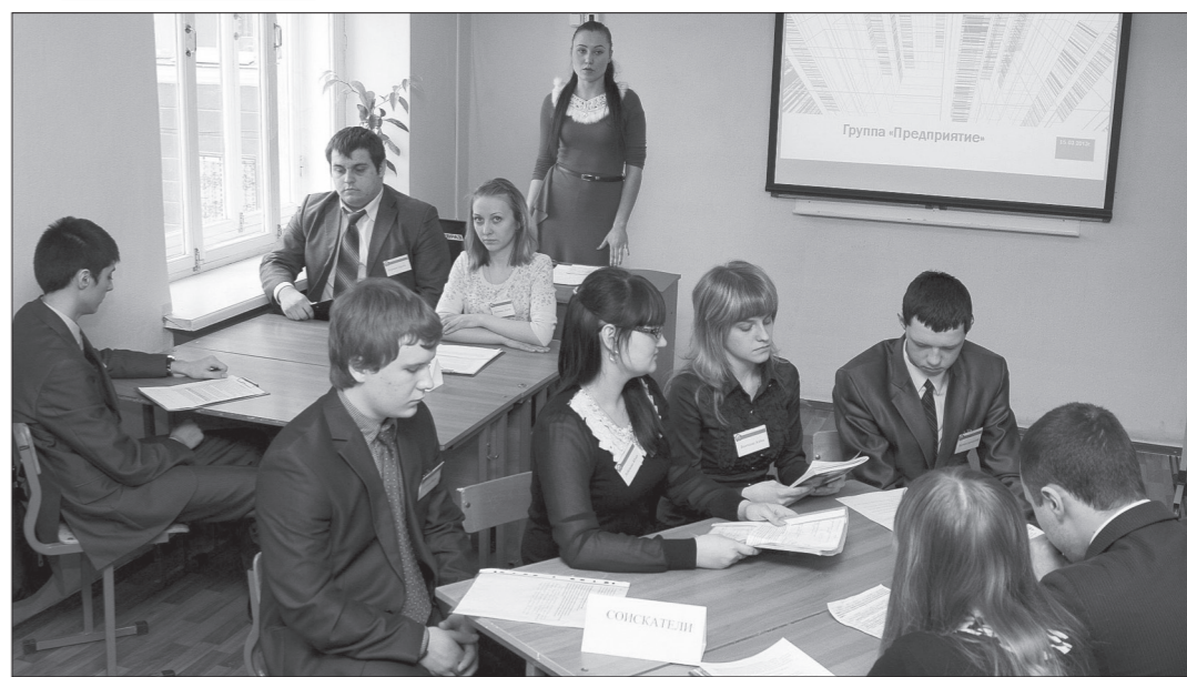
Ребята рассказывали об особенностях устройства на работу на металлургический комбинат, специфике производства, специальностях и путях совершенствования знаний.