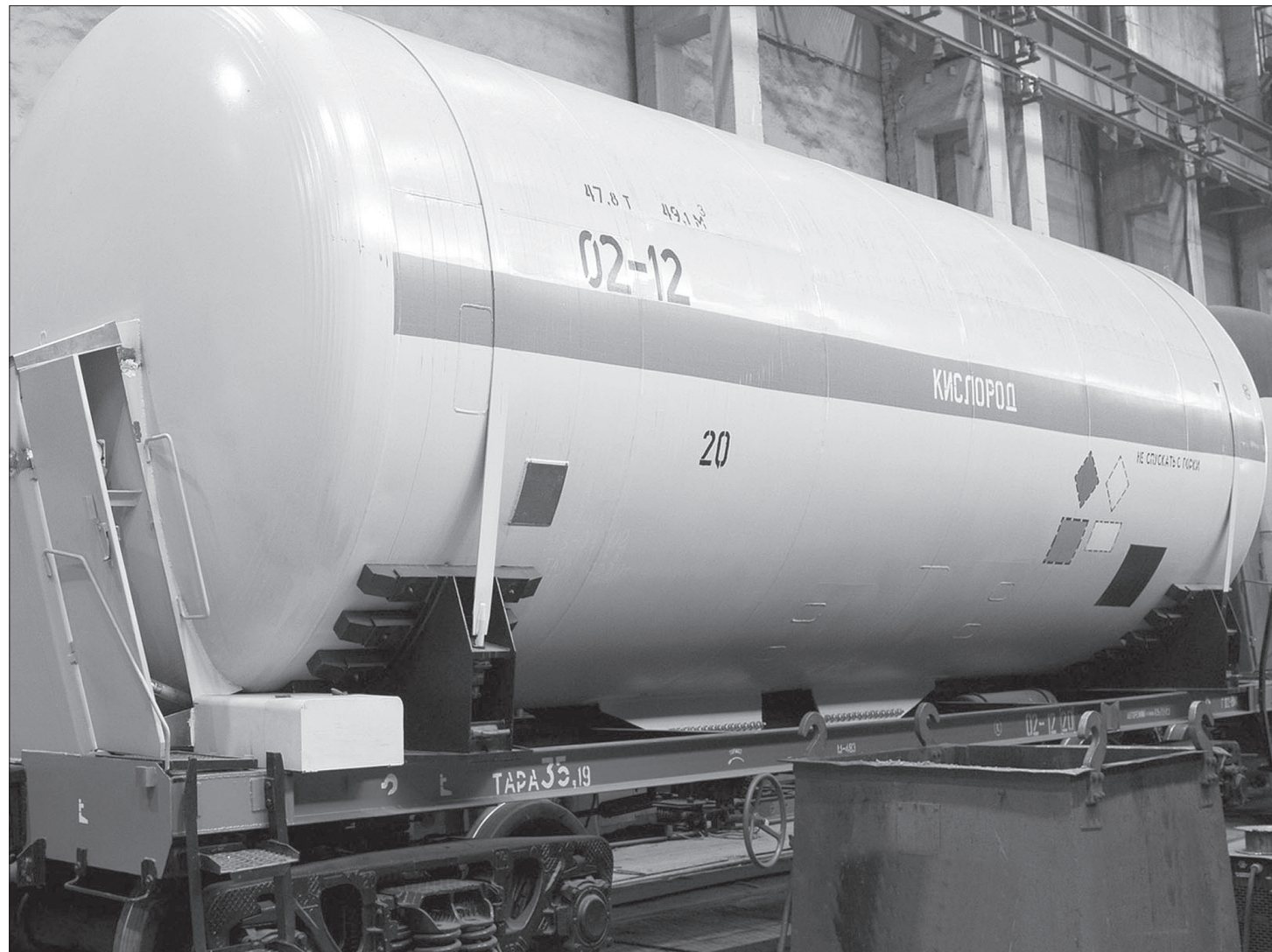
Прототип цистерны 15-558 С-03 для транспортировки топлива на «Восточный» уже готов.