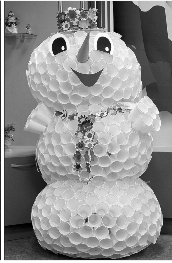
«Снеговик» ребыт из детского сада №185.