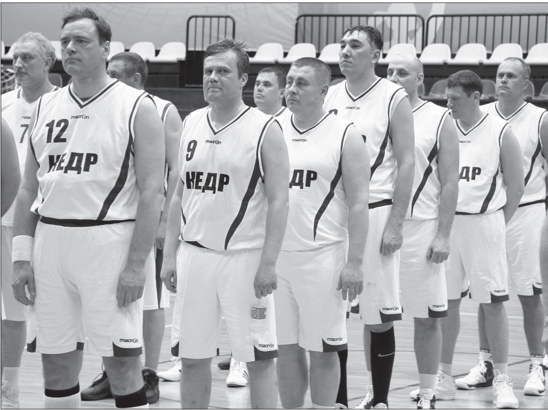
Баскетболисты «Кедра», победители турнира.