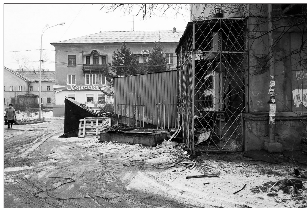
Очень неприглядная картина за «Монеткой» по улице Пархоменко, 131.

Краснодарская торговая сеть «Магнит» - самая распространенная и популярная в Нижнем Тагиле. Как рассказал директор Нижне-