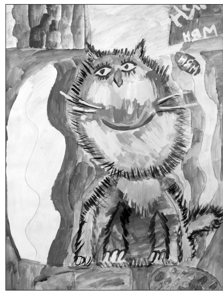
«Грезы кота Васьки», автор Максим Уткин.