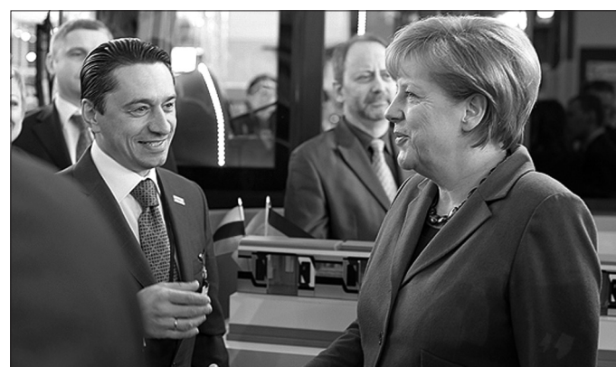
Олег Сиенко и Ангела Меркель.

Научно-производственная корпорация Уралвагонзавод