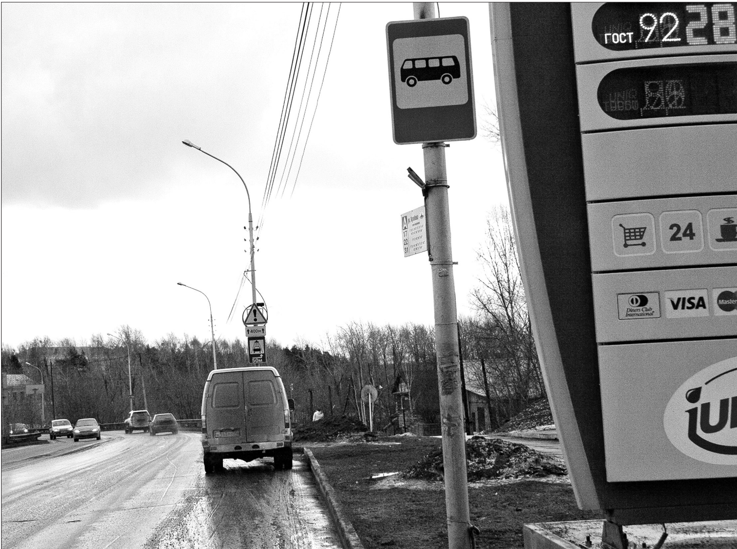
Столкновение водителей и пешеходов сбивает тот факт, что на упраздненной остановке висит такой же новенький знак, как и на официально утвержденных.

Не в силах мы изменить отношения в социуме так, чтобы одни дети, сироты, росли не столь агрессивными и порочными, а другие, домашние, - более закаленными... Безопасность на улицах тоже обеспечить не получается. Вот и идет все к тому, что проще оборудовать лишнюю остановку. И не только возле ГДДЮТ.