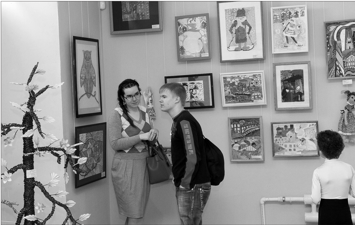
Первые посетители выставки «Шедевры-2012».

Людмила ПОГОДИНА.