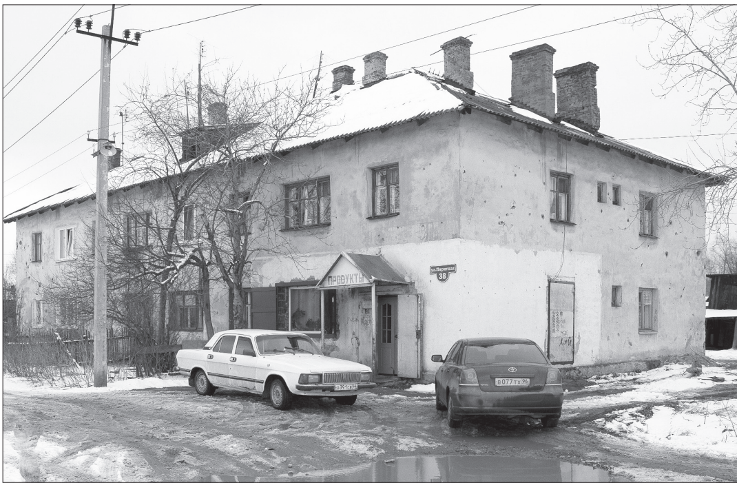
Дом №38 по улице Пиритной.

18 апреля, в 17.00, в большом зале ОПЦ по адресу: пр. Ленина, д. 31, состоится общественная презентация проектов «Тагильский трамвай», «Светлый город», «Лифт», «Микрорайон «Александровский» и других с участием главы города.