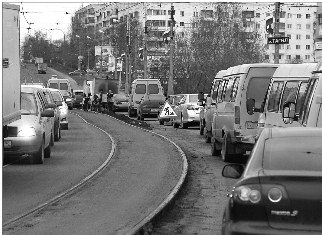
На мосту пробка в обе стороны.