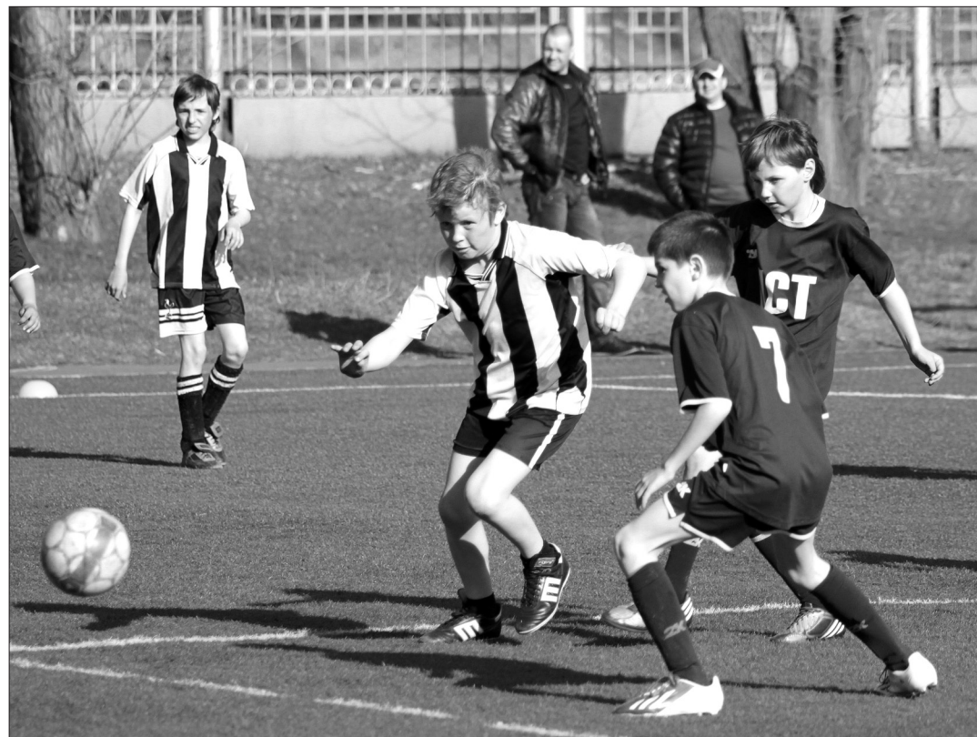
Играют команды школ №64 (в темной форме) и №10.

В честь предстоящего 55-летия школы №64 на искусственном поле стадиона «Юность» прошел турнир по футболу среди учеников 3-4-х классов.