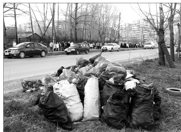
Мусор на обочине.

К примеру, по дороге на кладбище Дзержинского района можно было встретить людей, нетвердо стоящих на ногах, начиная с полудня, а вечером почти со всех сторон слышались звон бутылок и тосты за близких. Приходя целыми семьями, тагильчане мыли памятники, собирали в мешки сухие ветки деревьев и прочий мусор, красили оградки, садили в землю цветочки, а потом одни собирались и уходили домой, другие же – раскладывая на столиках пакеты с бутербродами и вареными яйцами, ставили бутылку водки или банки с пивом и начинали «разговор за жизнь».