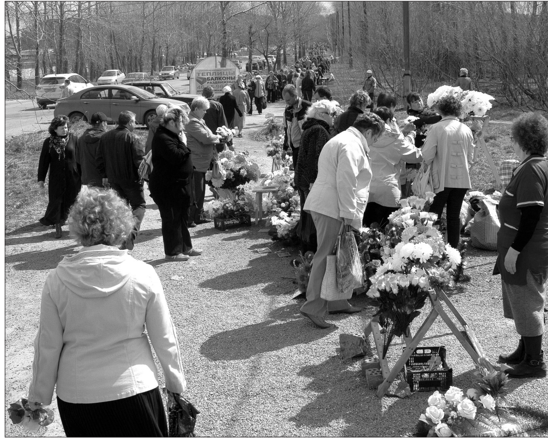
На вагонское кладбище тагильчане шли весь день.

паний, можно было услышать и рассказы о том, какой замечательный человек раньше времени ушел из жизни, и жалобы на детей, которые не нашли времени, чтобы навестить могилы своих близких, и рассуждения о политике, о бешеных ценах, о болезнях. А один малыш звонким голосом требовал у родственников, чтобы ему объяснили, к кому они пришли.