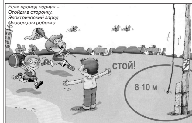
Если провод порван – Отойти в сторону. Электрический заряд опасен для ребенка.

Очень часто после грозы, сопровождающейся сильным шквалистым ветром, или после снежного урагана на линиях электропередачи происходят повреждения: обрыв проводов. Если вы вдруг увидели такой провод, висящий в воздухе или лежащий на земле, ни в коем случае к нему не приближайтесь: а вдруг этот провод находится под напряжением? Помните: электротравму можно получить и в нескольких метрах от провода за счет «шагового напряжения». Земля, являясь проводником электрического тока, становится как бы продолжением оборванного провода. Растекаясь по почве, электрический ток может представлять смертельную угрозу для человека, приближившегося к проводу ближе, чем в радиусе на 8-10 метров. Достаточно сделать один шаг внутрь этого невидимого круга, чтобы из-за разницы электрических потенциалов под правой и левой ногами получить электротравму. Причем чем шире шаг (а значит больше разница потенциалов), тем тяжелее поражение. Встретив на своем пути оборванный провод, заведомо считайте его находящимся под напряжением!