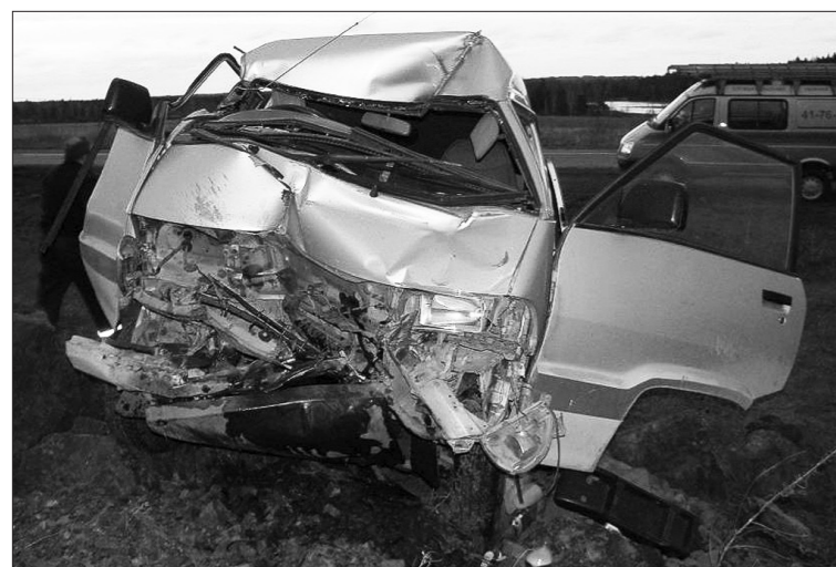
Автомобиль «Тойота» восстановлению не подлежит.

Гибелью человека закончилась авария, которая произошла в начале четвертого часа утра 18 мая.