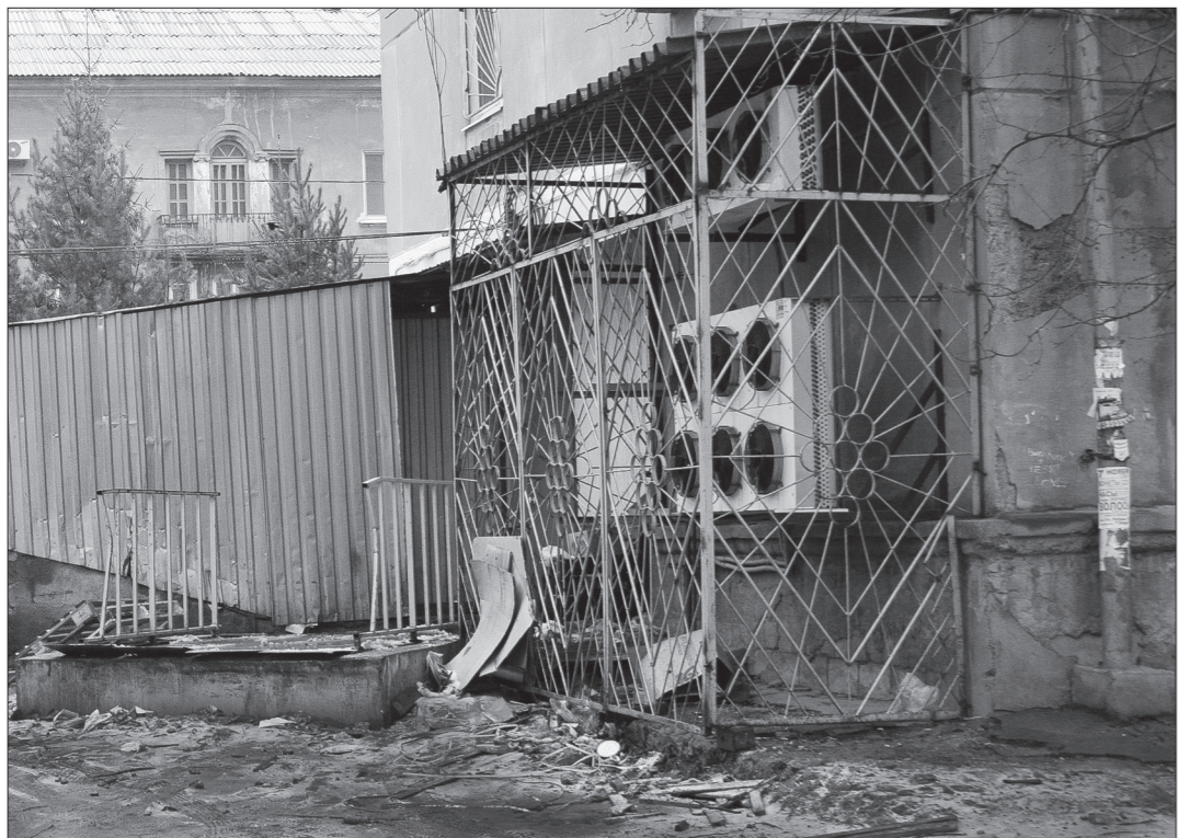
Ухода в подсобку.

Этот вопрос читатели «ТР» часто задают в письмах и по телефону, имея в виду магазин, занимающий весь первый этаж многоквартирного дома №131 на улице Пархоменко. Как они утверждают, место, куда здание выходит парадной стороной, отличается стабильной замусоренностью.