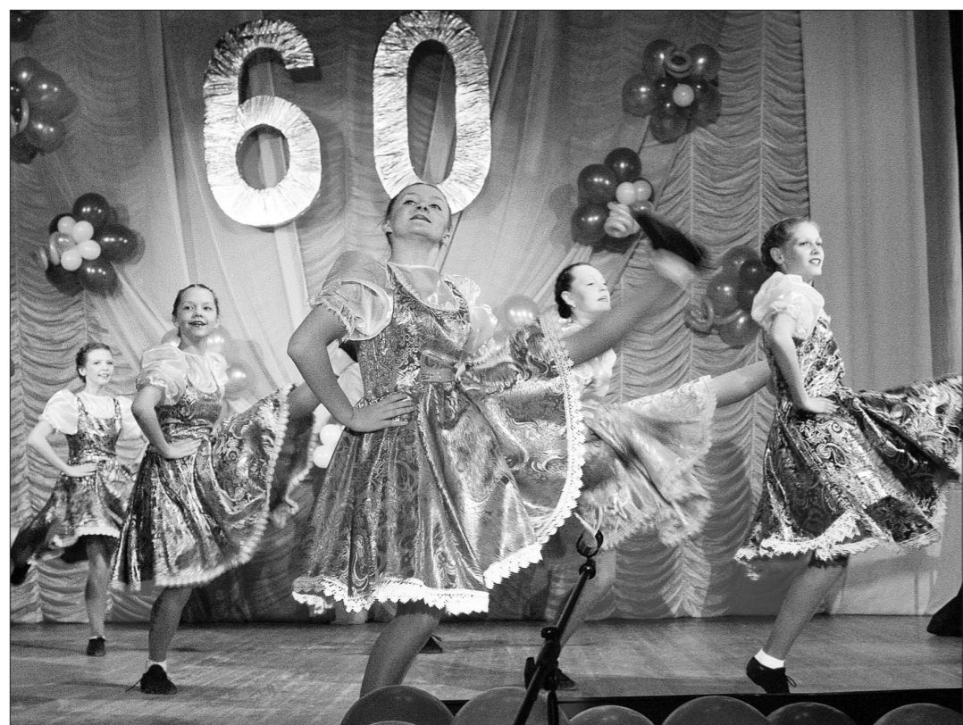
Коллектив «Дункан» Дома детского творчества.