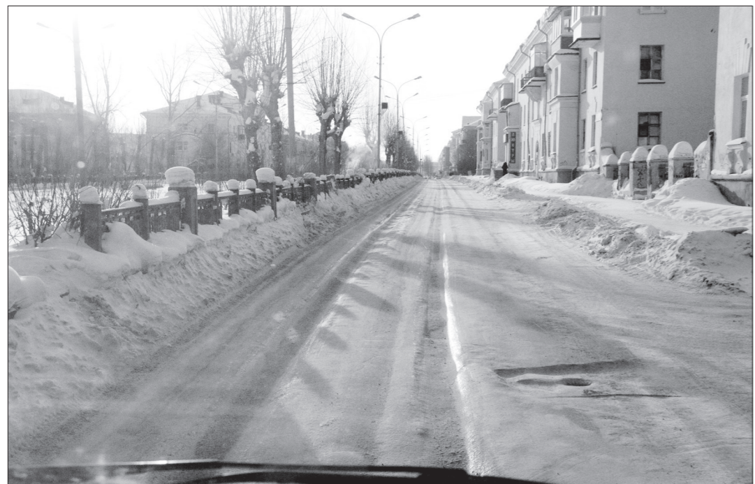
Глубокая колея на проспекте Дзержинского.

Нынешняя зима отличается снегопадами, однако и в снег, и в метель не следует забывать о благоустройстве города, и редакция «ТР» не раз поднимала на страницах газеты эту тему. Заметно, что нынешней зимой уборка