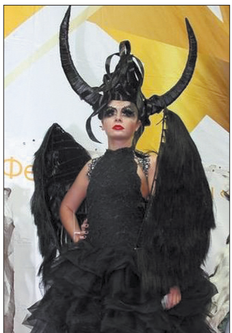
Постижерная работа на тему «Готика».