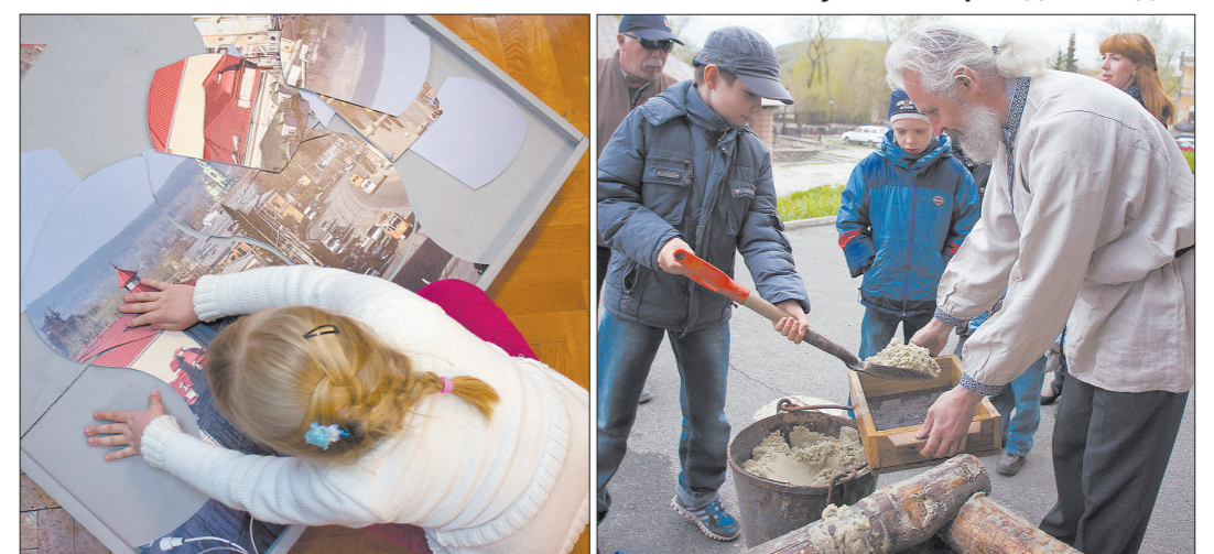
Малышам понравилось собирать из пазлов фотографии улиц родного города.