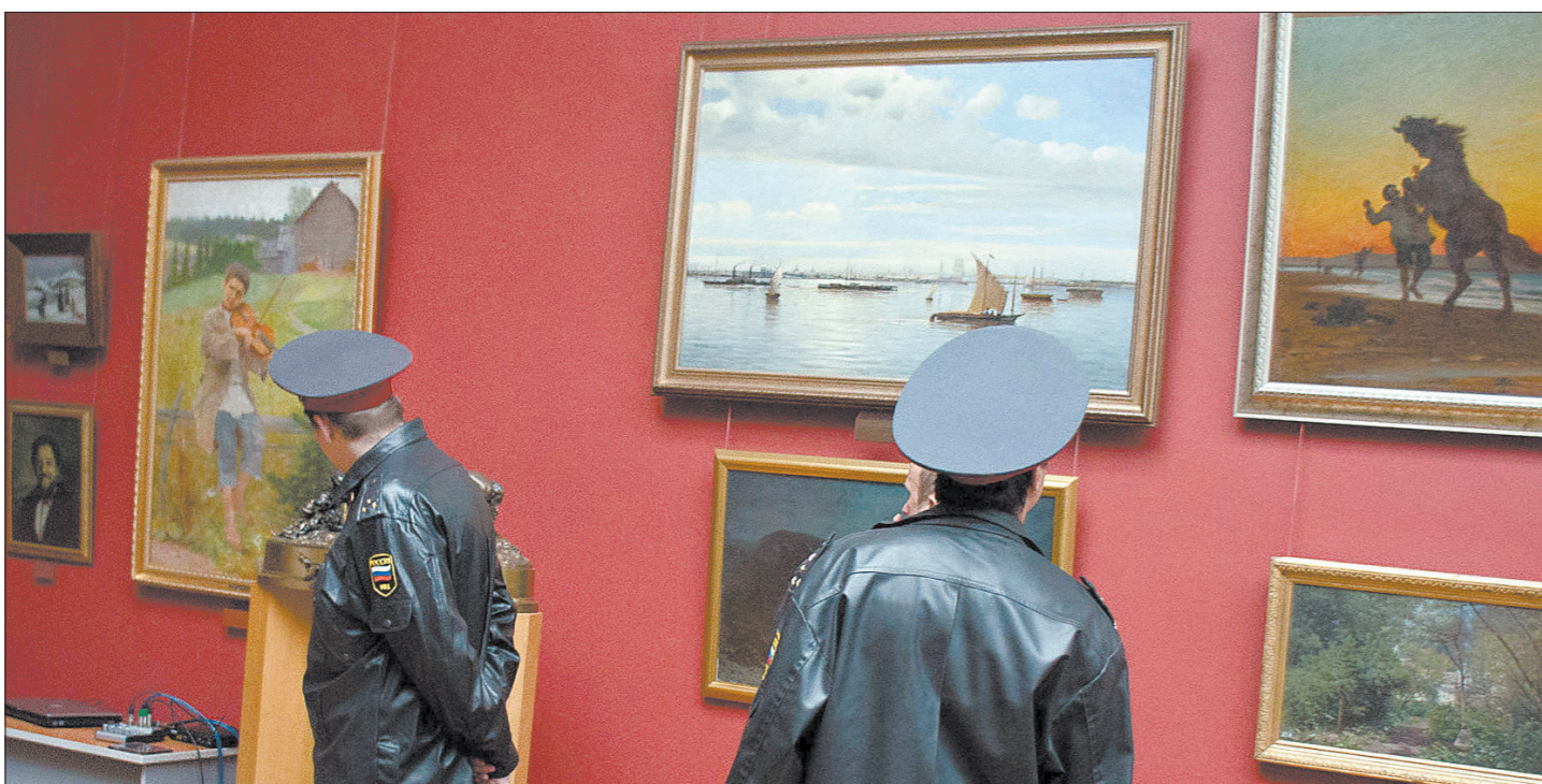
Ночное знакомство с коллекцией Русского зала.