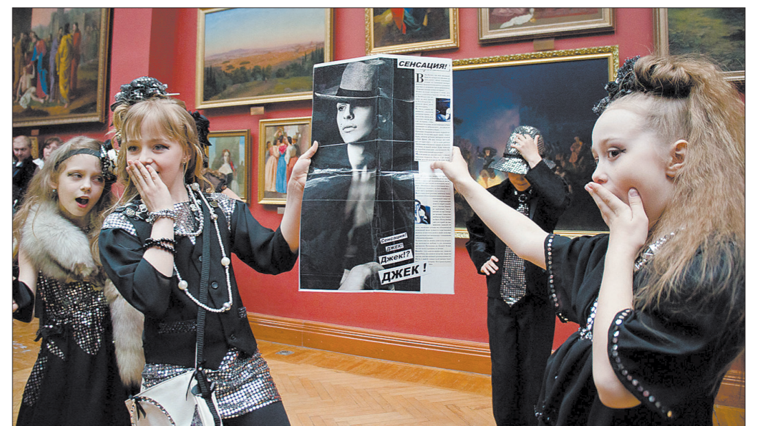
Выступает театр моды «Влада».

16 РЕКЛАМА ООО «Сберегательная Компания «Наследие»