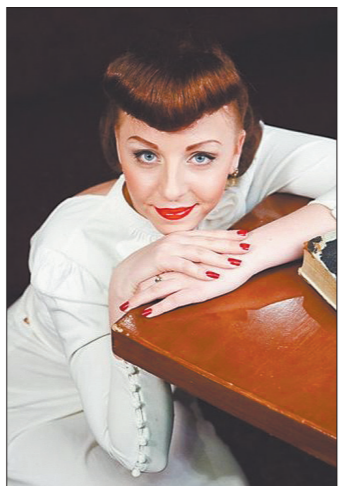
Ретрообраз в стиле 40-х годов.