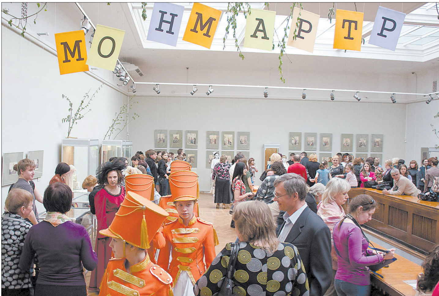
Прогулка по Монмартру.