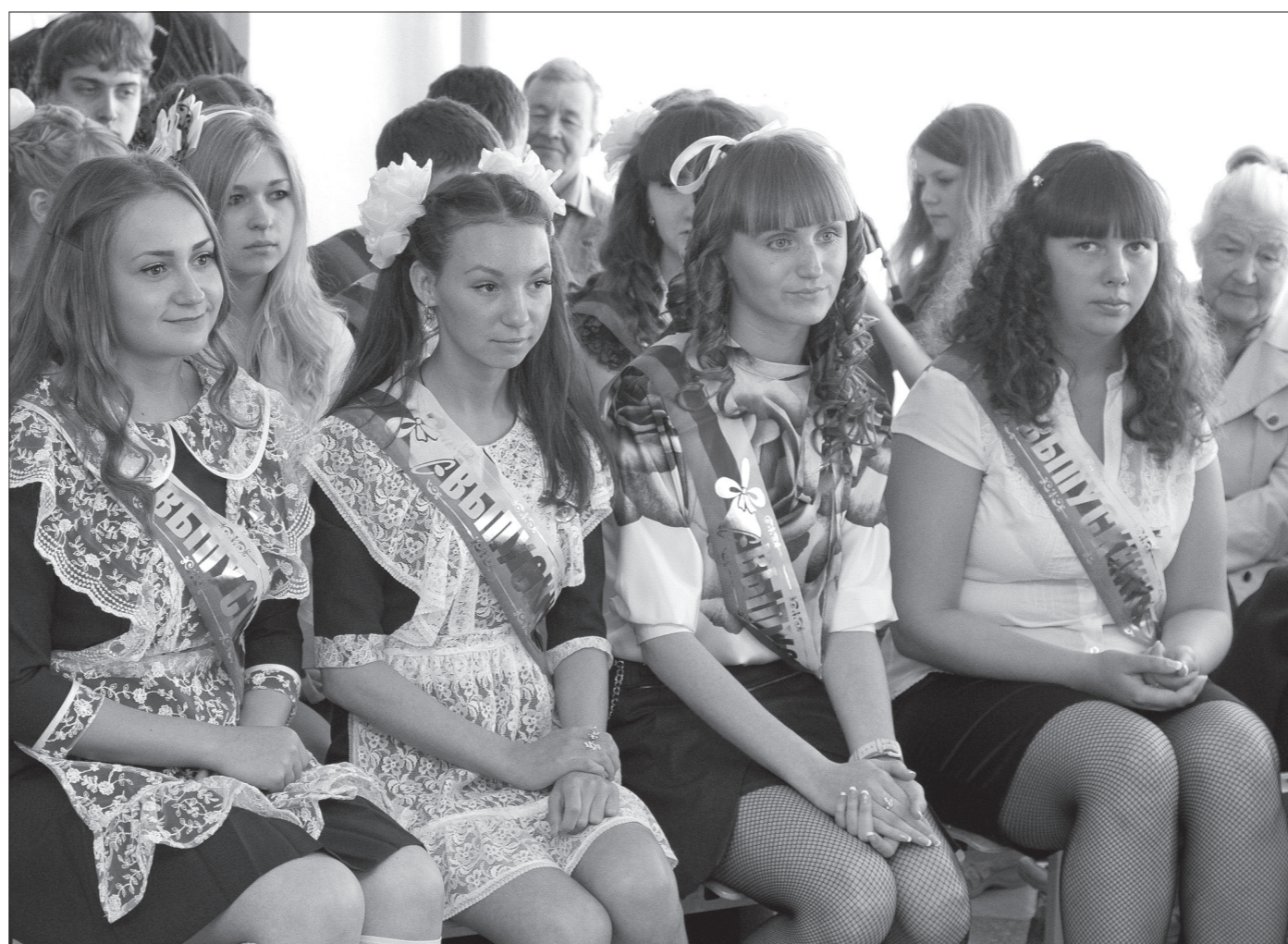
Вчерашние 11-классницы школы №1 имени Н.К. Крупской.

Министр отметил и некоторые новые проблемы: - Рассмотрели перспективу формирования математического образования в Нижнем Тагиле и увеличение числа детей, занятых в системе дополнительного образования. Для нас важно, чтобы система образования была поддержана федеральным, областным и местным бюджетами путем создания условий для реализации федерального государственного стандарта. Мы обеспечиваем ОУ интерактивным оборудованием, кабинетами, средствами доставки детей в школы – в