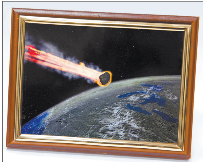
Подарок главе города — рамка с кусочком метеорита.

Одной из наиболее технически оснащенных застав, находящихся на границе Российской Федерации и Казахстана, является пограничная застава «Плодовое», расположенная рядом с городом Троицком Челябинской области. Возможности теплового сканирования территории очень пригодились нашим южным соседям после того, как над Уралом в феврале 2013 года пролетел метеорит, получивший название «Челябинский».