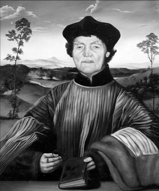
«Портрет отца в костюме итальянского дожа».