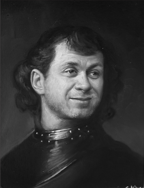
«Роман Абрамович», портрет из серии «Река времени».