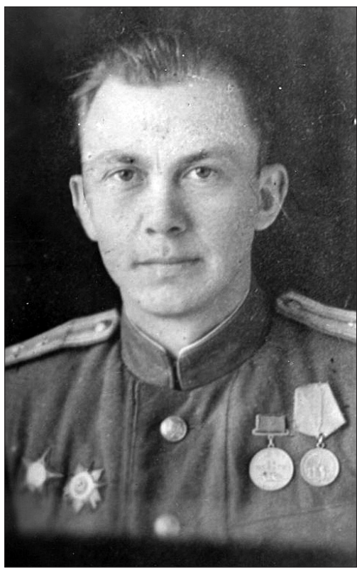
Фотография военных лет.

едва не стоило им жизни. А однажды моему отцу, старшему фельдшеру, пришлось поднимать бойцов в атаку. Перевязав раненого солдата, он увидел, что