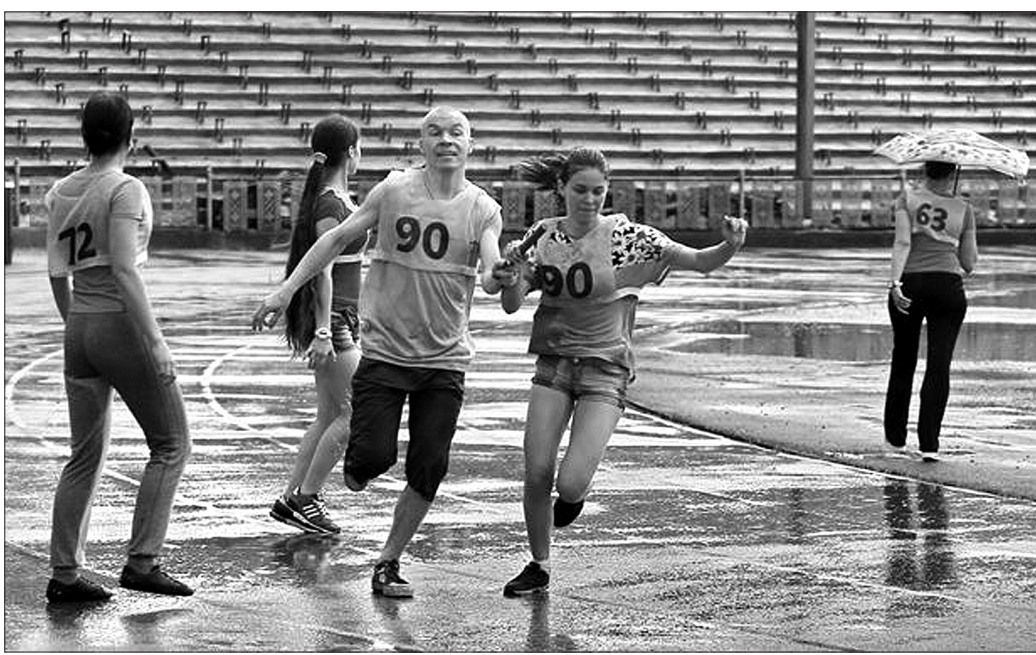
Передача эстафетной палочки.