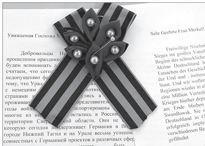
Обращение к Ангеле Меркель.

Во вторник конверт с письмом и георгиевской лентой был отправлен канцлеру Германии. Ответственную миссию выполнили активисты нижнетагильского отделения «Союза добровольцев России».