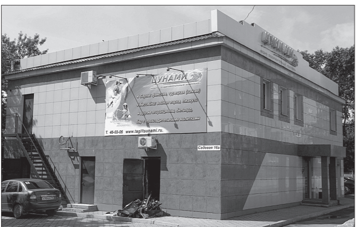
Сауну удалось вовремя потушить. Но следы прошедшего пожара еще не убрали.

В третьем часу ночи на Вагонке, на улице 7 Ноября, огонь уничтожил частный дом и надворные постройки