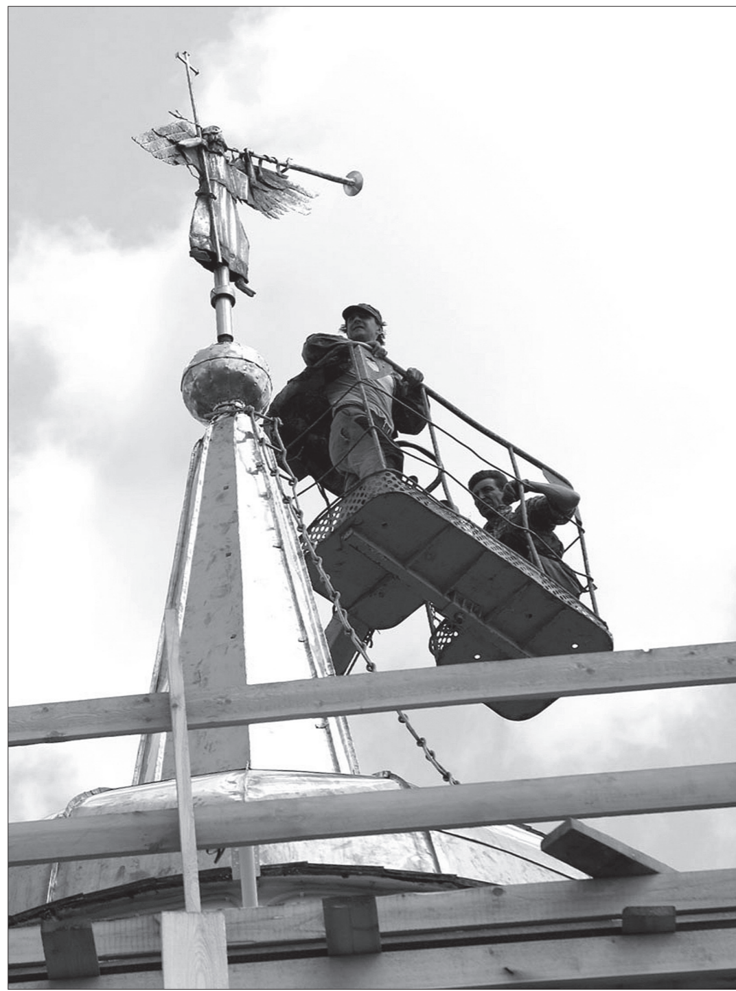
Архангел Михаил увенчал купол символа города.