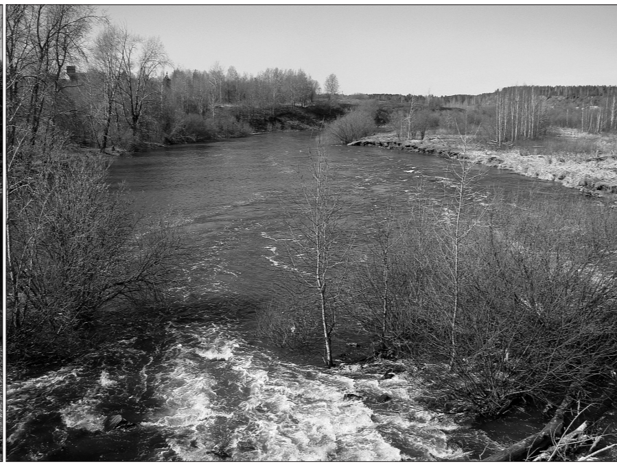
Река Тагил в районе Лебяжки.