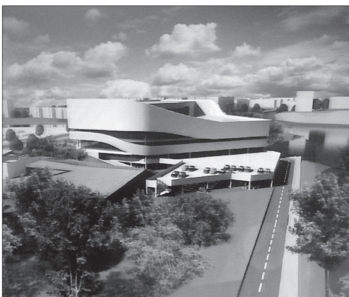
Вот так сможет преобразиться пойма реки Тагил в ближайшие годы.

Благоустройство и организацию автомобильных парковок на внутридомовых территориях Гальяно-Горбуновского массива, а также проект административно-торгового комплекса в пойме реки Тагил обсудили в мэрии на заседании градостроительного совета.