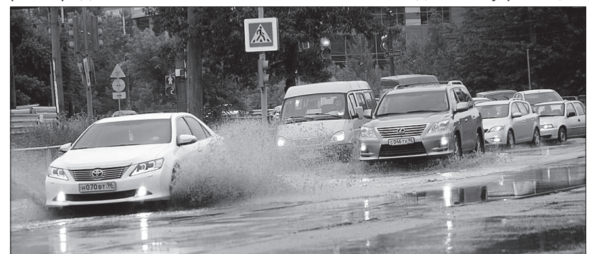
На дорогах образовались огромные лужи.

Плохая видимость осложнила обстановку на дорогах. Очередное ДТП на трамвайных путях на два часа закрыло движение по малому кольцу третьего маршрута, а «восьмерки» двигались через город.