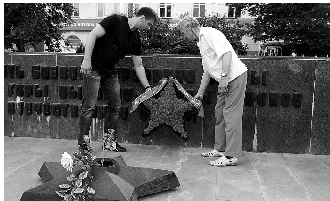
Высокогорцы возлагают венок к монументу боевой и трудовой славы горняков.

Он проследовал по пяти городам региона: Екатеринбург, Нижнему Тагилу, Первоуральску, Качканару, Серову - там, где есть предприятия горно-металлургического комплекса. Акция носила название «Наша молодежь чтит память Великой Победы». В Нижнем Тагиле активисты ГМТР приняли участие в траурном митинге, посвященном Дню памяти и скорби. На площади Горняков они вместе с сотрудниками ВГОКа возложили на мемориал цветы. Во Время Великой Отечественной войны погибло 140 высокогорцев-тагильчан, их имена высечены на монументе. Владимир ПАХОМЕНКО. ФОТО АВТОРА.