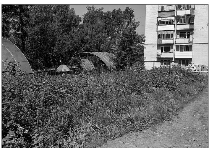
Забор садика скрывался в траве. Пока материал готовился к печати, жители домов №12 и №14 настояли, чтобы лопухи в этой части убрали силами управляющей компании «Коммунальщик». Женщина-дворник вручную срубила разгулявшуюся поросль.

Самые высокие заросли – у перекрестка Ломоносова с Огаркова: лопуховые джунгли выше человеческого роста, обрамляющие с двух сторон пешеходную дорожку. Здесь и так не очень приятно ходить (рядом контейнерная стоянка со всеми ее «прелестями»), еще и репейник добавляет отрицательных эмоций. Листья некоторых из этих зеленых гигантов превышают в длину полметра, в ширину они немногим меньше. Не удалось найти, какого размера лопух официально считается самым крупным в мире, но, думаю, тагильские братья могли бы с ним поспорить за почетное место в Книге рекордов Гиннеса. Может, не прямо сейчас, но чуть позже – наверняка!