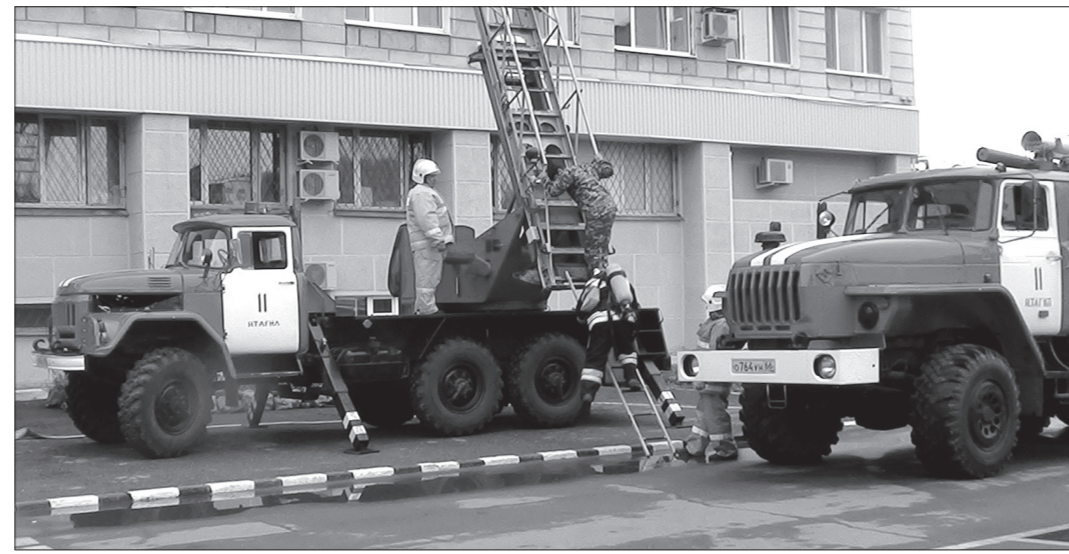
ФОТО ОТДЕЛЕНИЯ ОРГАНИЗАЦИИ СЛУЖБЫ, ПОДГОТОВКИ И ПОЖАРОТУШЕНИЯ 9-ГО ОТРЯДА ФЕДЕРАЛЬНОЙ ПРОТИВОПОЖАРНОЙ СЛУЖБЫ.

КСТАТИ. На территории пожарной части №54 прошло ежеквартальное боевое развертывание среди подразделений нижнетагильского гарнизона пожарной охраны, сообщили в отделении организации службы, подготовки и пожаротушения 9-го отряда Федеральной противопожарной службы.