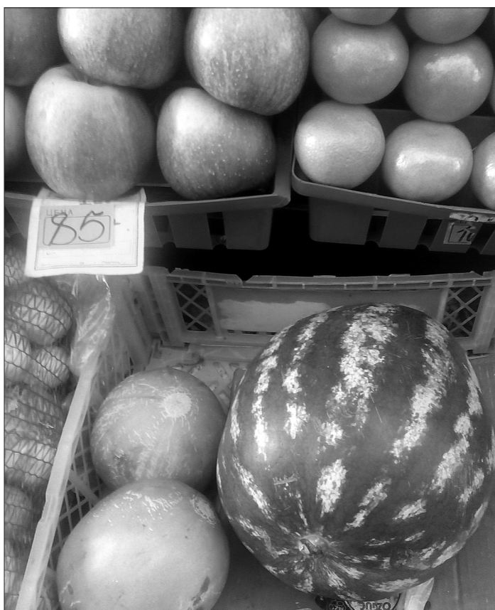
Первые арбузы и дыни пока продаются без ценников.

П очему у вас такая дорогая черешня? Она что, с золотой косточкой? - интересуются дотошные экономные