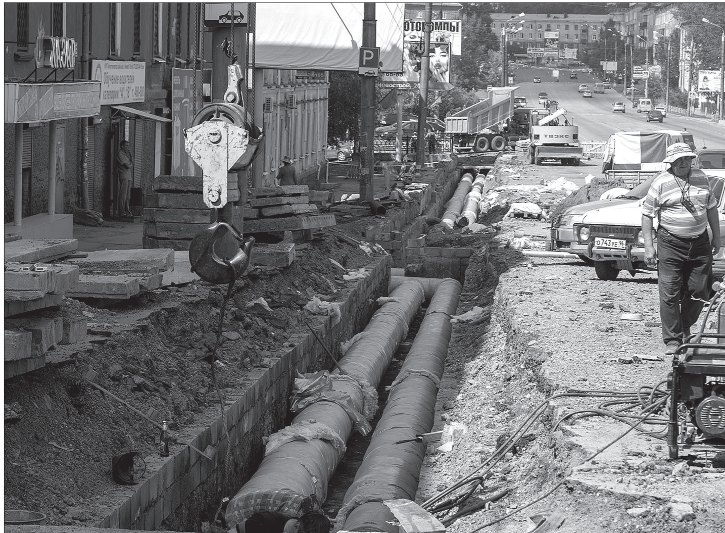
Капитальным ремонтом охвачен участок трассы на проспекте Мира протяженностью более 150 метров.

На днях МУП «Тагилэнерго» заканчивает ремонт магистральной теплотрассы на проспекте Мира, 57-63а. Скоро сюда придет дорожная техника – восстановлением дорожного полотна займется МУП «Тагилдорстрой».