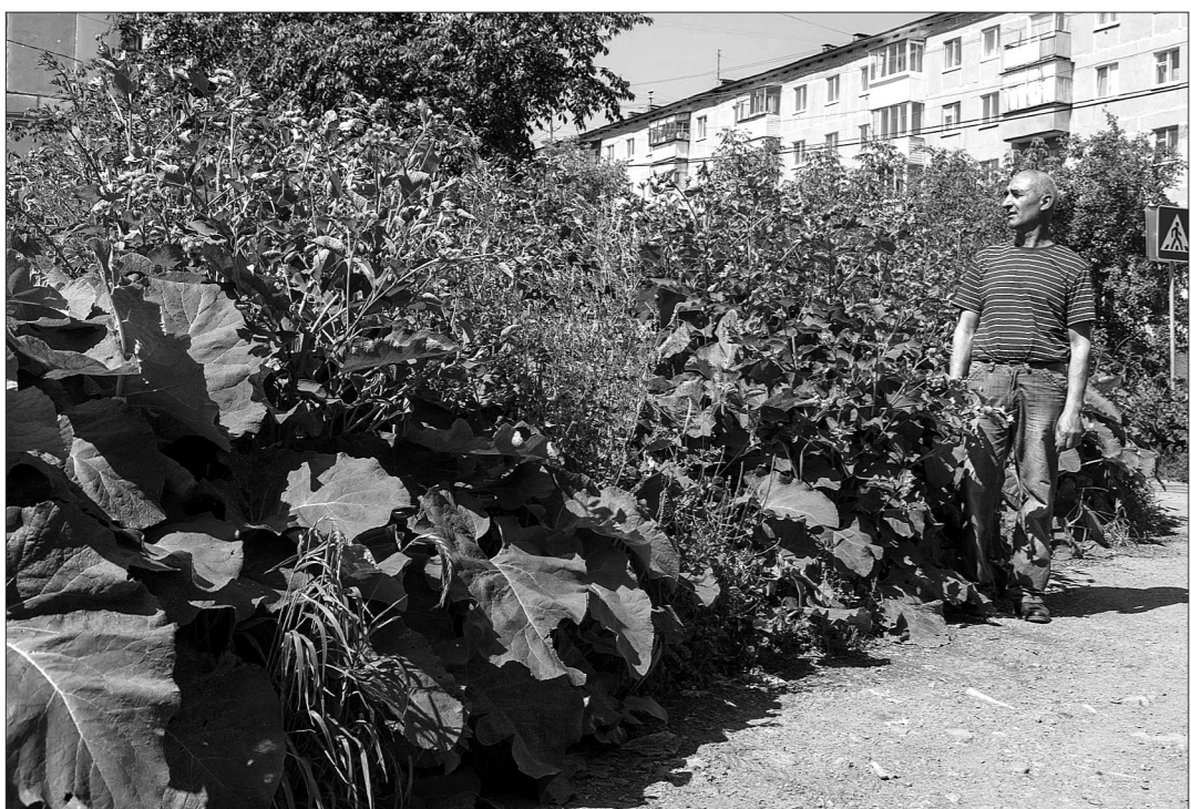
Вдоль пешеходной дорожки бурьян выше человеческого роста.