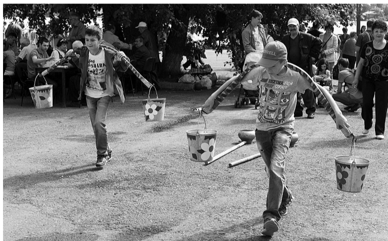
Ребята с удовольствием участвовали в многочисленных играх и конкурсах.

Впервые управление по развитию физической культуры и спорта администрации города организовало тестирование населения по программе «Готов к труду и обороне». Те, кому удавалось достичь норм ГТО, получали заслуженные подарки, а