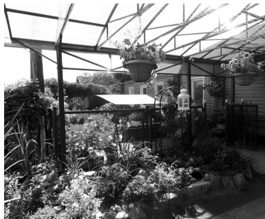
Вход в один из домов в поселке Рудника.