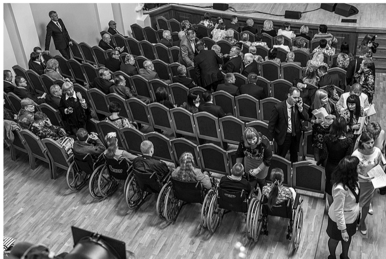
Реконструкция театра сделала доступным зал и для людей с ограниченными физическими возможностями.