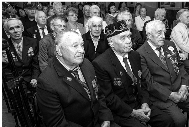
Ветераны предприятия и скульптура металлурга, которая стала экспонатом музея, но не стала тагильским памятником.

Одну из стен украшает огромное полотно генерального плана ландшафтно-индустриального комплекса «Демидов-парк», представлен и фрагмент макета реконструкции завода 1880 года, чтобы тагильчане и