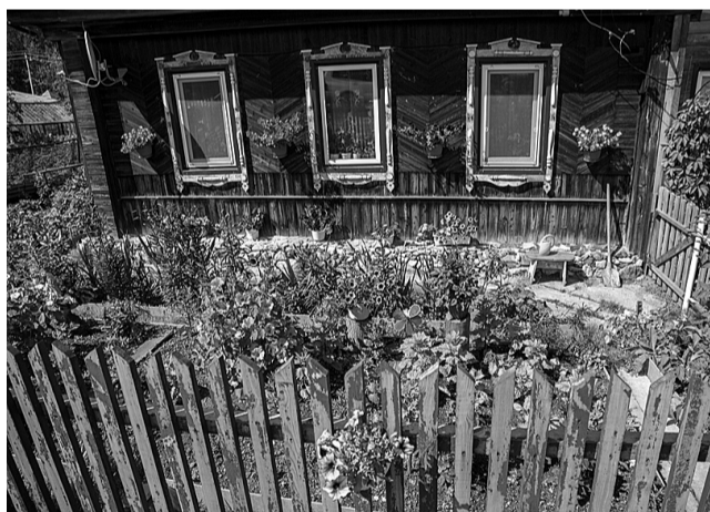
Палисадник дома №10 по улице Бурщиков (В. Черемшанка) радует и хозяев, и прохожих.

В итоге третье место отдали самоуправлению поселка за Алапаевской веткой - «Звездный». Второе место занял ТОС Рудника, где силами общестественности убрали свалку, озеленили шахтерский сквер, разбили клумбы у памятника погибшим горнякам. Именно на Руднике жюри увидело больше всего цветения. Здесь немало жителей, чьи дома с искусными цветниками украшают уличный пейзаж. Есть такие уголки и в Девятном поселке, и в Верхней Черемшанке, где наконец-то благоустроили детскую площадку.