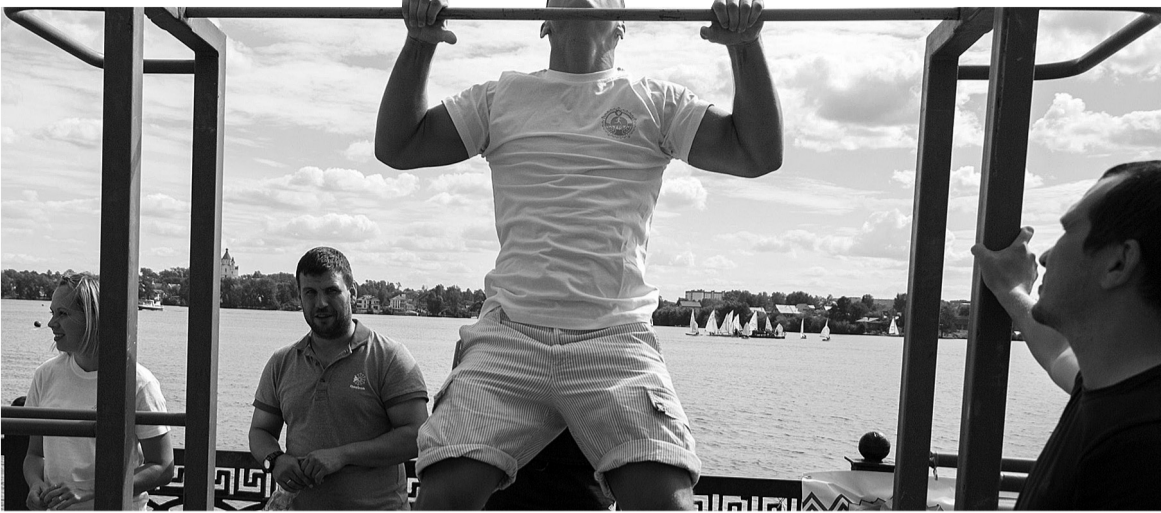
Все гости праздника могли пройти тестирование по программе «Готов к труду и обороне», показав, как они умеют подтягиваться, отжиматься от пола, бегать...