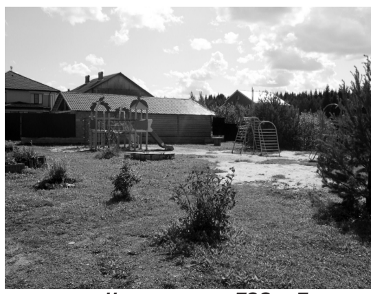
На территории ТОСа «Прудок».