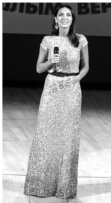
На сцене драмтеатра – народная артистка Татарстана Алсу.