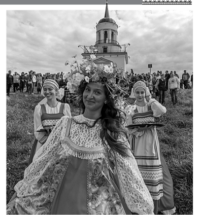
В ожидании почетных гостей.

Жители и гости очень высоко оценили новшества. Отовсюду слышались восторженные отзывы: «Какая красота!» Очень