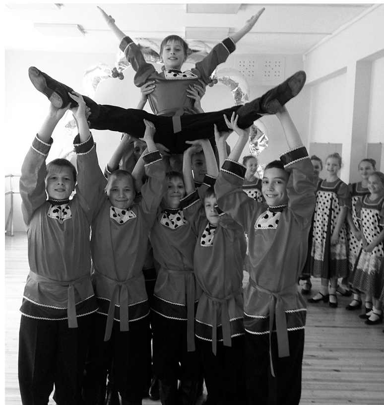
Ребята из «Родничка» покорили жюри международного конкурса.

В итоге наша средняя группа завоевала Гран-при, в активе младшей – диплом лауреата I степени в номинации «Хореография». Каждому участнику