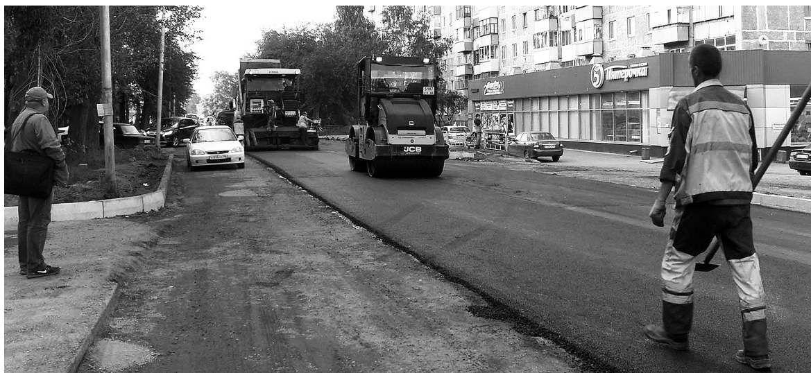
Слой нового асфальта – около 10 см.

На прошлой неделе специалисты МУП «Тагилдорстрой» начали укладку выравнивающего слоя асфальта на улице Красноармейской. Ведутся работы на участке от перекрестка с Черных в сторону Космонавтов.