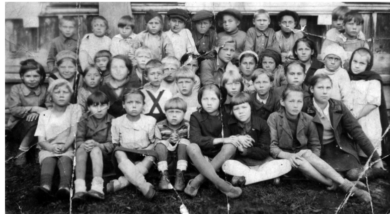
Первый мамин класс, 1944 год.

Доехали до Слюдянки, нашли районо. Нас зарегистрировали и направили в разные лесхозы.