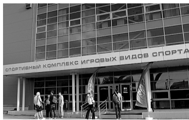
Спорткомплекс УрФУ в Екатеринбурге.

Товарищеский матч выдался напряженным. Сначала вперед вырвались тагильчане, однако хозяева площадки переломили ход игры и, казалось, были близки к победе. Но не тут-то