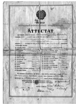
Аттестат с печатью Наркомпроса.