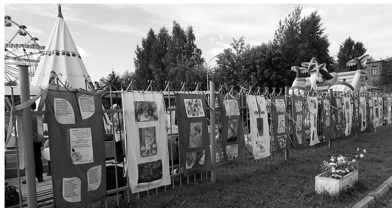
Выставка под открытым небом.