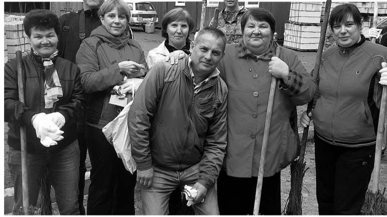
На фото, сделанном прохожими, группа ТОСовцев, участники субботника.

$ 70,84 руб. +1,73 руб. € 81,38 руб. +2,74 руб.