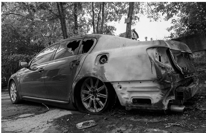
Сгоревший Lexus еще долго «украшал» двор.