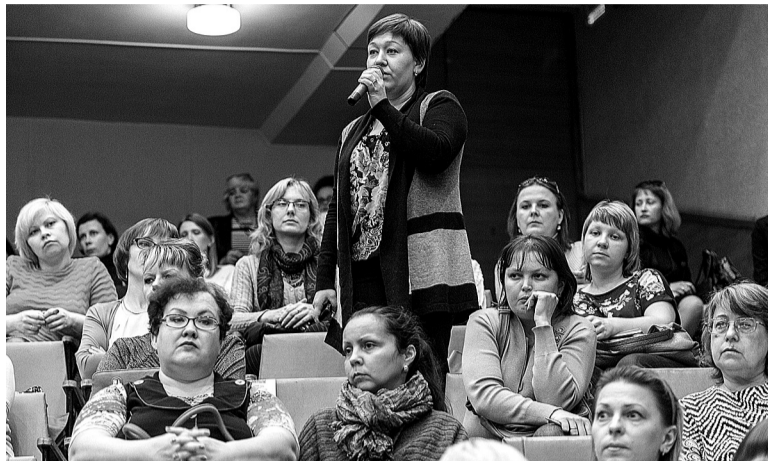
У тагильчан было немало вопросов и по школам, и по детским садам.