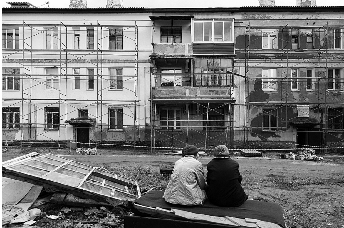
Наблюдательницы. Раньше диван у старушек стоял возле дома №9 по улице Шевченко. С началом ремонта строители этот наблюдательный пункт перенесли.

Неожиданную задачу преподнес дом №10 по улице Технической. Перед входом в первый подъезд - углубление. Оно там испокон века - видно, нарушили отметку, заливая дорогу вдоль дома железобетоном. Но в яме скапливается вода и с коляской ее миновать сложно. Раз уж делают капремонт - почему бы не