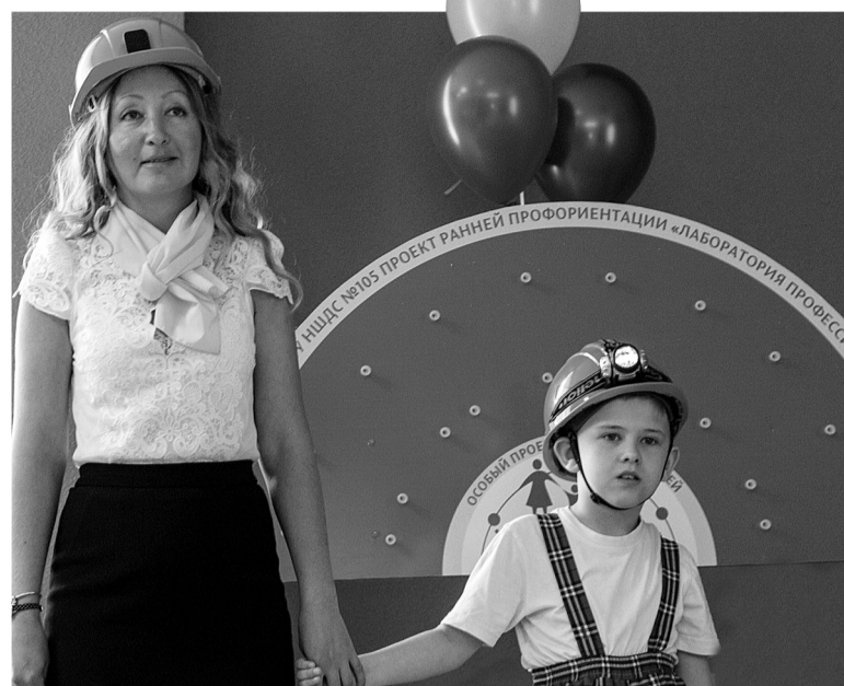
Выступление детского сада «Солнышко» с программой «Профессии нашего города».

Подготовила Людмила ПОГОДИНА.