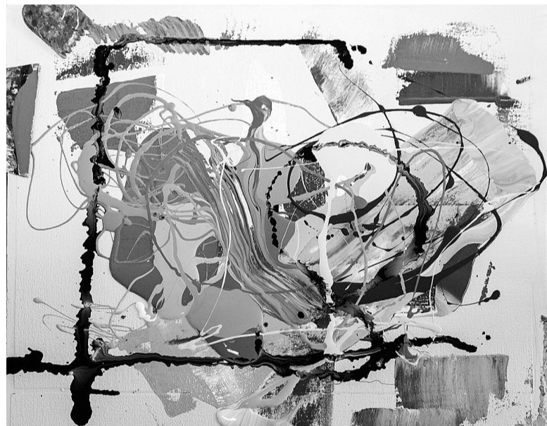
Такую картину нарисовали несколько десятков человек с закрытыми глазами.

В этот день в центральной городской библиотеке было особенно много людей в темных очках. Слабовидящие и незрячие тагильчане пришли на встречу с представителями автономной некоммерческой организации «Белая трость», чтобы поближе узнать о благотворительном проекте «Мультимобильность». Он проходит уже в 12 регионах России.