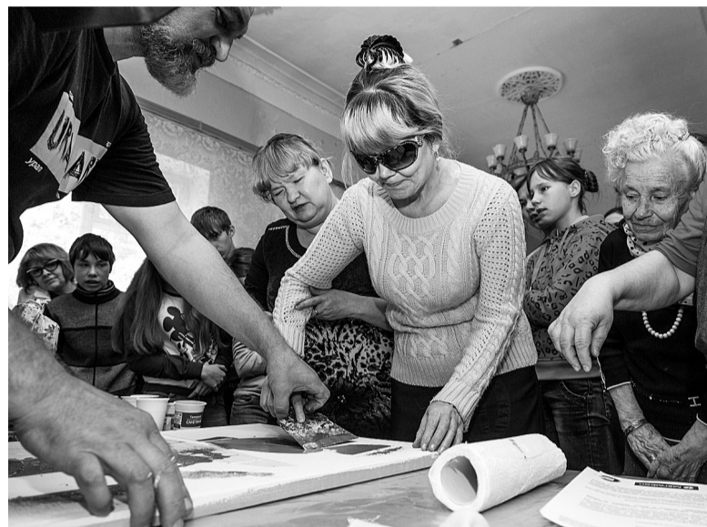
Мастер-класс «Живопись слепых».