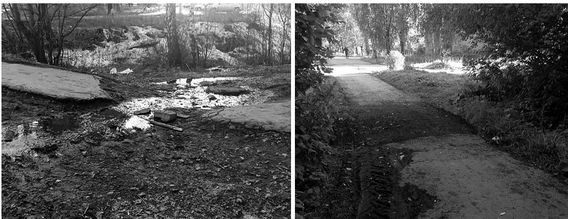
Такой наша дорожка была весной, а так она выглядит после ремонта.