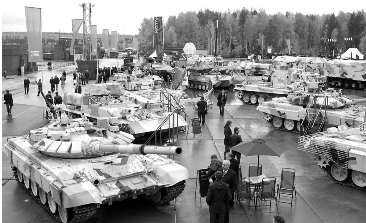
Экспозиция бронетехники..

Уралвагонзавод на правах хозяина представит расширенную экспозицию - более 40 изделий. В том числе специалисты и зрители увидят новейшую бронетехнику. Это танк Т-14, БМП Т-15 (оба на гусеничной платформе «Армата»), а также самоходную артустановку 2С35 «Коалиция-СВ». Департамент