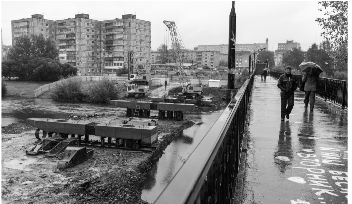
Техника на строительстве дублера работает в любую погоду.

Дублер фрунзенского моста будет готов к 10 ноября