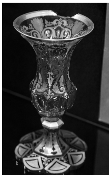
Один из самых ценных экспонатов выставки – ваза из цветного стекла с росписью золотом и серебром, XIX век.

стекла НТМК в XX веке, и десятки экспонатов. Разумеется, в каждой витрине своя коллекция: в одной - женские украшения из стекляруса, бисера и цветного стекла, в другой - флаконы духов, в третьей - фигурные бутылки для спиртных напитков, в четвертой - знакомый всем советским людям хрусталь, сим-