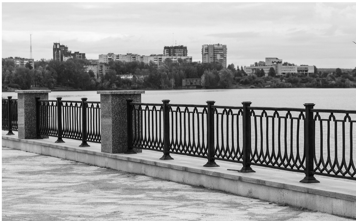
Вид с террасы.