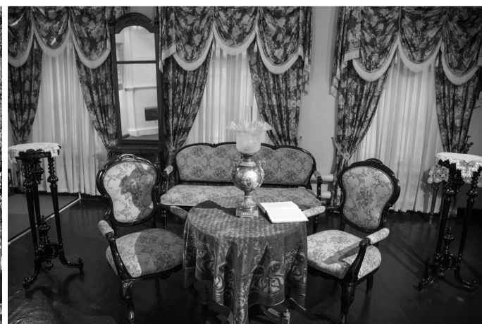
Условный интерьер гостиной XIX века в доме тагильского купца. Экспозиция в одном из залов музея быта и ремесел горнозаводского населения.