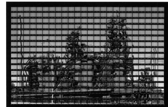
Открытка с изображением доменного цеха музея-завода.