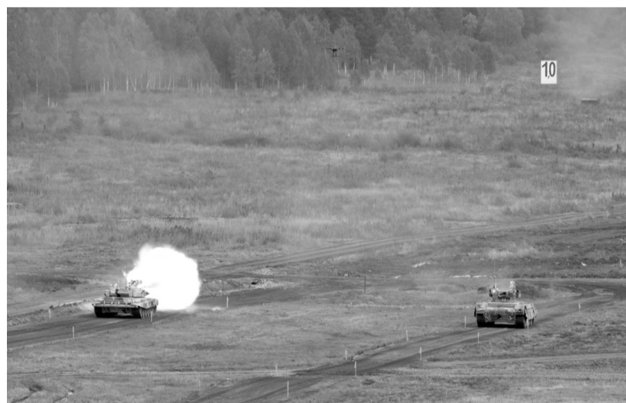
Генеральная репетиция.

Т-15 – отечественная боевая бронированная машина на унифицированной гусеничной платформе «Армата». Она предназначена для ведения маневренных боевых действий против любого противника в составе танковых и мотострелковых подразделений в качестве основного многоцелевого боевого средства в условиях приме-