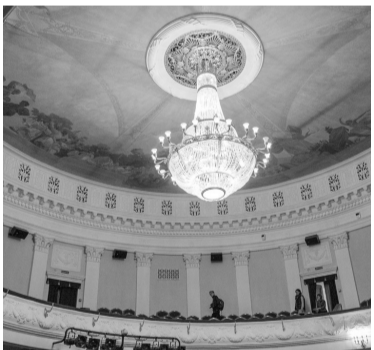
Даже люстра теперь сияет по-особому.