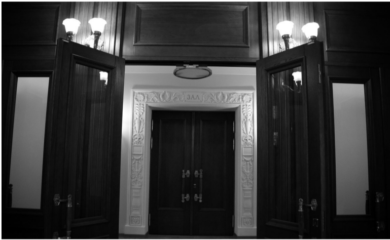
Обновленный драматический театр распахнул свои двери для зрителей.

70 лет назад создание драматического театра стало подарком тагильчанам за героический труд в годы Великой Отечественной войны. 60 лет назад у храма искусств появилось свое здание. А в год 70-летия Победы Нижний Тагил получил еще один подарок – завершилась реконструкция здания драматического театра.