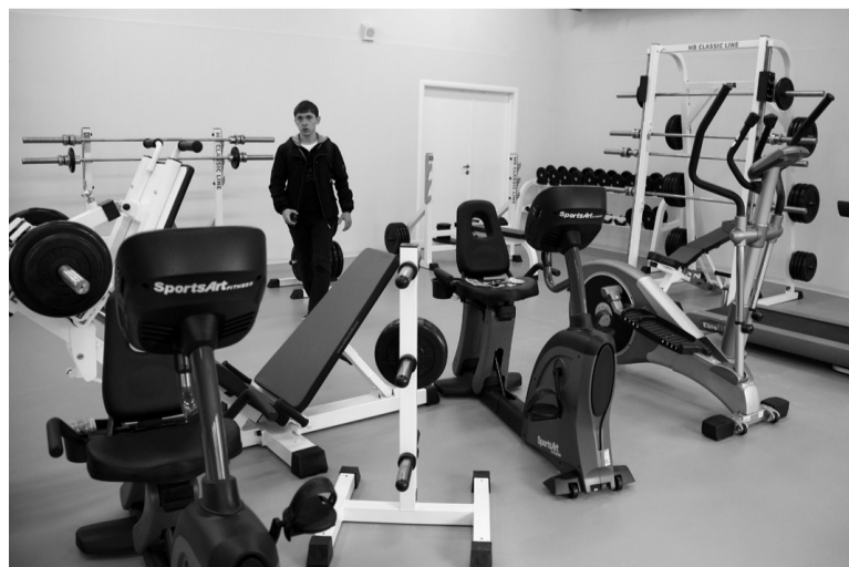
Тренажерный зал.

Мультиспортивный зал рассчитан на 500 зрительских мест. Паркет - из березовых досок. По словам директора ФОКа Сергея Кутепова, характеристики по эксплуатации этого материала - самые лучшие. На таком покрытии можно заниматься мини-футболом, гандболом, волейболом и баскетболом. Есть возможность трансформировать площадку, чтобы использовать ее одновременно для тренировок по двум видам спорта. Трибуны тоже передвижные.