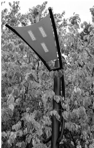
Фонарь: светить будет ярко.