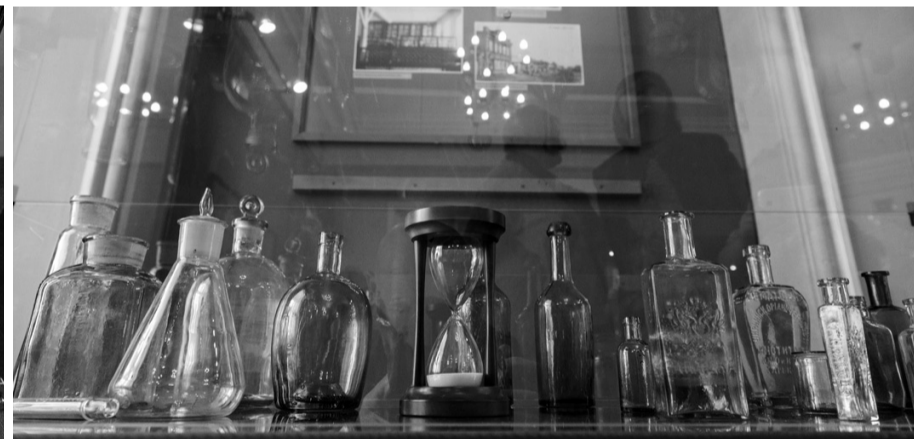
Мерная посуда для приготовления лекарств и аптечная тара начала XX века.