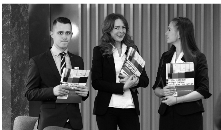
Сотрудники нового отеля.

ник удачно расположен рядом с деловым центром Нижнего Тагила, на берегу Нижнетагильского пруда, и удачно вписался в концепцию обновленной набережной «Тагильская лагуна».