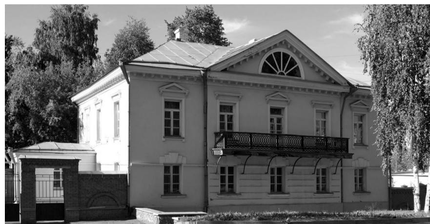
Музей истории техники «Дом Черепановых».

Людмила ПОГОДИНА.