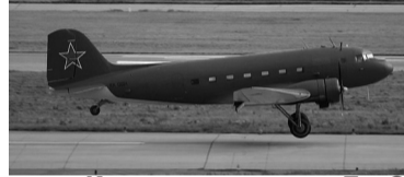
Крылатая машина Ли-2.

Надо сказать, что это уже третий самолет, который наш-