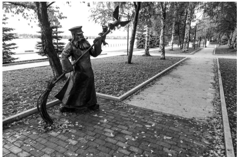
За порядком следит металлический дворник.