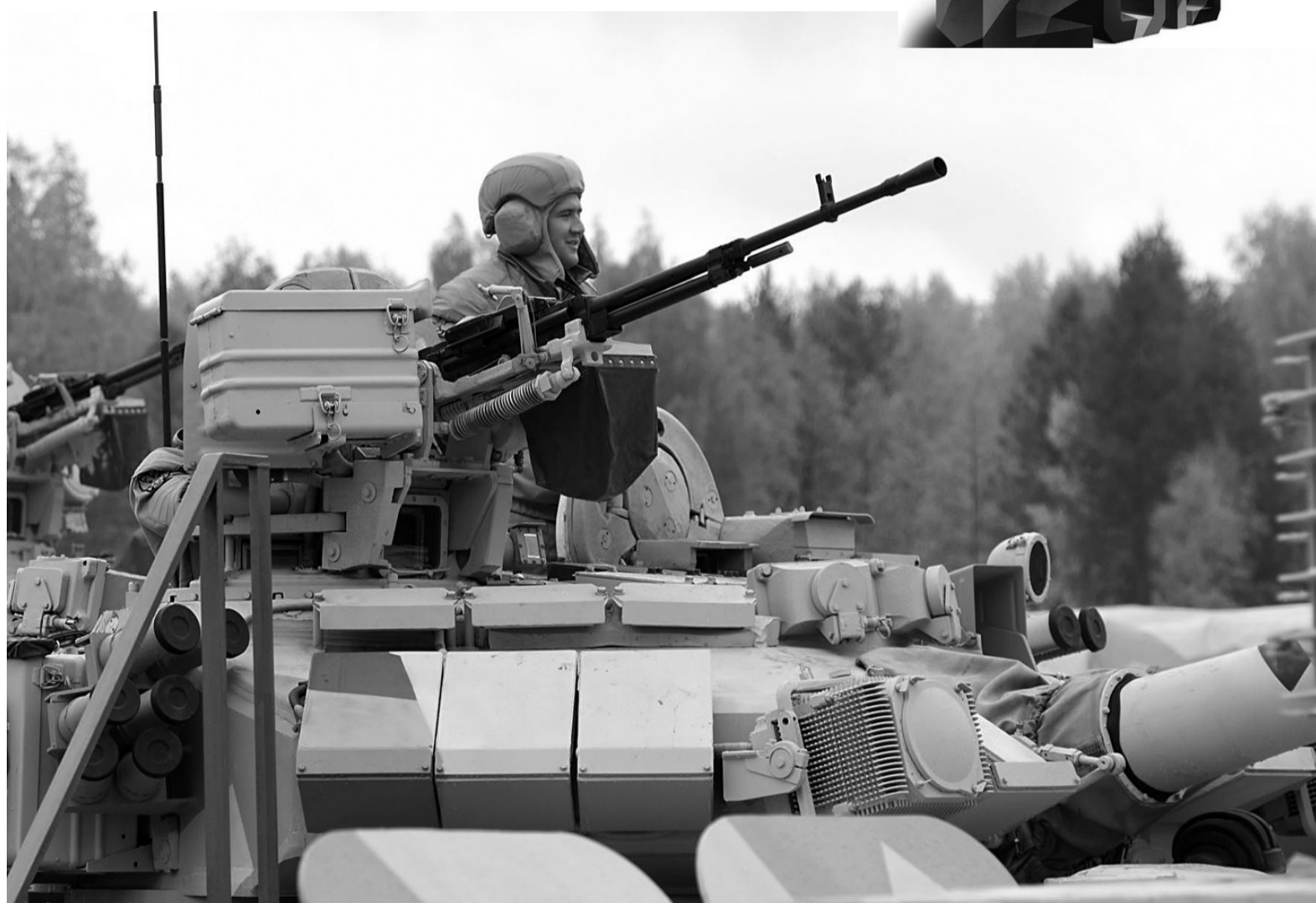
Танки к бою готовы.