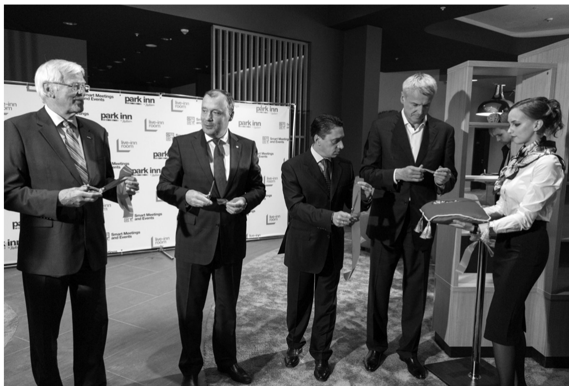
Торжественный момент открытия.

К услугам гостей 127 номеров различной ценовой категории. Среди них 10 улучшенных номеров, четыре полулюкса, 3 люкса, еще семь номеров предназначены для людей с ограниченными возможностями. Выдержанный спокойный интерьер в деловом стиле, строгий, без дорогих и помпезных излишеств, а также высочайшие стандарты качества обслуживания, которыми известны отели Park Inn по всему миру. Новый четырехзвезд-