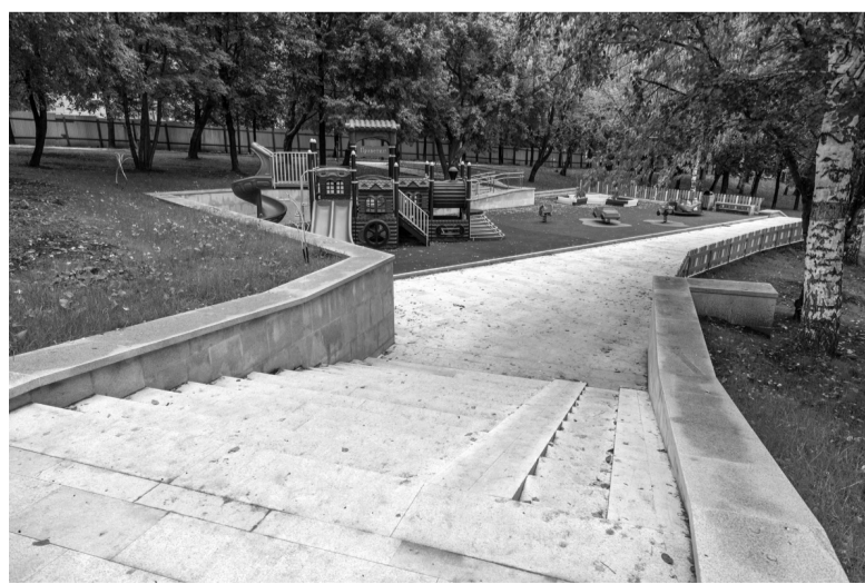
Детская площадка уже готова принять малышей.

Татьяна ШАРЫГИНА.