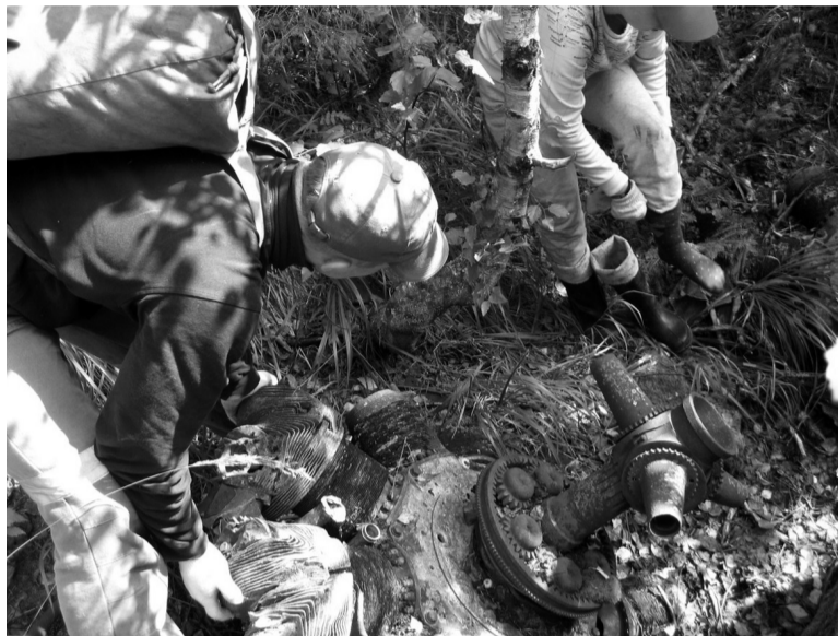
Уцелели детали самолета.