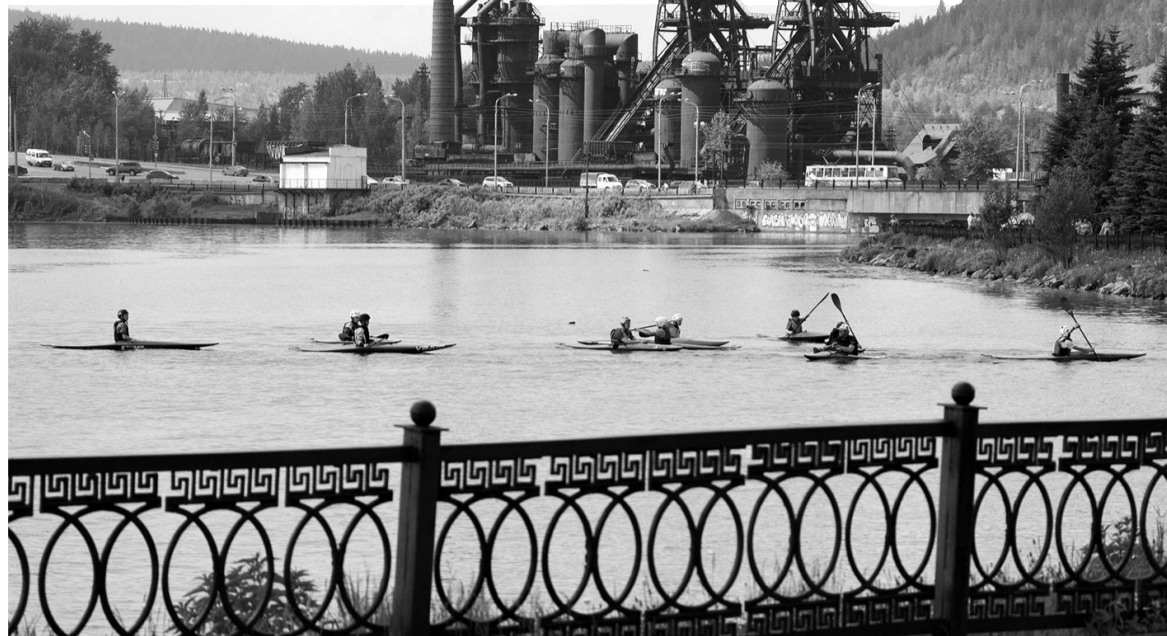
Музей-завод истории развития техники черной металлургии.

У музея-заповедника ежегодно прибавляется по филиалу: в 2013 году - музей-усадьба «Демидовская дача», ныне - мини-музей в сторожевой башне на Лисьей горе. Возможно, поэтому в городе не утихают разговоры о том, каким же должен стать литературно-музейный центр «Дом Окуджавы», и по-прежнему звучат предложения не делать его библиотечным филиалом, а отдать музею-заповеднику.