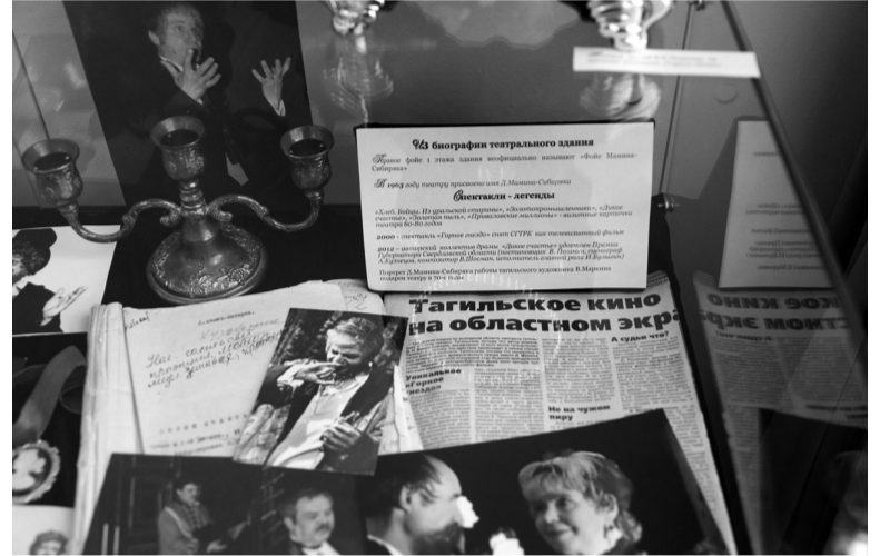
Одна из витрин возрожденного музея.

После реконструкции в театре появились новые кресла и занавес, современная световая и звуковая аппаратура, специальные подъемники и места в зрительном зале для людей с ограниченными возможностями здоровья, вынужденными передвигаться на инвалидных колясках. А еще, почти через четверть века, здесь вновь открылся театральный музей. И неудивительно, что в первые дни его работы очередь сюда была больше, чем в буфет.