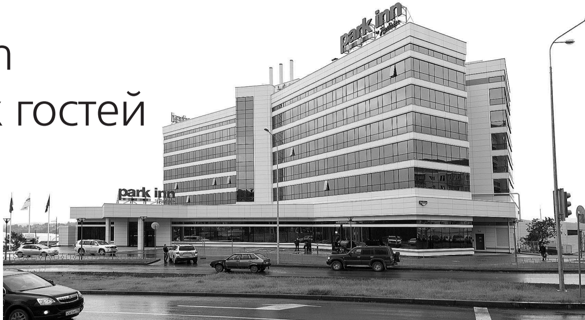
Park Inn - звезда «Тагильской лагуны».

Новый международный четырехзвездочный отель Park Inn by Radisson Нижний Тагил, расположенный в самом центре города, уже начал принимать первых посетителей. Это так называемые «тестовые» клиенты, то есть тагильчане, которые на практике пытаются понять, как работает гостиница, в чем ее преимущества, и обратить внимание на недостатки, если они есть. Однако то, что гостиница будет востребована, свидетельствует тот факт, что все гостиничные номера Park Inn на время проведения выставки RAE 2015 уже забронированы и оплачены. Причем произошло это почти две недели назад. В новом отеле будут жить гости выставки из Индии и чиновники из правительства Российской Федерации, участники международного салона.