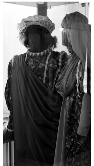
Костюмы из спектакля «Ромео и Джульетта».

Время работы музея - за полчаса до начала спектакля и в антракте.