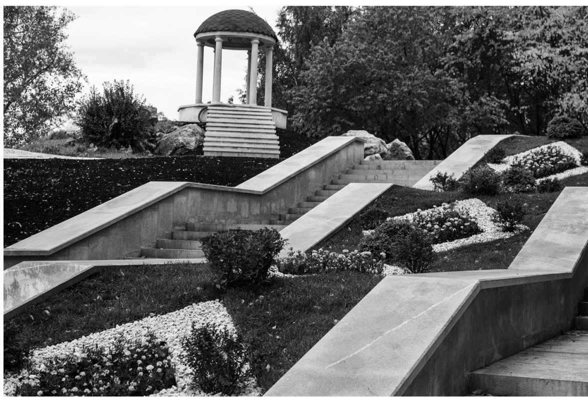
Ротонда наверняка станет самым популярным местом для фотосъемки.

менно смогут разместиться до 600 автомобилей. Кроме того, есть возможность оставить машину в «карманах» на улице Горошниковой.