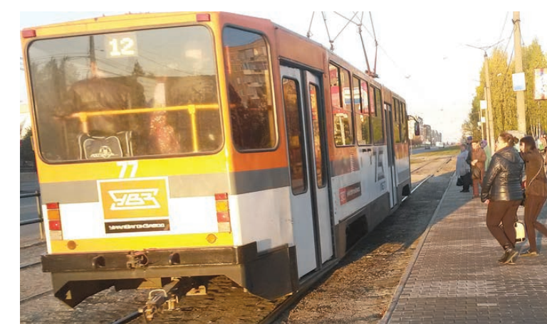
Чтобы взобраться в трамвай, надо с остановки... сойти.

А ведь некоторые тагильчане видели остановки и в Праге, и в Берлине, да и в ряде российских городов современные остановочные комплексы тоже имеются. Когда же начнем использовать лучший опыт? Тем более что Нижний Тагил расцветает на глазах.