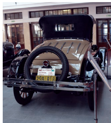
Star из Калифорнии.

оригинальная отделка кузова, роскошные автомобильные эмблемы в виде статуэток - целое произведение искусства.