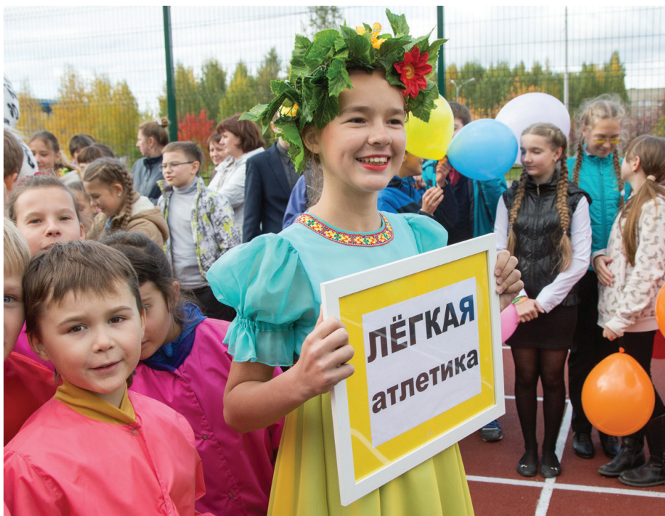
Парад видов спорта.