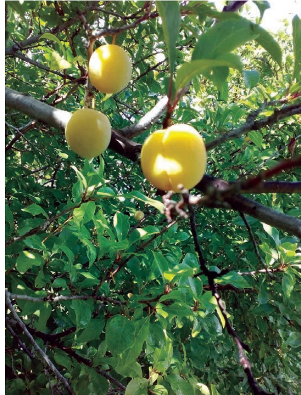
Темная слива хорошо хранится, а вот желтая - слаще.

ву не хватает влаги. Это самая первая причина осыпания любых плодов. Нужно поливать каждое растение раз в неделю хотя бы по два-три ведра. Слива относится к влаголюбивым культурам, однако избыток воды может вызвать пожелтение листьев и привести к засыханию верхушек. Если полив проводится нерегулярно, то плоды начинают трескаться и опадать.