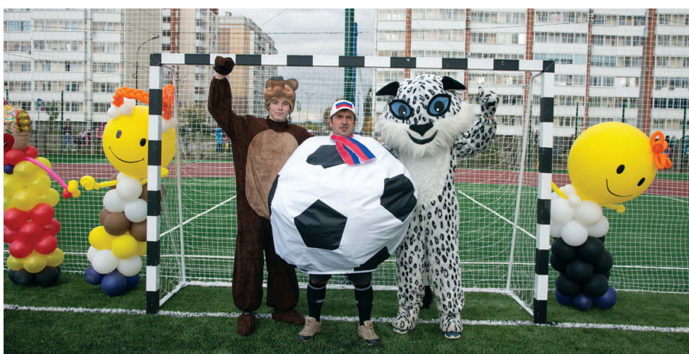
В честь открытия стадиона состоялся спортивный праздник.

Анастасия ВАСИЛЬЕВА.