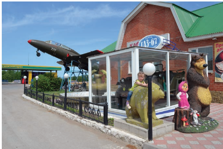
Хозяйка кафе, чтобы привлечь проезжающих, устанавливают детские площадки и экспозиции из раритетных авто и даже самолетов.

Главная проблема в том, что, в отличие от кафе на АЗС, вполне себе непрезентабель-