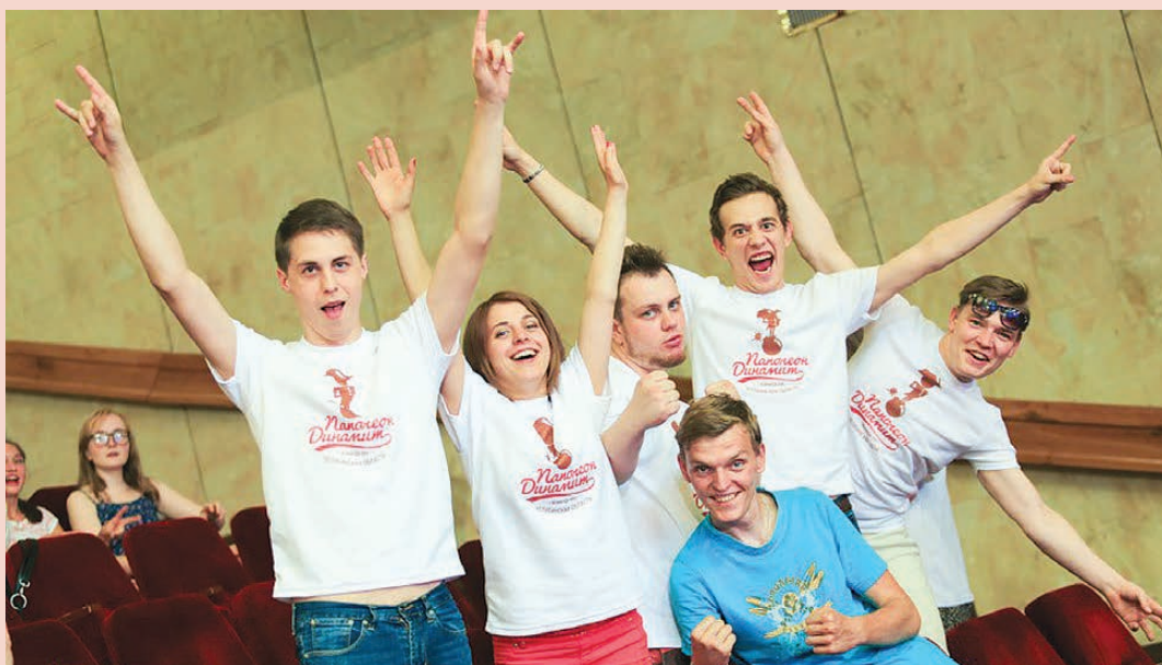
Команда «Урал».

Выступление команды «Урал» показали в эфире Первого канала