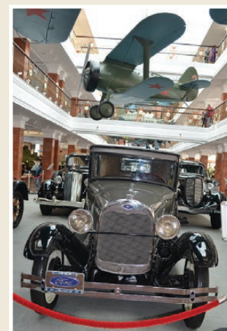
Роскошь и статус