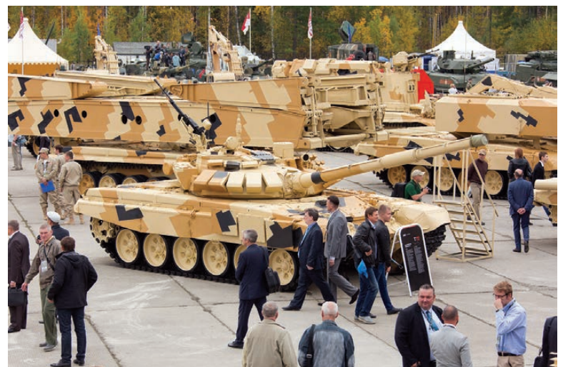
Экспозиция бронетехники.

Что касается сооружения моста через городской пруд, что позволит снять транспортную нагрузку со старой демидовской плотины и кратчайшим путем соединить два густонаселенных района Нижнего Тагила, то председатель правительства