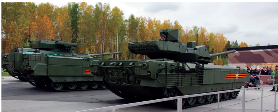
Бронетехника на платформе «Армата»: справа - танк Т-14, рядом - боевая машина пехоты Т-15.