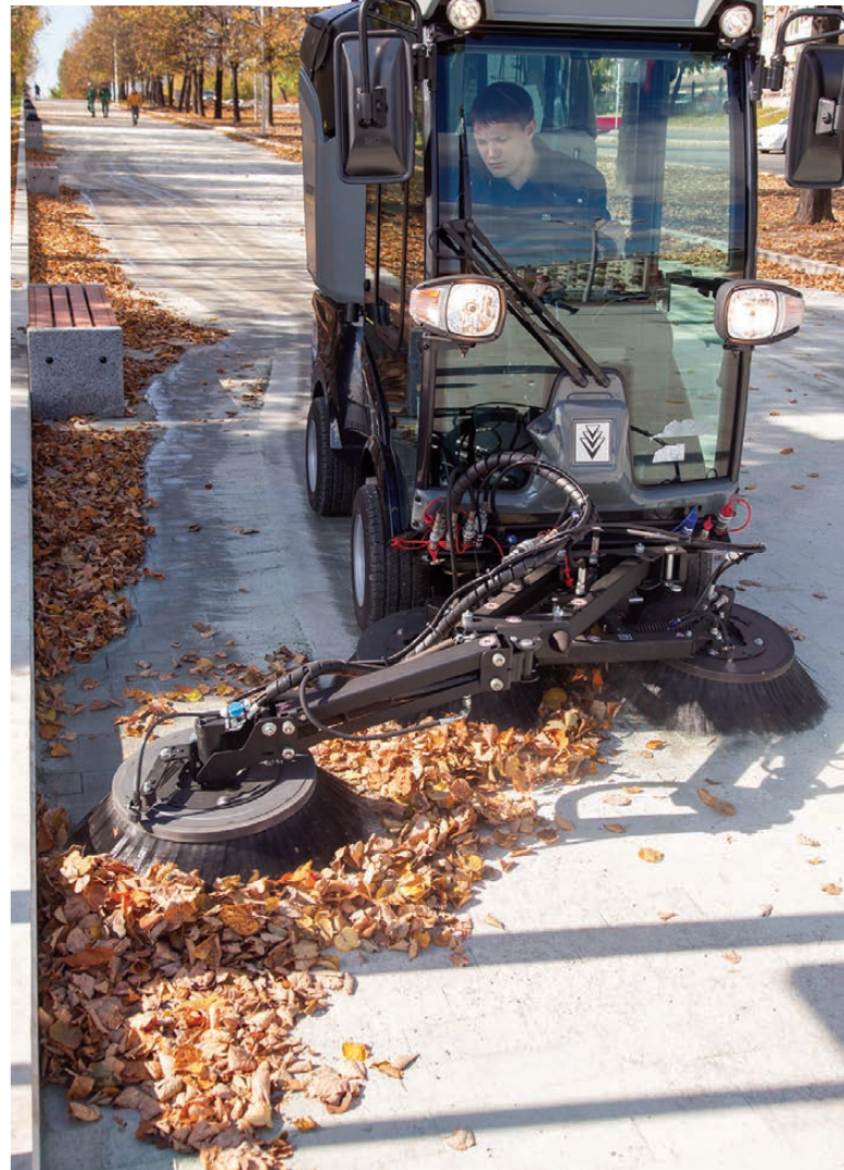
На новой набережной испытали новую мусороуборочную машину.