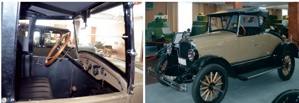
Внутри - как советский грузовик, снаружи - машина миллионера.

Уникальные автомобили со всего мира - в одном музее