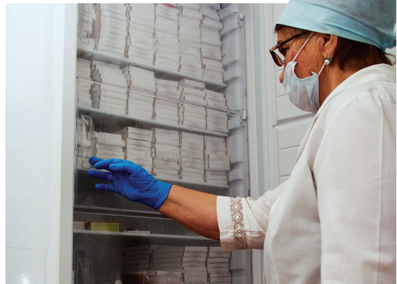
В прививочном кабинете Демидовской поликлиники: специальный холодильник для хранения вакцин заполнен до отказа.

Стоимость прошлогодней вакцинации в нашей области – 22,5 миллиона рублей, – продолжил Юрий Яковлевич. – Эти затраты позволили предотвра-