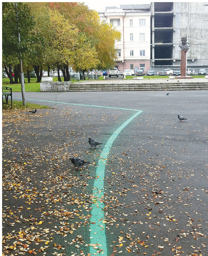
«Малахитовая линия» в сквере у театра кукол.

Подготовила Людмила ПОГОДИНА.