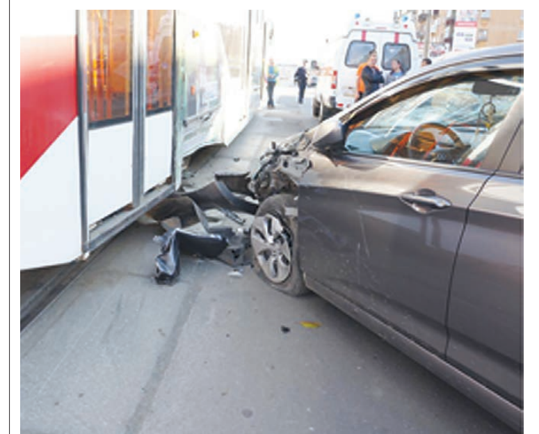
В сентябре это уже не первый случай «атаки» легковушкой трамвая.

Елена БЕССОНОВА.