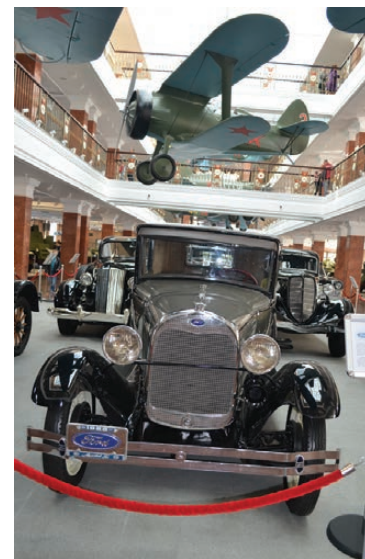
«Форд» 1927 года выпуска.

Но не только гражданские автомобили есть в экспозиции