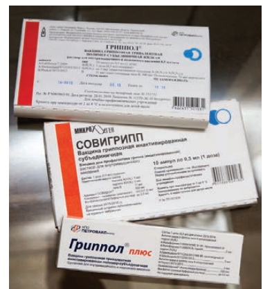
Эти вакцины имеют специальный состав для защиты от гриппа в 2015 году.

Чтобы грипп не распространился среди детей, нужно вакцинировать до 90 процентов воспи-