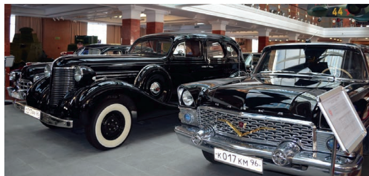
Символы советской эпохи.

Многие из машин, кстати, имеют регистрационные номера, что позволяет прокатиться на них по современному городу. Но машины интересно просто рассматривать: ведь первые автомобили были действительно роскошью, а не только средством передвижения. Да, они не могли похвастать современными эксплуатационными характеристиками, но зато