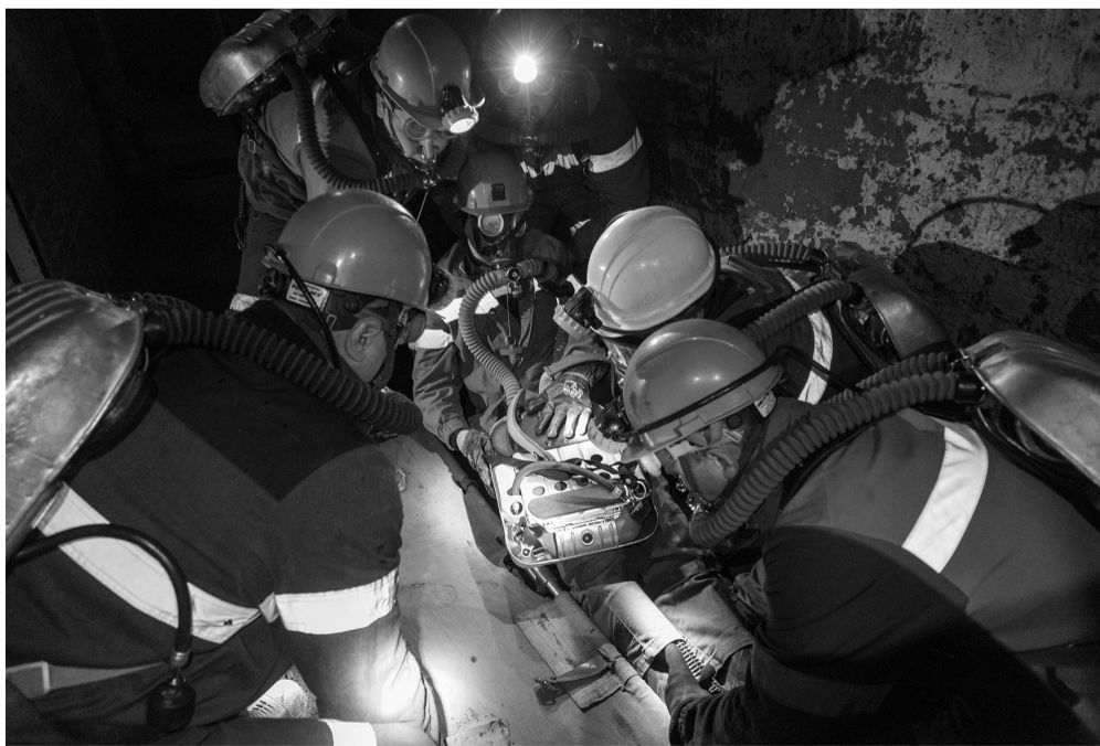
Подземный горизонт шахты «Учебная». «Пострадавшего» укладывают на носилки.