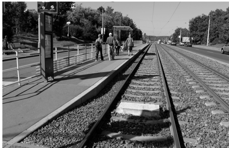
Зарубежный опыт создания трамвайных остановок, который никак в Тагиле не приживается.

Да, обидно. Такой сквер рядом с остановкой отгрохали, столько дорожек плиткой вымостили. А рядом пассажиры по-прежнему будут не заходить в трамвай, а подниматься на ступеньку вагона, чтобы про-