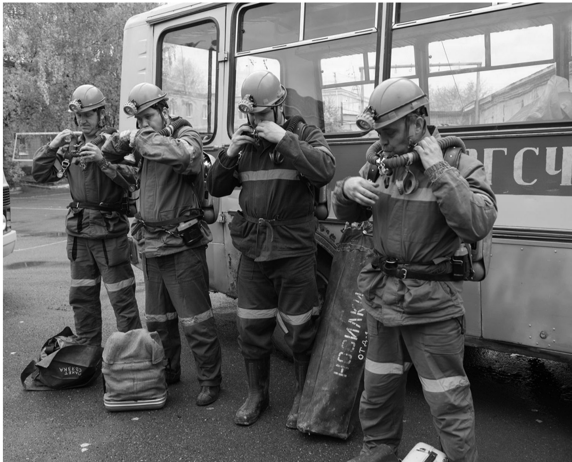
Беглая проверка респираторов.

На поверхности условно пострадавший был приведен в сознание при помощи аппарата ис-