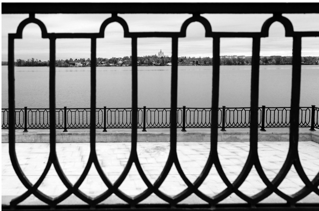
На набережной.