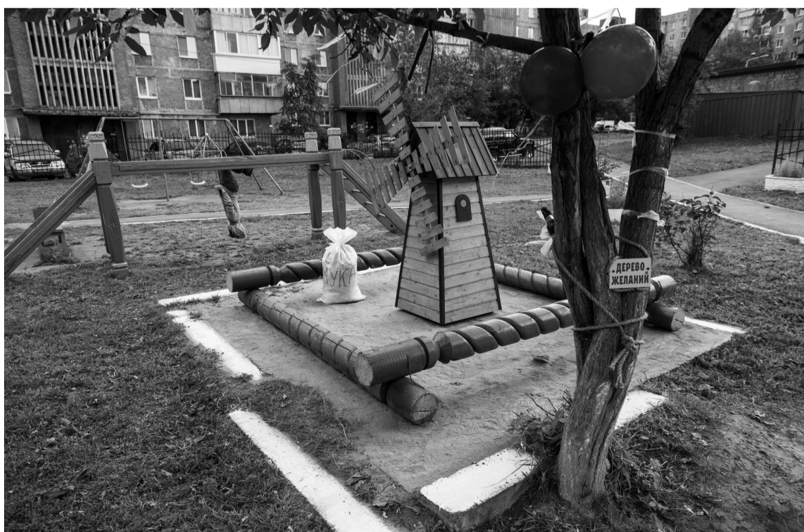
На детскую площадку «Космоса» приходят играть дети из соседних домов.