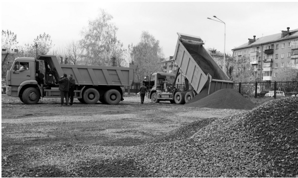
На этом месте появятся баскетбольная и волейбольная площадки.

Еще недавно на территории стадиона росла трава по пояс, а земля была в ухабах, словно бы здесь только что проехал трактор. Поле давно перестало быть спортивным, а служило разве что для выгула собак.