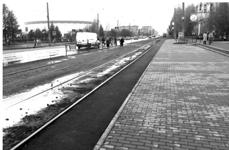
«Бесхозную» полосу вдоль остановки заасфальтировали.

должить подъем дальше... Для кого-то – пустяк, а для кого-то – серьезное испытание для боль-