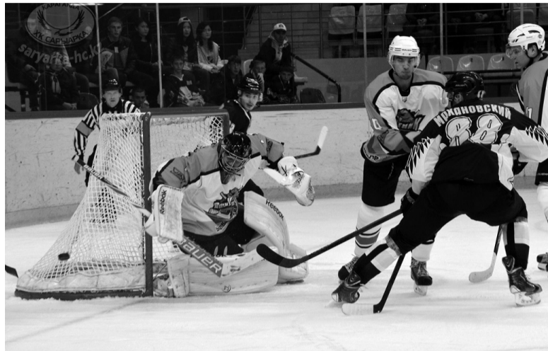
Атака на ворота «Спутника» не приносит хозяевам успеха.