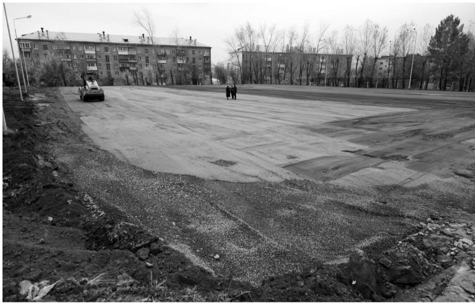
Подготовлено щебеночное основание для укладки искусственного газона.

В школе №64 приступили к строительству футбольного поля