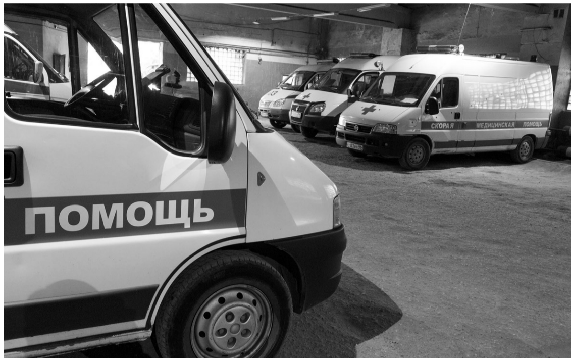
Срок службы «скорой» – всего пять лет.

Заработная плата начинающего шофера на Станции скорой медицинской помощи составляет 12 тысяч рублей. Спустя пару лет он сможет получить небольшую прибавку.