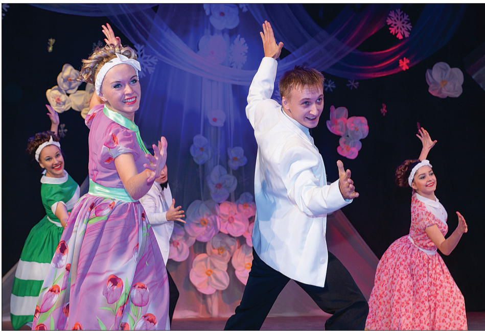
Номера «Акцента» яркие и запоминающиеся.