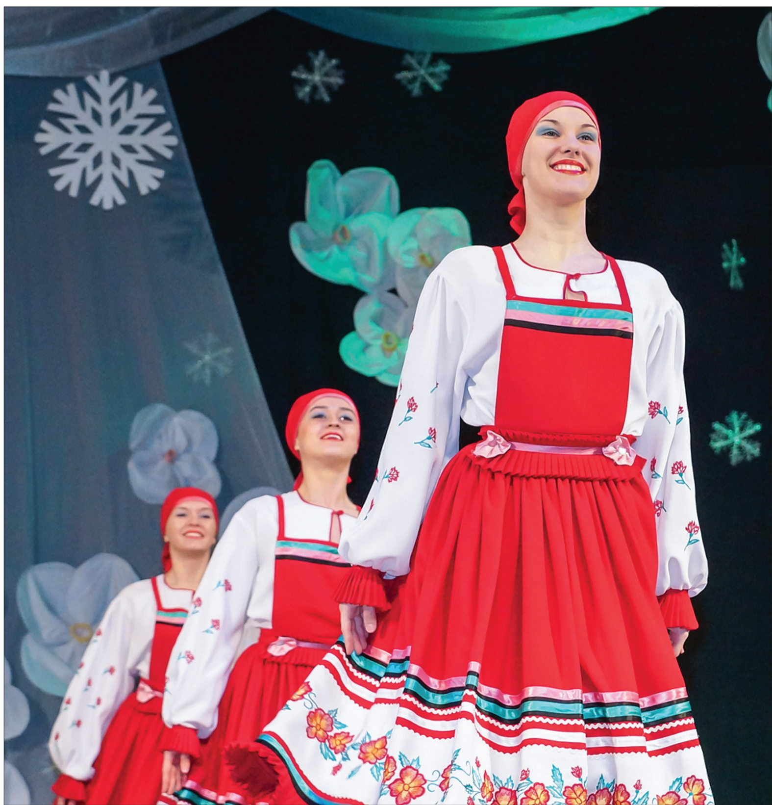
Хореографический ансамбль «Акцент» - один из имиджевых коллективов города.

На сайте www.tagilka.ru стартовал антикризисный проект «Где цена ниже?»