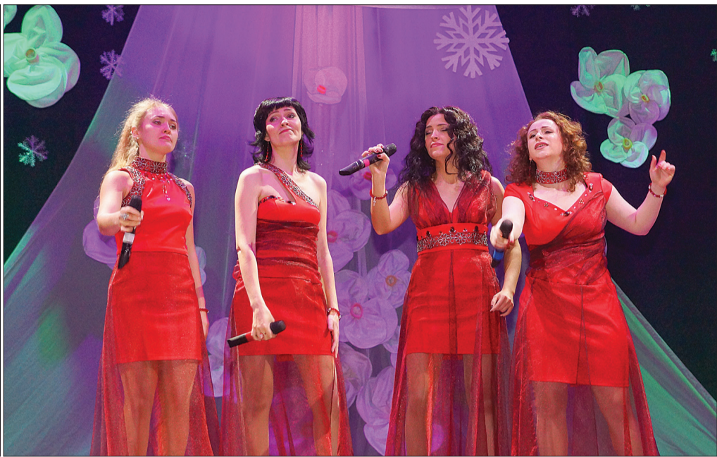
Шоу-группа «Мейдл» поразила зрителей пением.