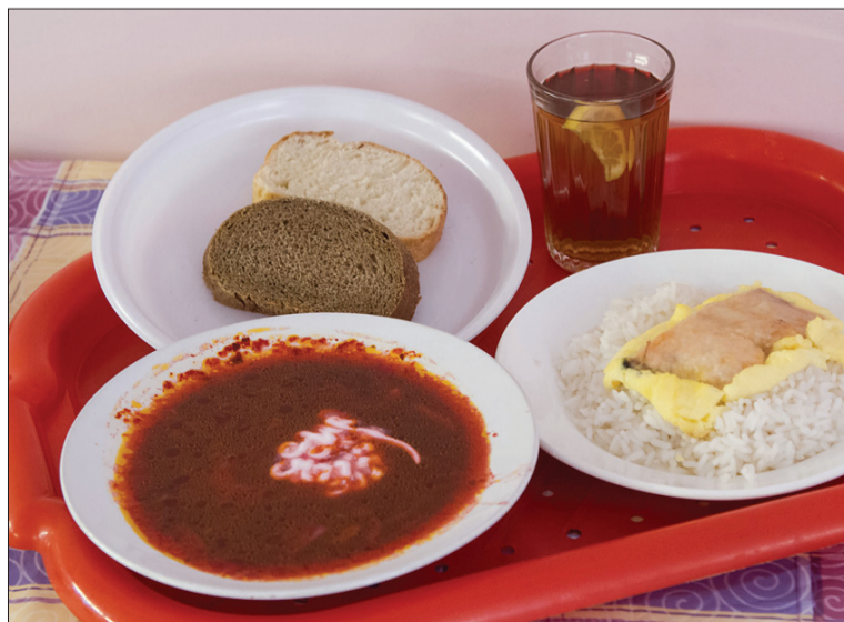
Школьный обед в ОУ №6.