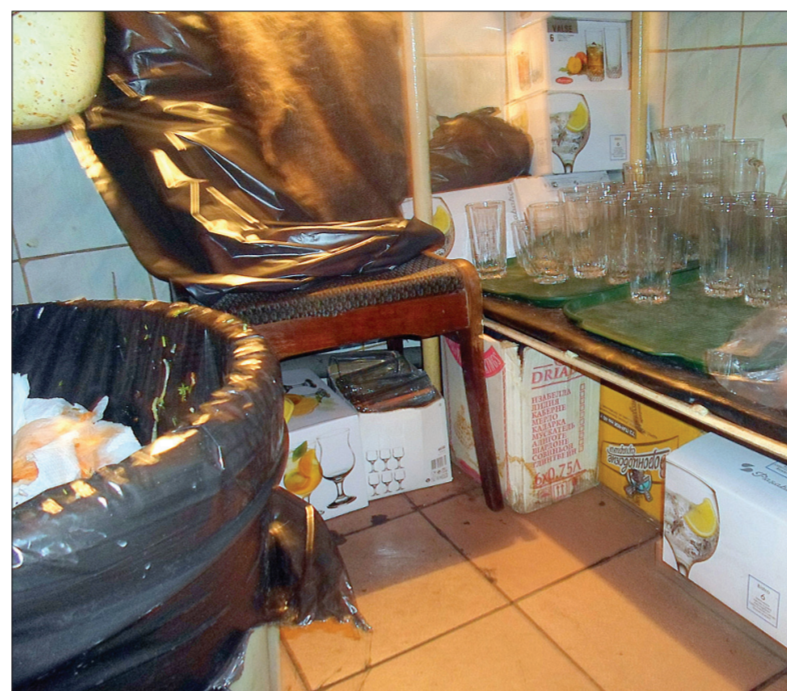
Мусор и бокалы для напитков находятся рядом.

Дольше всего организаторы проверочной закупки проверяли факт обсчета и обвеса. Подставная компания из шести человек по просьбе полицейских заказала в кафе 6 порций одинакового