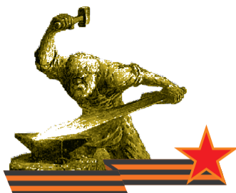
Великой Победе – 70

Наш корреспондент встретился с ветераном и узнал, что совет ветеранов проведет встречи, приуроченные к датам Великой Отечественной. Первая в наступившем году пройдет с блокадниками в честь Дня снятия блокады Ленинграда. В нашем городе их осталось только 58. Праздничные встречи, посвященные этой дате, в ближайшие дни будут организованы городским советом ветеранов во всех районах города.