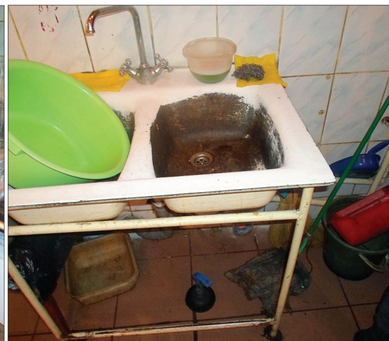
А здесь моют посуду.