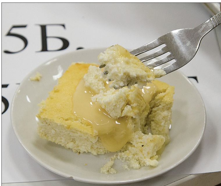
На завтрак – запеканка.