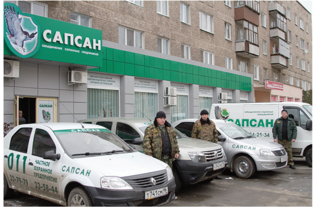
Группа немедленного реагирования.

Кроме разрешения на использование огнестрельного оружия что еще может указывать на высокий уровень подготовки охранников ЧОПа? На мой взгляд, очень важно, прежде всего, для людей, насколько мобильны группы немедленного реагирования. Для своевременного прибытия одной-двух бригад крайне недостаточно. В таком случае не успеть во