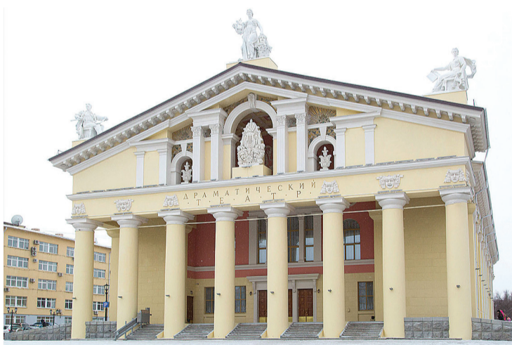
Так выглядит здание драматического театра после реконструкции.

- Театр у нас всегда был шикарным. Сколько помню, всегда, приезжая с Вагонки в центр города, старались с детьми пройти рядом с ним, сфотографироваться. Порадовало то, что при реконструкции учли пожелания тагильчан: сделали более легкие входные двери, установили подъемники для инвалидов. Очень понравился музей. Столько воспоминаний!