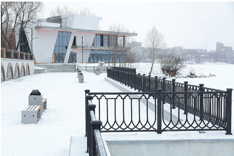
Кафе в центральной части.

Набережная пруда в любую погоду пользуется популярностью у горожан