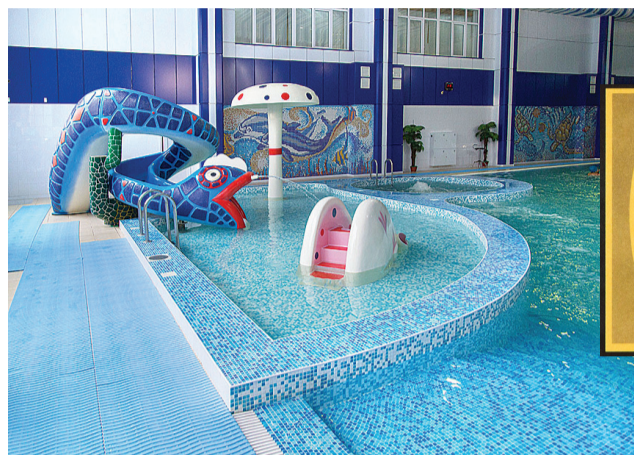
Обновленный аквапарк готов принять всех желающих.

Одно из самых больших и значимых событий – ремонт аквапарка. Из-за большого объема работ пришлось закрыть аквапарк с 8 сентября