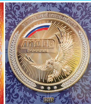
Федеральная награда лучшего предприятия России.

Много перемен произошло и в столовой санатория. На этот раз изменился облик самого важного звена - производственных помещений (склады, мясной и овощной