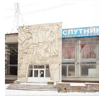
Здание на проспекте Ленина, 28а, было продано за 43 миллиона 364 тысячи 949 рублей.