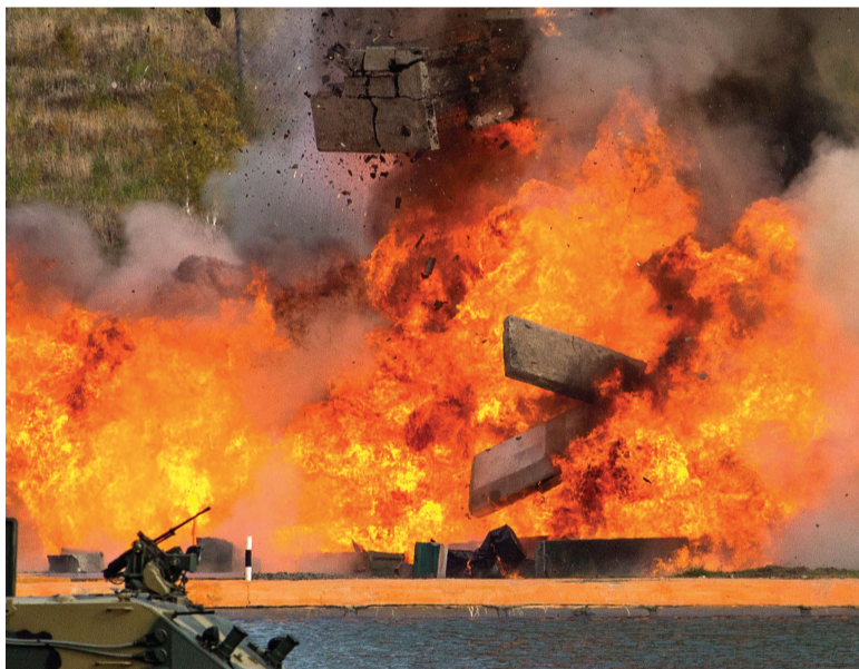
Точное попадание в цель.