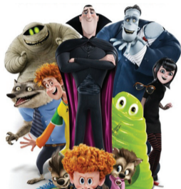
«Монстры на каникулах-2».

по 25 ноября «ГОЛОДНЫЕ ИГРЫ: СОЙКА-ПЕРЕСМЕШНИЦА. ЧАСТЬ 2» 16+ «САВВА. СЕРДЦЕ ВОИНА» 6+ «ШЕФ АДАМ ДЖОНС» 18+ «МОНСТРЫ НА КАНИКУЛАХ-2» 6+ «ГОРОД МОНСТРОВ» 18+ «ВСЕ МОГУ» 16+ «007: СПЕКТР» 16+ В расписании возможны изменения.