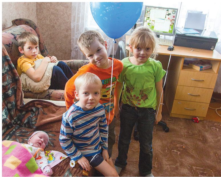
В тесноте, да не в обиде.