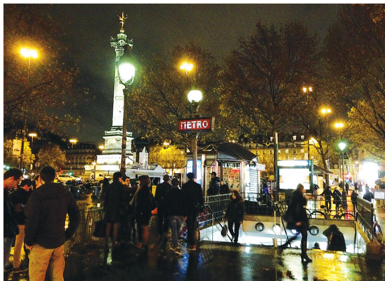
Париж приходит в себя. Метро «Площадь Бастилии».

Да и они не выглядят бандитами и убийцами, их лица не вызывают подозрения, они хорошо одеты, гладко выбриты, говорят без акцента, похожи на всех остальных. Обычные молодые балбесы арабского происхождения. А сколько галлов уехало почувствовать себя «джихадистами»? Выходит, террористом может оказаться любой из нас.