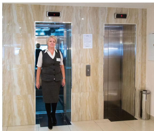
Новые бесшумные лифты.

Лит. № ЛО-66-01-000549 от 9.07.2009 г. выдана министерством здравоохранения Свердлов. области. Реклама