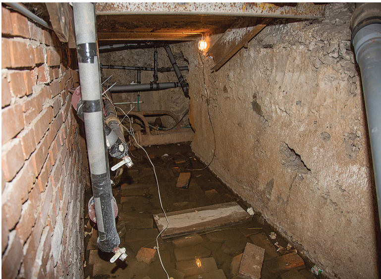
Подвал подтоплен, и этим все сказано.